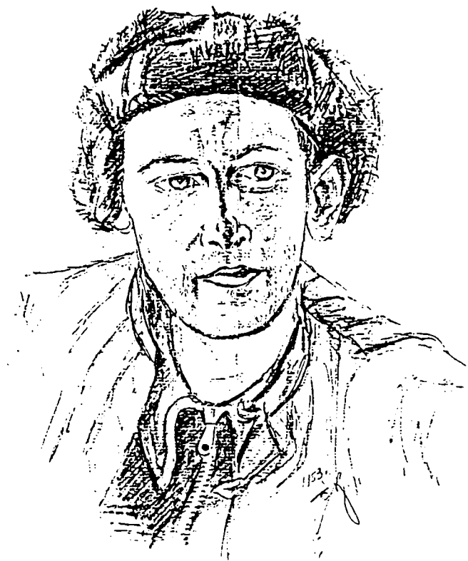
Портрет работы лагерного художника. 1953 г.