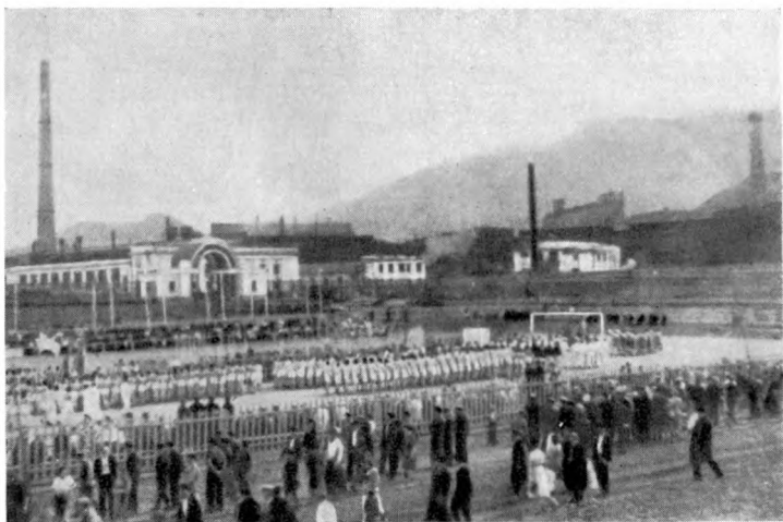
Заполяный Норильск. Спортивный праздник на стадионе.