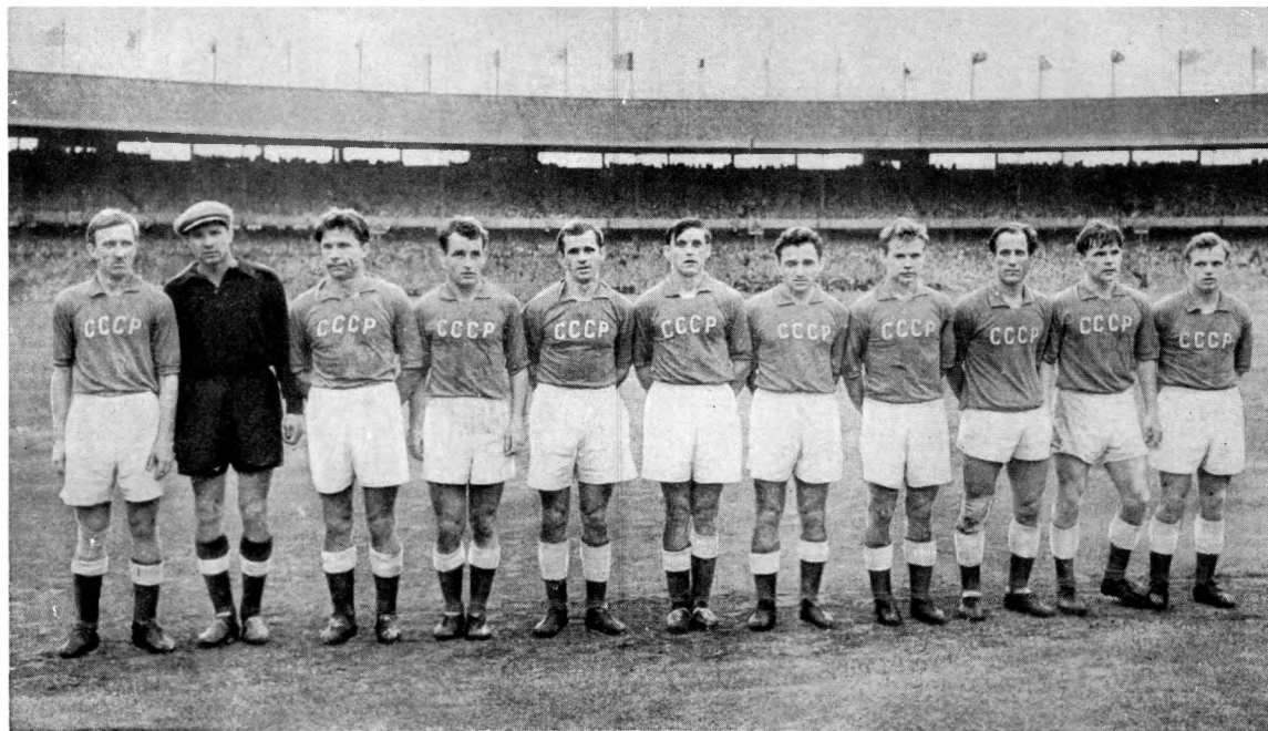
Олимпийские чемпионы: Нетто, Яшин, Башакин, Сальников, Огоньков, Масленкин, Симонян, Ильин, Кузнецов, Исаев, Татушин.