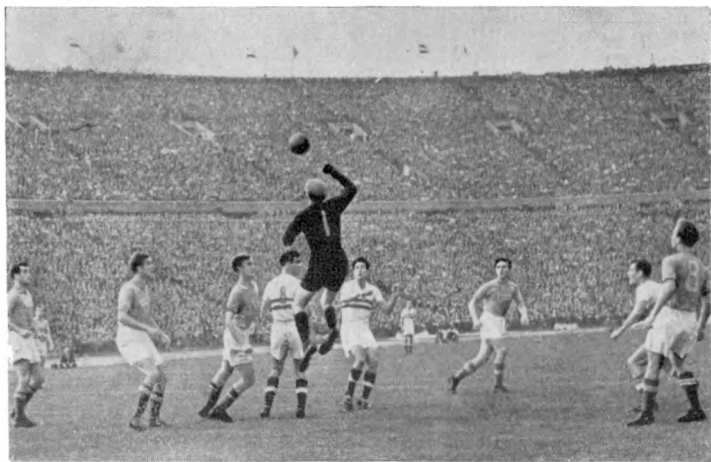
Сборная Венгрии — сборная СССР, 1956 год. Л. Яшин в прыжке на высокий мяч.