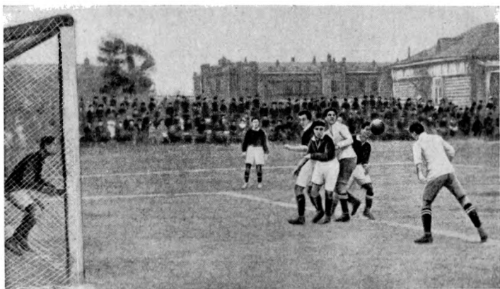
Матч Швеция — Москва в 1913 году на поле Сокольнического клуба спорта. Результат 4:1 в пользу шведов.