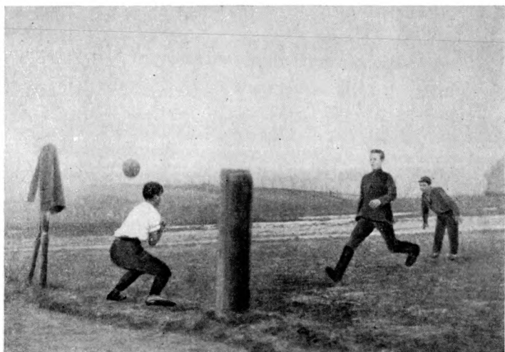
На заре отечественного футбола.