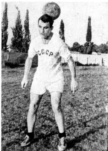
Заслуженный мастер спорта СССР С. Сальников. Жонглирование мячом.