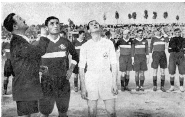
«Спартак» в Болгарии, 1940 год. Жеребьевка.