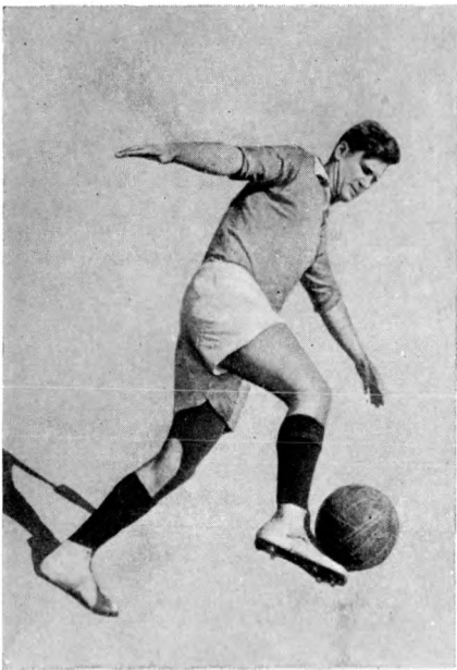
Заслуженный мастер спорта СССР Ф. И. Селин (Москва).