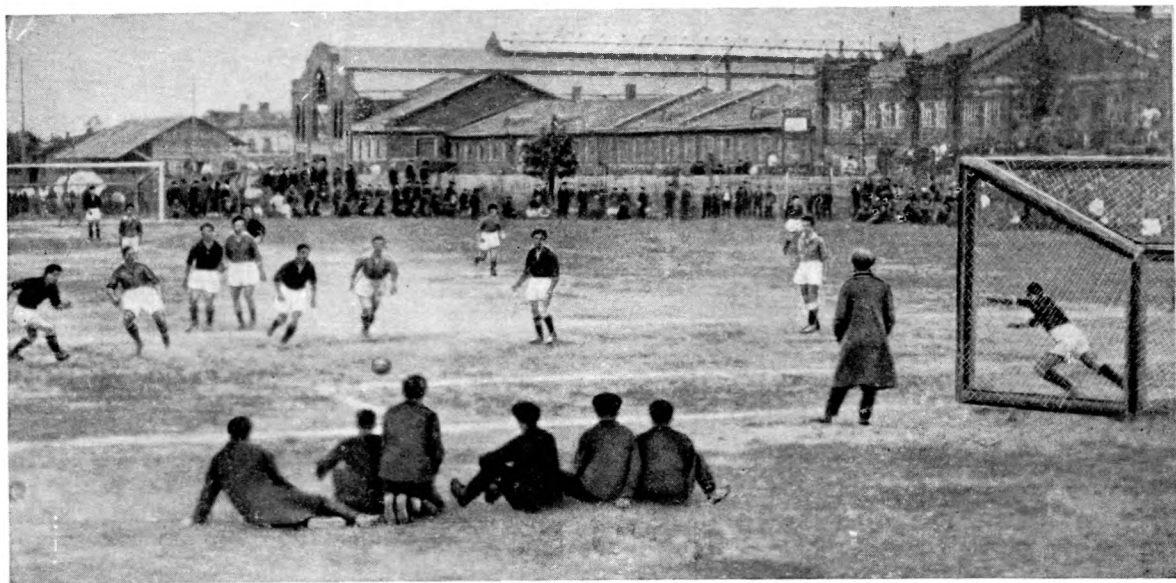
Футбольное поле ЗКС 1924 года, самый большой в то время стадион Москвы.