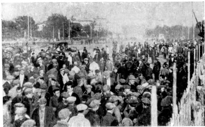
Перед матчем. У стадиона «Пищевик» (ныне стадион Юных пионеров), 1926 год.