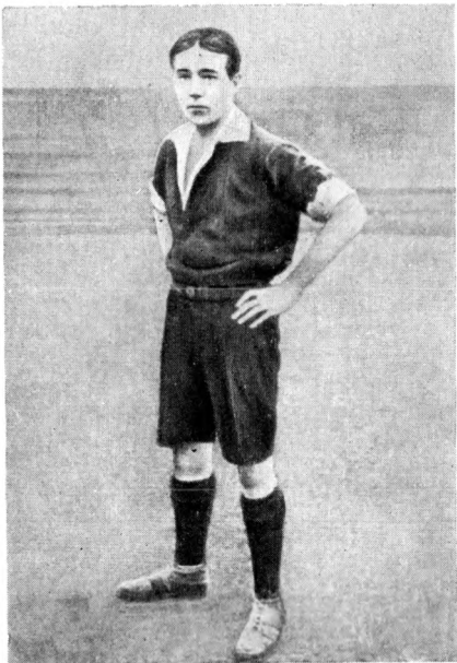
В. Житарев, левый инсайд сборной России на Олимпийских играх в Стокгольме в 1912 году.