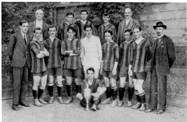
Команда Замоскворецкого клуба спорта — чемпион Москвы 1918 года.