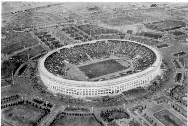
Центральный стадион имени В. И. Ленина в Лужниках, Москва.