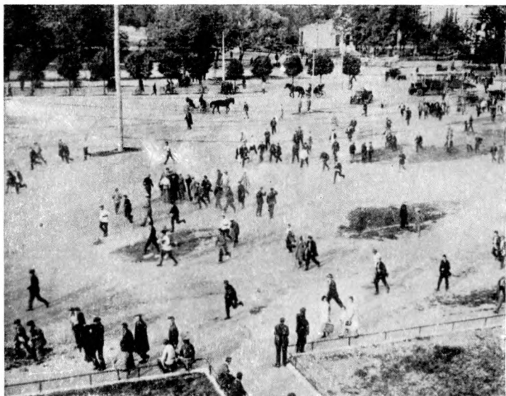
Ленинградское шоссе в 1926 году. На футбол.