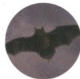
Летучая мышь с. 31