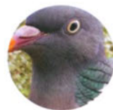
Вяхирь с. 15