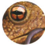
Жаба с. 23