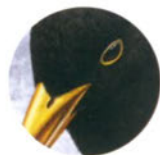
Чёрный дрозд с. 9