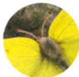
Бабочка с. 17