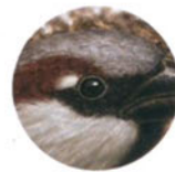
Воробей с. 35