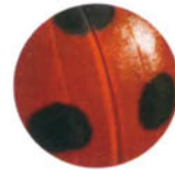
Божья коровка с. 39