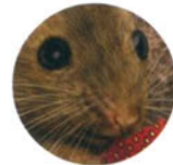
Мышь домовая с. 37