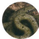
Уж с. 25