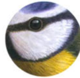
Лазоревка с. 33