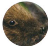
Ёж с. 27