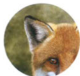
Лиса с. 7