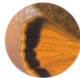
Мотылёк с. 29