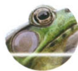
Лягушка с. 13