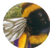
Шмель с. 11