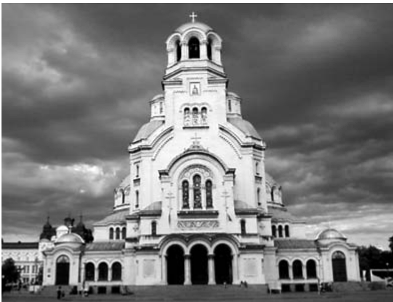
Собор им. Св. Александра Невского, София