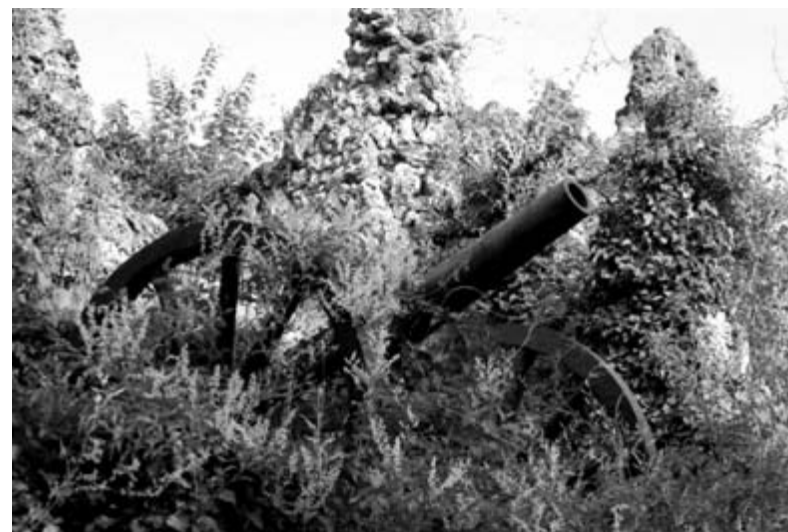
Редут Исса-Ага (Скобелевский №2), восстановленный Заимовым и его друзьями в 1904 г. как памятник отваги Скобелева и его войск. Скобелевский парк, Плевен

Поэт не ошибался. Я, как и многие болгарские дети, вырос в этих парках признавательности. Поэтому для меня вопрос о благо-