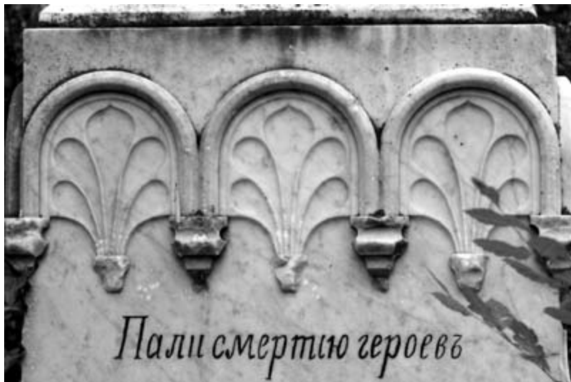
Братская могила павших героев из Скобелевских войск (5-го Калужского Его Императорского Величества полка). Скобелевский парк, Плевен

дарности освободителям не какая-нибудь абстрактная идея, вызванная политической или идеологической необходимостью. Напротив, признательность – это дело живое, и это так не только для меня.