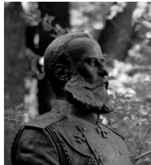
Памятник М.Д. Скобелеву. Бронза. Плевен, Парк-Музей «Дом Царя-Освободителя Александра II»

Когда мы свободны, мы не очень часто задумываемся о свободе. Просто свободно делаем то, что мы делаем – вот и все. Конечно, мы ценим свободу и остаемся признательны освободителям. В честь освободителей наши поэты писали поэмы, а скульпторы и архитекторы создавали памятники. Вначале, когда мы, болгары, получили нашу свободу, мы были склонны чаще задумываться о ней. Нашу признательность мы выразили прежде всего Царю-Освободителю Александру Николаевичу, он был первым, кому болгарский народ воздвиг целый ряд памятников, а после покушения на его жизнь