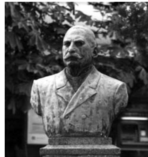
Бюст Стояну Заимову в Плевне, на улице им. Ген. Скобелева, недалеко от Скобелевского парка