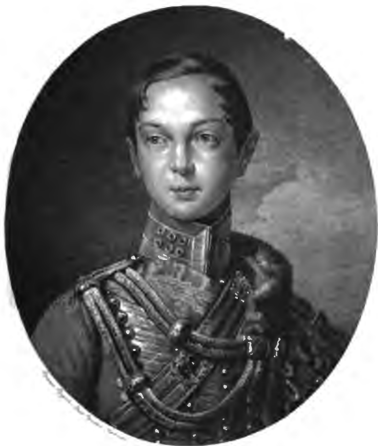
НАСЛѢДНИКЪ ЦЕСАРЕВИЧЪ АЛЕКСАНДРЪ НИКОЛАЕВИЧЪ