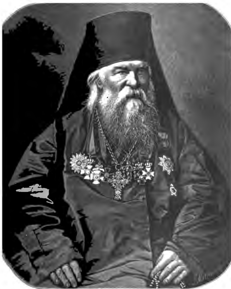
АРХИМАНДРИТЪ ИГНАТІЙ МАЛЫШЕВЪ, НАСТОЯТЕЛЬ СЕРГІЕВСКОЙ ПУСТЫНИ, СОСТАВИТЕЛЬ ПРОЕКТА ХРАМА ВОСКРЕСЕНІЯ ХРИСТОВА ВЪ С.-ПЕТЕРБУРГѢ НА МѢСТѢ СОБІТІЯ 1-ГО МАРТА 1881 Г.