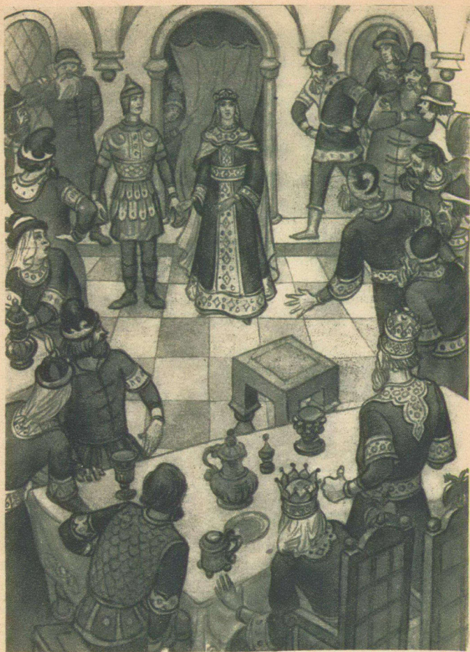
Взяла Василиса Премудрая Ивана-царевича за руку и повела за столы дубовые...