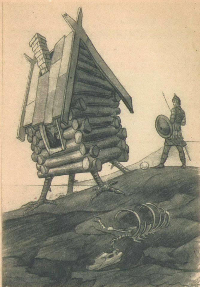
Стоит избушка на куриных ножках.