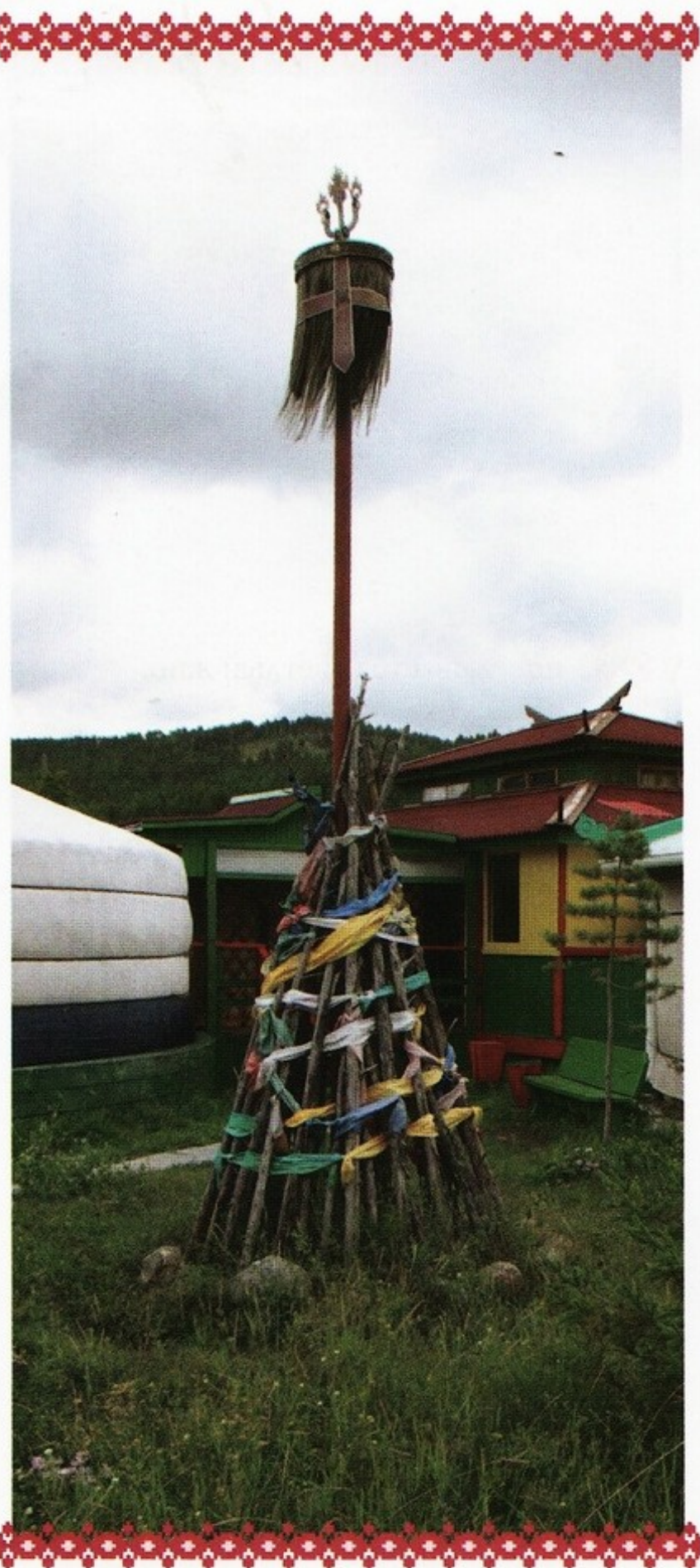
◀ Обо — культовое место для ритуальных поклонений у бурят

Большое значение у бурят придавалось оформлению ритуальной конструкции — табэг. На большом плоском блюде из бообо, пряников, конфет, печенья и других лакомств сооружали своеобразную пирамиду. Все продукты укладывали слоями, количество которых было нечетным 3, 5, 7 или 9. Каждый из них символизировал