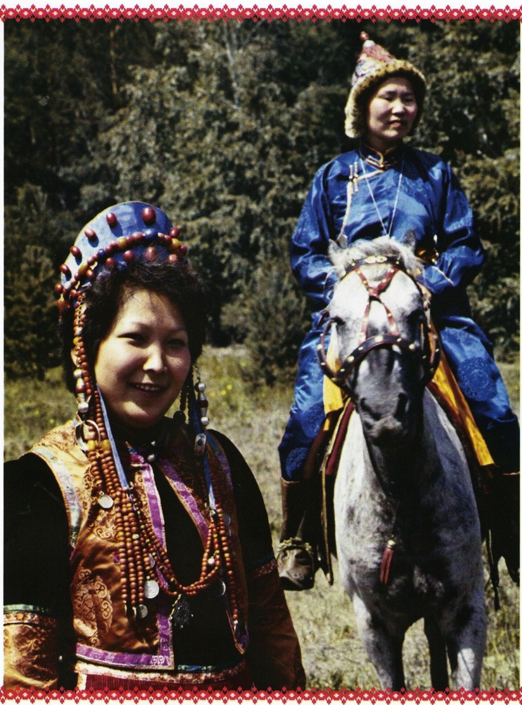
▲ Бурятки в национальных костюмах