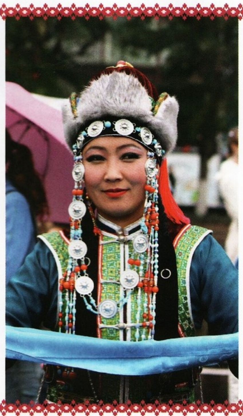
▲ Девушка с хадаком — длинным ритуальным шарфом, буддийским символом гостеприимства и дружбы

Незамужние девушки носили халаты, похожие по своему фасону на мужские. Они отличались лишь кроем и отделкой. Девичий вариант был изящным и подчеркивал красоту фигуры; состоял из двух частей: верхней — кофты, плотно облегавшей стан, с заниженной талией, и нижней — юбки в складку, с разрезом спереди. Воротник, рукава и подол