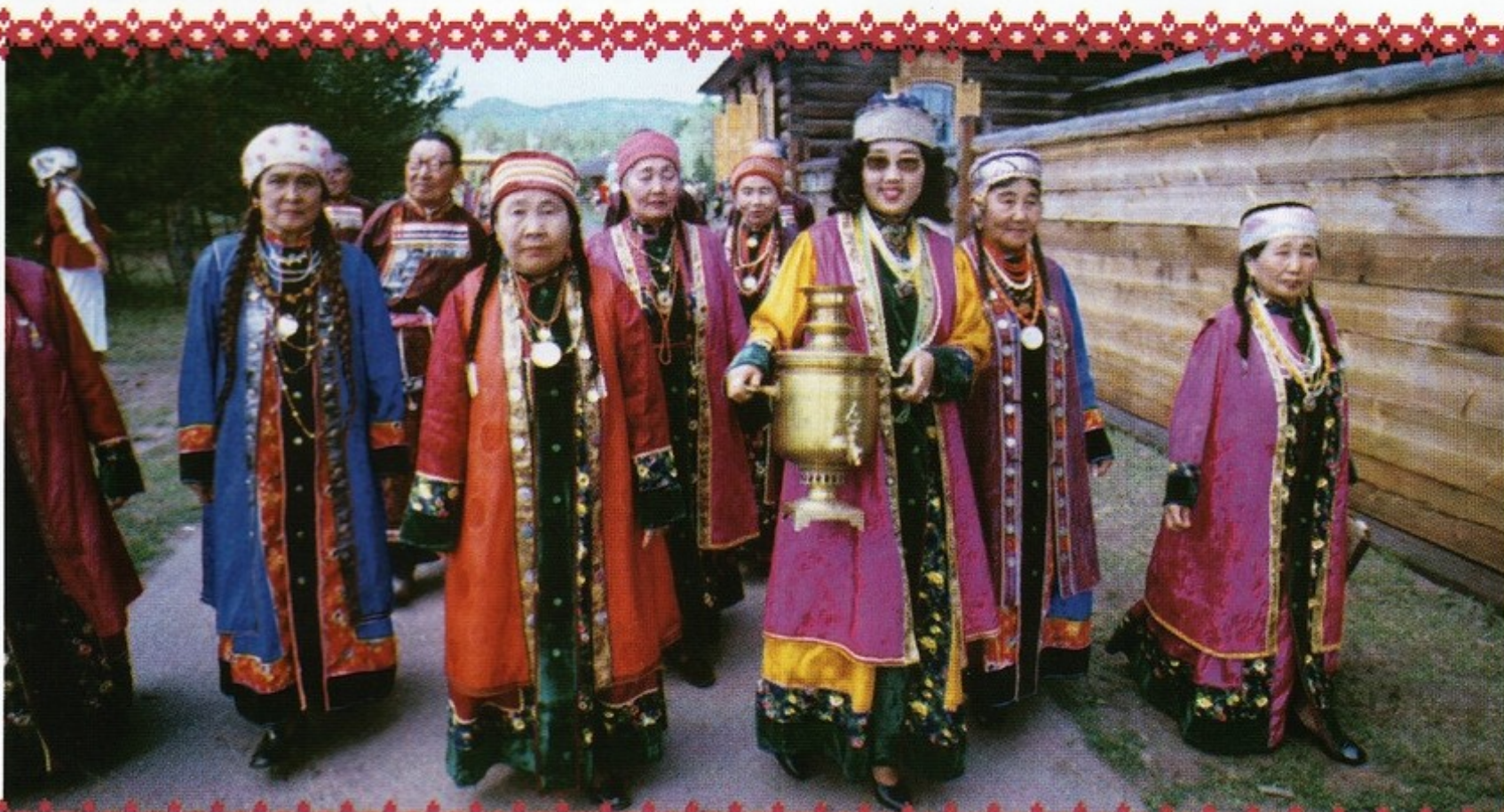
▲ Бурятки в национальных костюмах демонстрируют обряд встречи невесты. Этнографический музей, город Улан-Удэ

ровал 10 лет жизни человека: первый слой означал жаргалан — счастье, второй — зоболон — страдание, третий — вновь жаргалан. Пирамиду из трех слоев сооружали для молодых