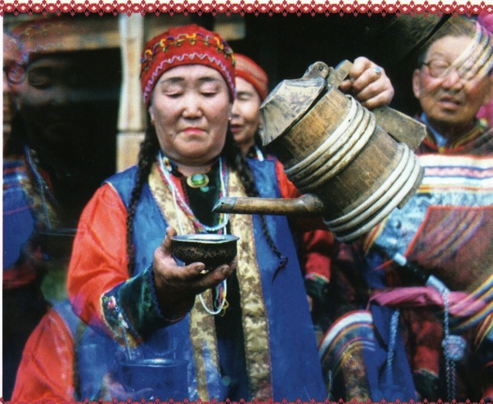
▲ Бурятка в национальном костюме демонстрирует обряд встречи гостя. Этнографический музей, город Улан-Удэ