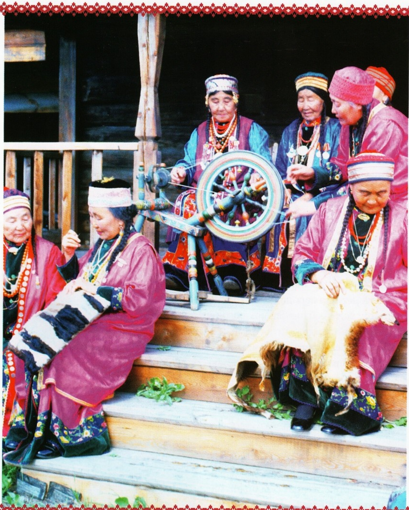
◀ Бурятки в национальных костюмах демонстрируют местные ремесла. Этнографический музей. Город Улан-Удэ

Шитьем кож занимались в основном женщины, они же выделывали кожу и замшу для одежды и обуви. Для работы с кожей использовали нитки — чумыс, сделанные из высушенных и разделенных на волокна сухожилий животных.