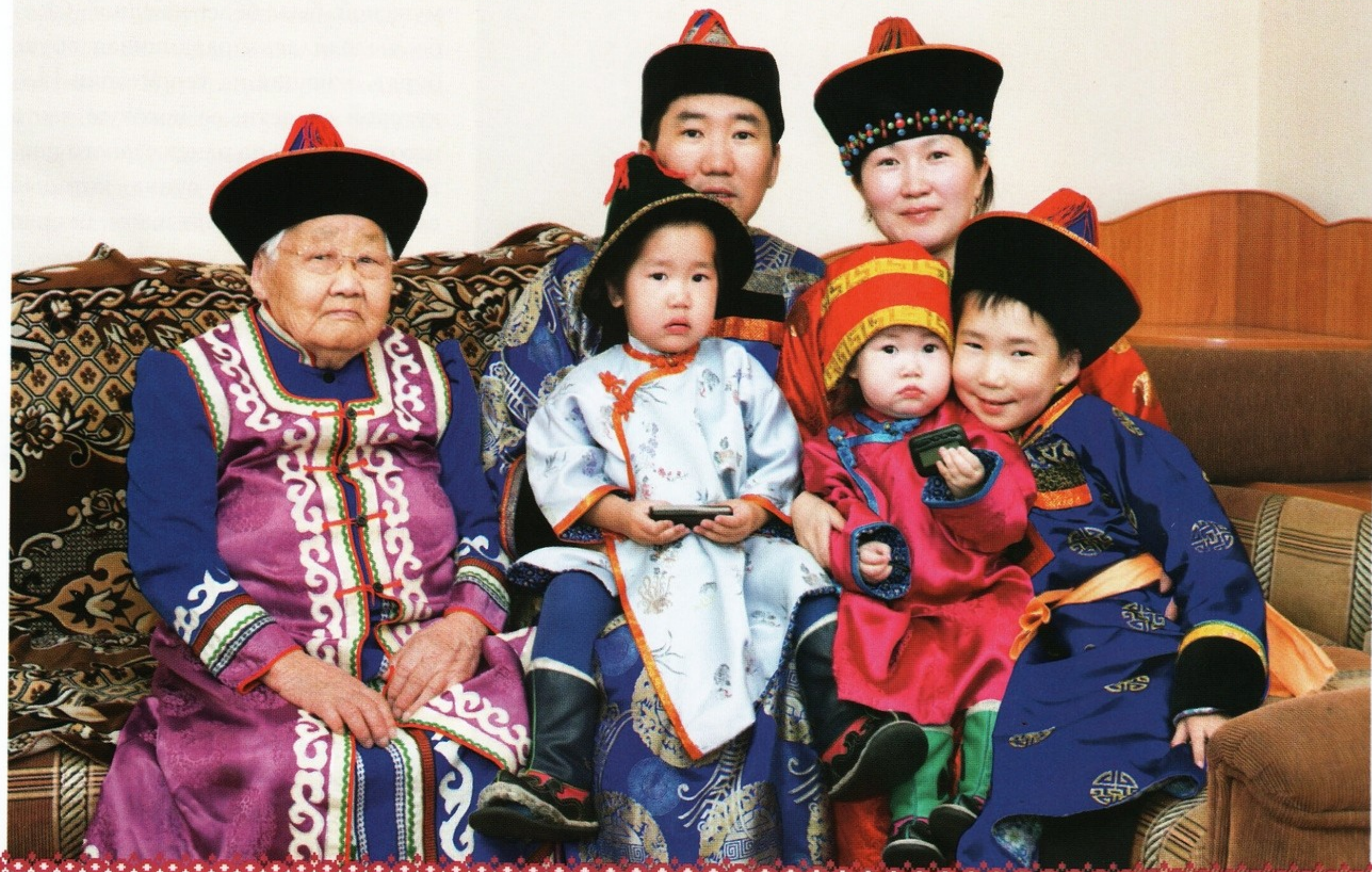
▲ Бурятская семья в национальных костюмах

Зимой поверх дэгиля надевалась доха. Иногда она состояла из двух шкур, сшитых на плечах, образовывавших глухую накидку без боковых швов, с отверстием для головы. Но если доху сшивали по бокам, сзади делали разрез для удобства во время верховой езды. С развитием скотоводства звериные шкуры уступили место выделанной овчине.