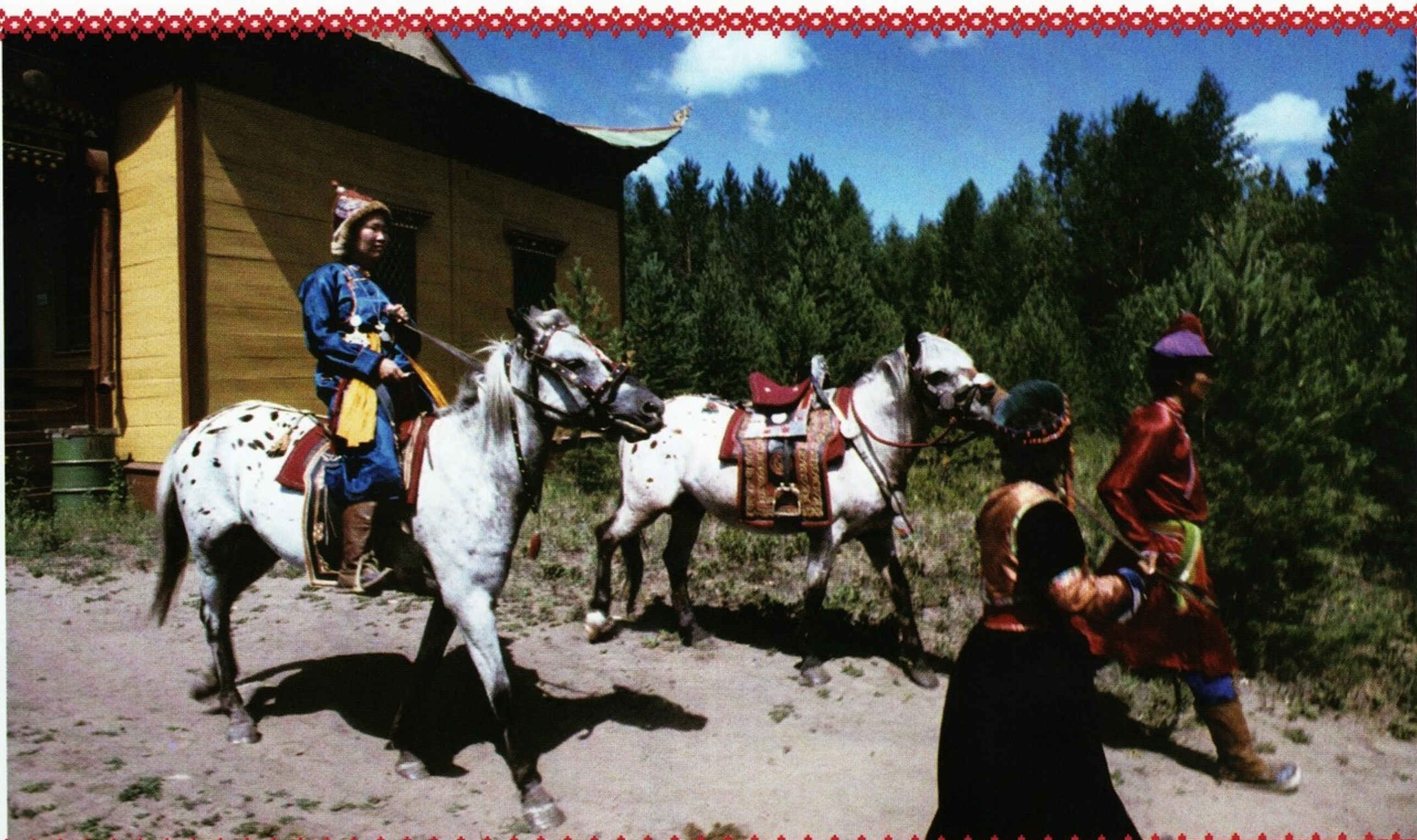
▲ Обряд встречи невесты

Задолго до назначенного дня свадьбы родители с обеих сторон оповещали своих родных и односельчан о дне церемонии. Он приходился обычно на пятницу, воскресенье, понедельник, среду, которые считались благоприятными. Гости со стороны невесты собирались в ее доме и устраивали проводы девушки (басаганай наадан). Каждый приглашенный мог принести с собой прибавку к свадебному угощению или же преподнести невесте деньги. Свадебный поезд выезжал с таким расчетом, чтобы прибыть к дому жениха в послеобеденное время. Когда он находится в 3—5 километрах, навстречу ему выезжали 6—9 человек со стороны жениха во главе со старшим сватом или почтенными стариками, знающими тонкости свадебной церемонии.