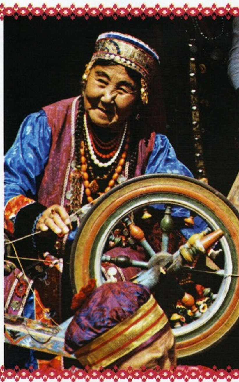
▲ Бурятка за прялкой. Забайкальский костюм

тали на берегах Ангары. По течению реки Белой и ее притокам селились аларские племена, по Куде до Байкала — кудинские. У юго-западной оконечности самого глубокого пресноводного озера мира, между Байкальским и Саянским хребтами, по реке Иркуту жили тункинцы. На острове Ольхоне — ольхонцы.