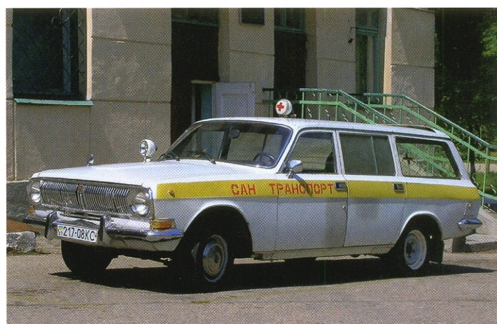
Старенькая ГАЗ-24-13 «Волга», переведенная на хозяйственную службу

проблесковые маячки синего цвета. Но использовать санитарные «Волги» в качестве машин скорой помощи было не только неудобно, но и небезопасно для больных, поскольку тесный салон затруднял проведение даже простейших лечебных действий. Невозможно было, например, поставить капельницу — высоты потолка явно не хватало для того, чтобы раствор самотеком поступал из емкости. Необходим был специальный насос, который в советское время был в жутком дефиците. Если же в пути