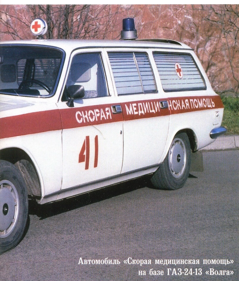
Автомобиль «Скорая медицинская помощь» на базе ГАЗ-24-13 «Волга»