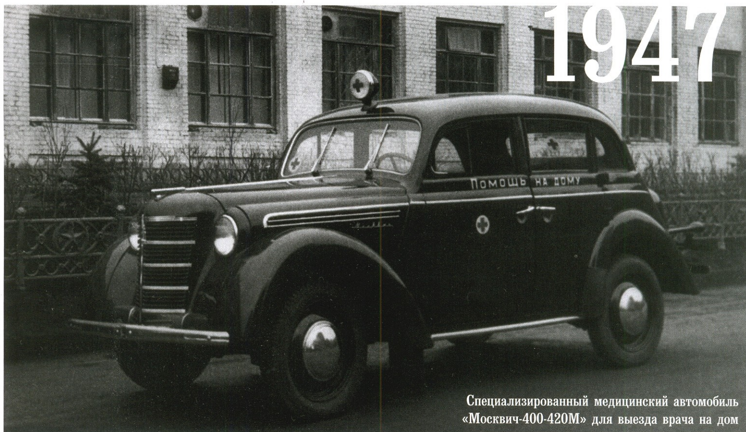
Специализированный медицинский автомобиль «Москвич-400-420М» для выезда врача на дом

были заменены легковыми автомобилями только в 1934 году. Тогда же была предпринята безуспешная (и бессмысленная) попытка «административно-командным» методом переименовать «неотложную помощь» в «ночную медицинскую помощь». В 1938 году ленинградская «неотложка» была вновь реорганизована на основе принципов работы аналогичной службы в Москве.