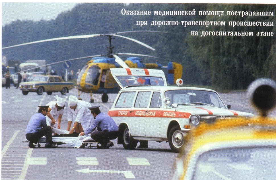
Оказание медицинской помощи пострадавшим при дорожно-транспортном происшествии на догоспитальном этапе

■ Медицинские автомобили, «работающие» в сельской местности (ввиду их немногочисленности, больших расстояний, которые приходится покрывать для визита к больному, и ужасного состояния дорог), не подлежат классификации. Зачастую один автомобиль выполняет функции и скорой, и неотложки, и разъездного транспорта участкового. В связи с этим трудно переоценить роль, которую в нашей глубинке сыграли санитарные «уазики» УАЗ-469БГ, выпускавшиеся с первой половины 70-х годов XX века. Для установки носилок спинка переднего правого и часть спинки заднего сиденья складывались. Возле двери водителя крепилась поворотная фара-искатель. Оповестительным знаком «медицинского» автомобиля служил фонарь с красным крестом.