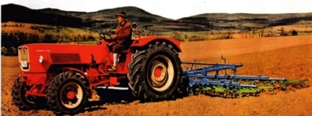
Фотография из рекламного проспекта трактора Guldner G 60 / G 60 A.

два, три, четыре и шесть цилиндров. Одноцилиндрового двигателя у компании в программе уже не было, как и соответствующих двигателей сторонних производителей. Теперь полный привод был частью ассортимента компании «Гюльднер», и тракторы компании окрашивали в красный цвет, а колесные диски – в серый. Переработали и дизайн.