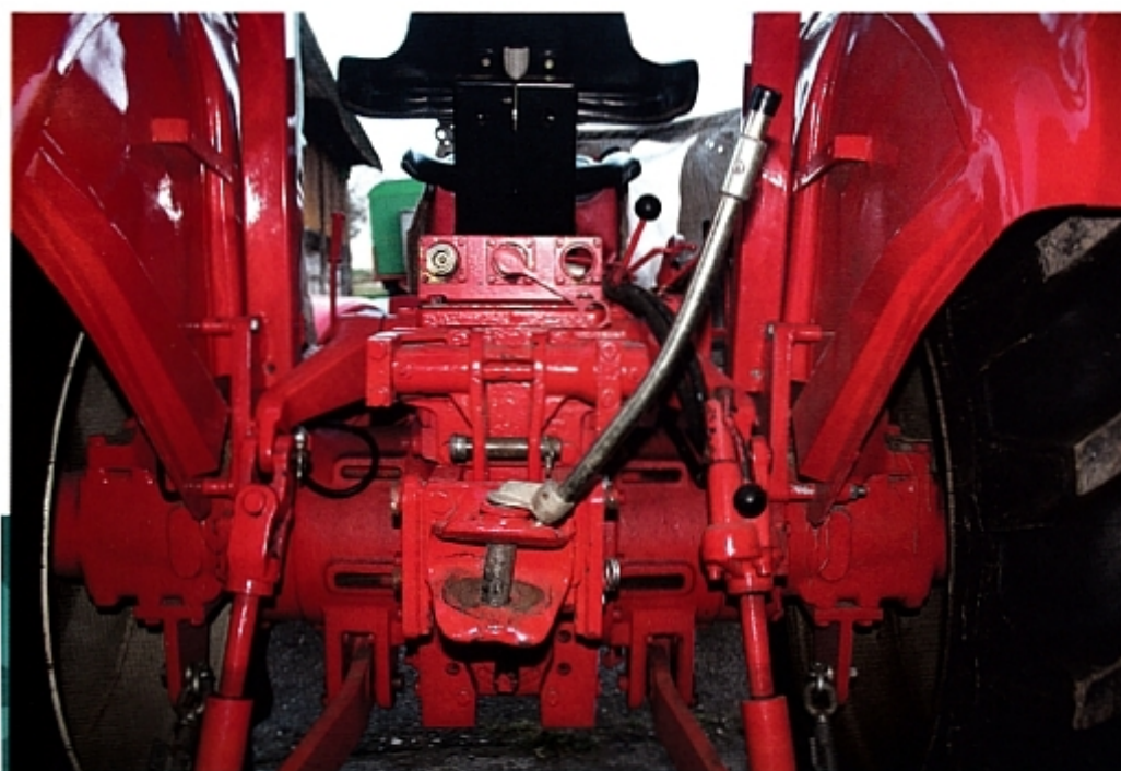
Güldner G 60 A, вид сзади.

Сегодня тракторы «Гюльднера» среди ретро-моделей относятся к премиум-классу. На вершине всей серии G, удостоиваясь королевских почестей, стоит полноприводной G 75, следующая модель с шестицилиндровым двигателем уже G 60. Их редко выставляют на продажу, спрос на них высок, цены на них за последние десять лет стремительно подскочили.