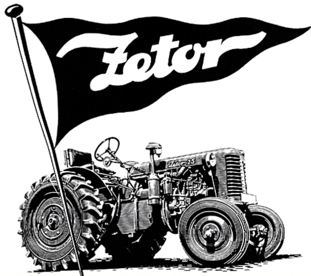
Модернизация в модели 25 А касалась преимущественно деталей, но теперь в качестве опции была доступна гидравлика.

После Первой мировой войны Австро-Венгерская империя развалилась, и Центральная Европа была разделена на несколько стран. В результате в 1919 году между Австрией и Польшей появилась Чехословакия, в которой в одно государство объединились чехи и словаки. Столицей новой страны стала Прага. 25 февраля 1948 года Чехословакия присоединилась к социалистическому блоку. Страна стала Народной Республикой. В 1968 году в стране началась знаменитая «Пражская весна», ратовавшая за коммунизм с человеческим лицом. В 1993 году страна разделилась на два государства – Чешская Республика и Словацкая Республика.