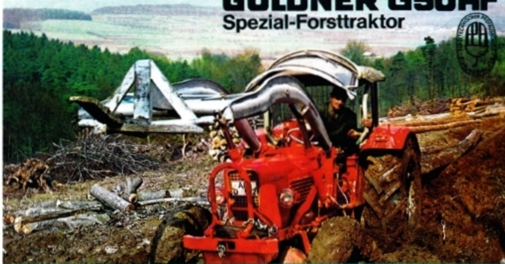
Guldner G 50 AF, полноприводной лесозаготовительный вариант.