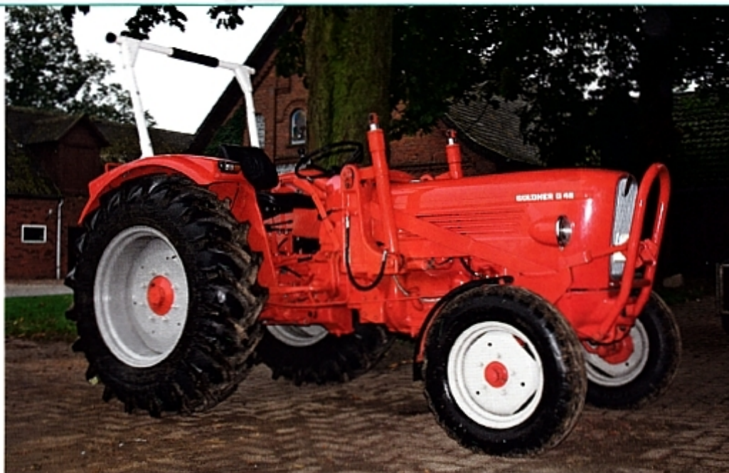
G 45 был представителем среднего класса мощности «Красного золота» компании «Гюльднер».

Трактор G 60 был последней моделью тракторного ассортимента компании «Гюльднер». В 1969 году выпуск этой техники предприятие прекратило. В то время доступный покупателям с марта 1968 года G 60 был финальным представителем легендарной серии G.