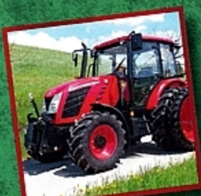
Тракторы Zetor: солидные и недорогие