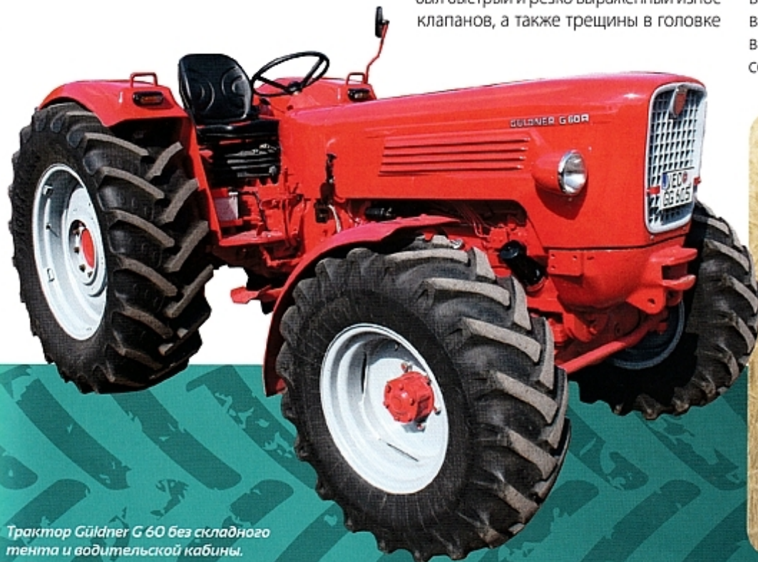
Трактор Güldner G 60 без складного тента и водительской кабины.

Оснащение приборной панели удовлетворяло всем пожеланиям. Прежде всего в глаза бросались два расположенных справа рычага переключения передач на рулевой колонке – техническая сенсация конца 1960-х годов. Щедрых размеров комбинированный тахометр со встроенным счетчиком моточасов давал всю связанную с двигателем информацию. Особенно важен был показ температуры, чтобы водитель был предупрежден о перегреве.