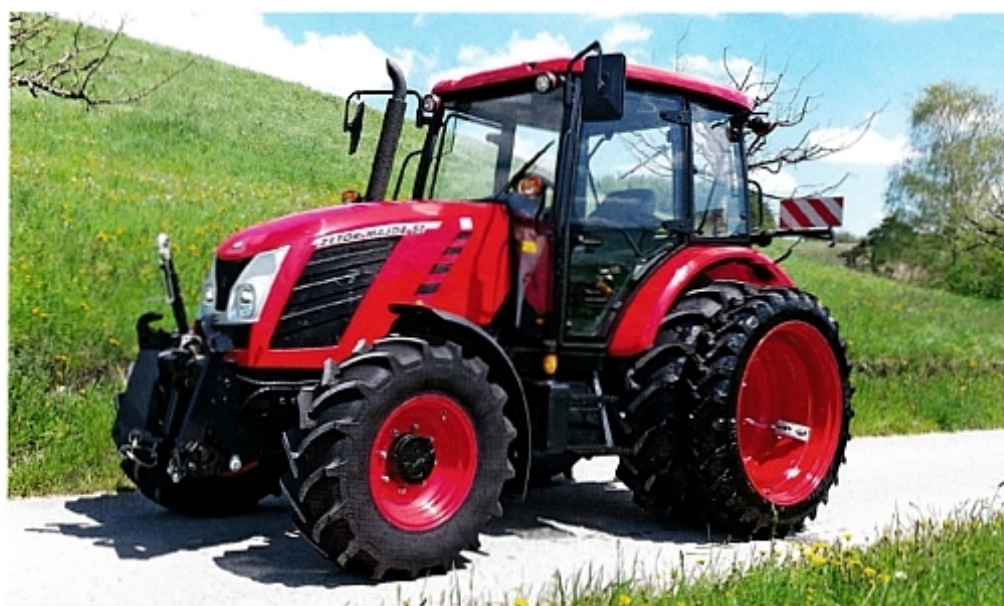
Современный Zetor Major 80 мощностью 75 л. с. подходит как тягач в сельском хозяйстве и носитель легкого навесного оборудования.

пришлось восстанавливать, поскольку оно было сильно разрушено авианалетами и артиллерийскими обстрелами. В 1952 году завод «Збройовка» перебазировал свое тракторостроительное подразделение в это место, где оно находится и по сегодняшний день. Первой серийной моделью, выпущенной в 1954 году в Лишени, был Zetor Super 35 – трактор с четырехцилиндровым двигателем и мощностью 42 л. с. Центральная ось с листовыми рессорами и подпружиненное сиденье повышали комфорт в кабине, она была даже оборудована обогревателем. К 1960 году было выпущено 21 500 тракторов этого типа.