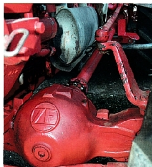
Шарнирная головка мощной оси G 60 A от концерна ZF.

Под капотом громко и полнозвучно работали шесть цилиндров. Дизельный двигатель 6L 79 представлял собой задросселированный до 60 л. с. посредством снижения числа оборотов агрегат G 75. Создавался он в соответствии с известной агрегатной компоновкой L 79 компании «Гюльднер», согласно которой в серии G варьировались 2-, 3-, 4- и 6-цилиндровые модели. Двигатель трактора G 60 при езде на низких оборотах, в особенности в режиме нагрузки, был склонен к перегреву, прямым следствием этого был быстрый и резко выраженный износ клапанов, а также трещины в головке