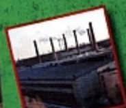
Кировский завод и экология