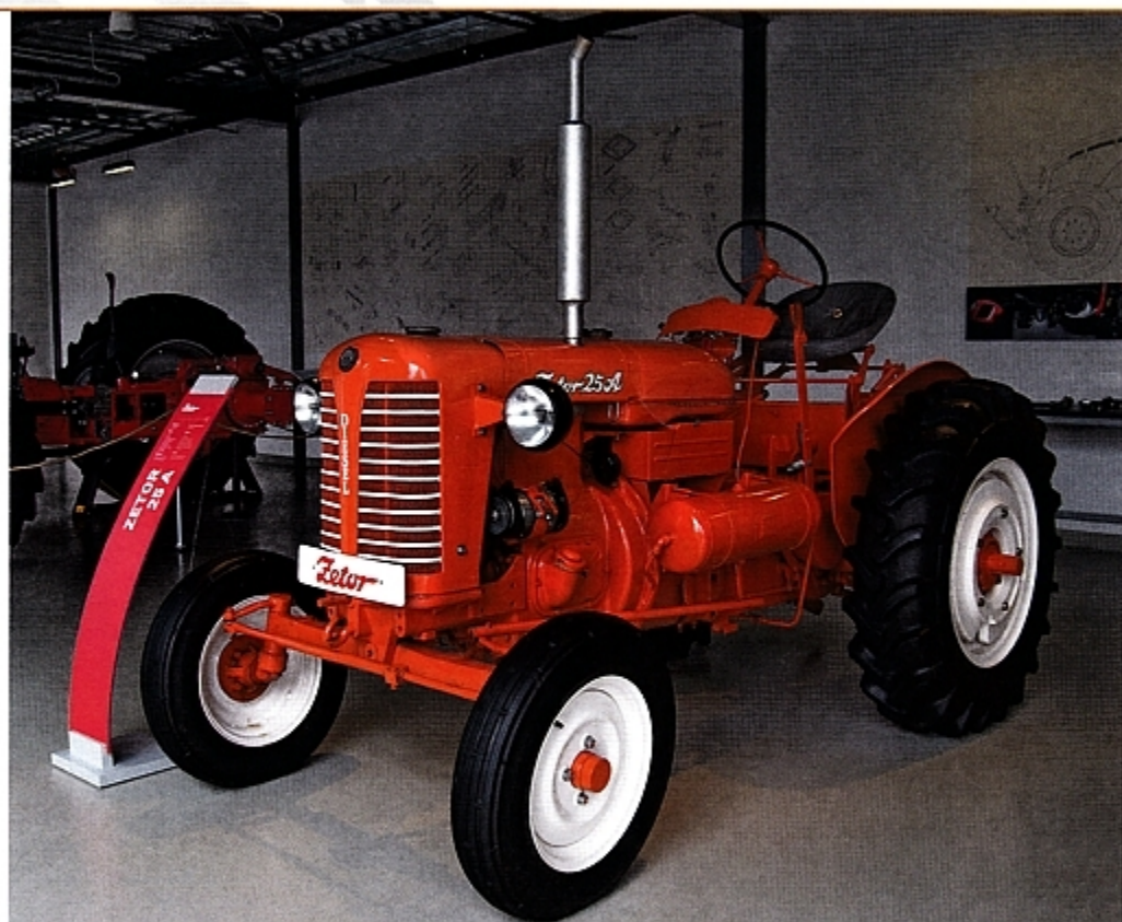
Zetor 25 имел немало преимуществ по сравнению с тракторами с запада. Прочный, мощный, массивный – его конструкция была солидна.

Экспертному сообществу трактор Z-25 представили на сельскохозяйственной выставке в Праге в том же году. Трактор блочной конструкции, с водоохлаждаемым двухцилиндровым дизельным двигателем, имел мощность 26 л. с. И хотя задумывали средний трактор для отечественного сельского хозяйства, он превратился в экспортный хит. Недорогая и солидная модель Zetor была пригодна для применения почти во всех сферах сельского