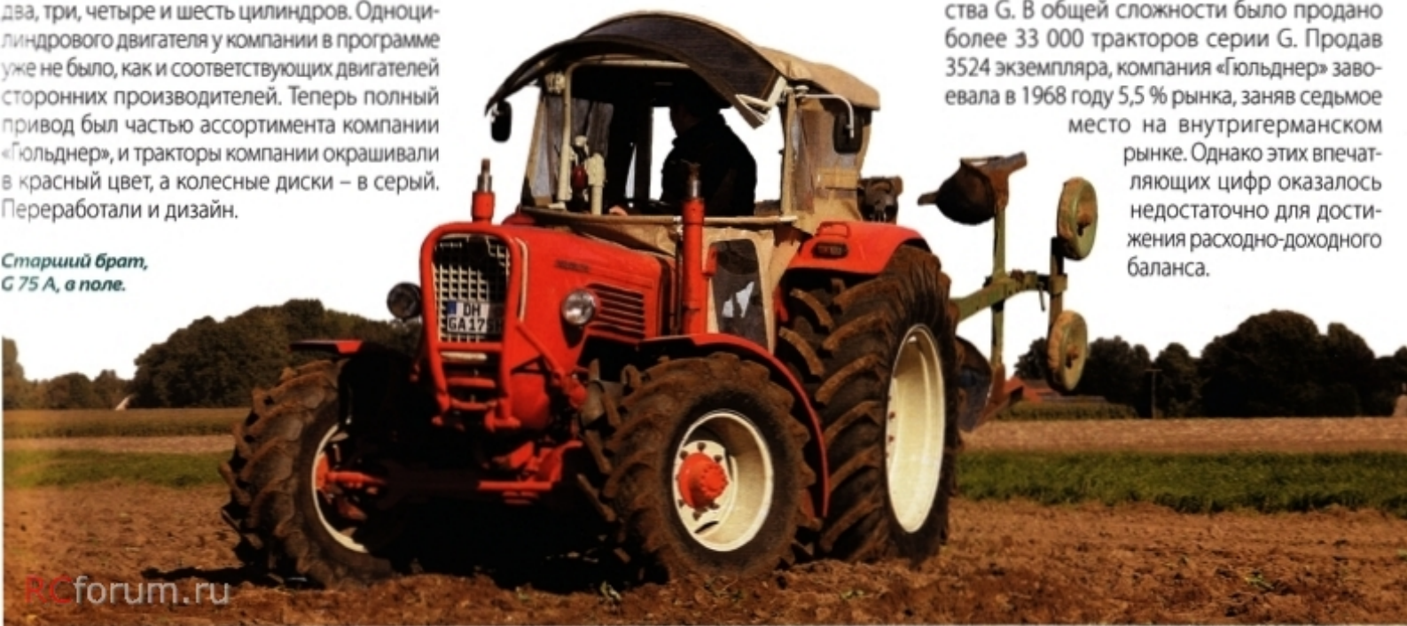
Старший брат, G 75 A, в поле.

два, три, четыре и шесть цилиндров. Одноцилиндрового двигателя у компании в программе уже не было, как и соответствующих двигателей сторонних производителей. Теперь полный привод был частью ассортимента компании «Гюльднер», и тракторы компании окрашивали в красный цвет, а колесные диски – в серый. Переработали и дизайн.