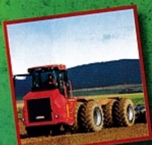
Немецкий трактор Terra Variant