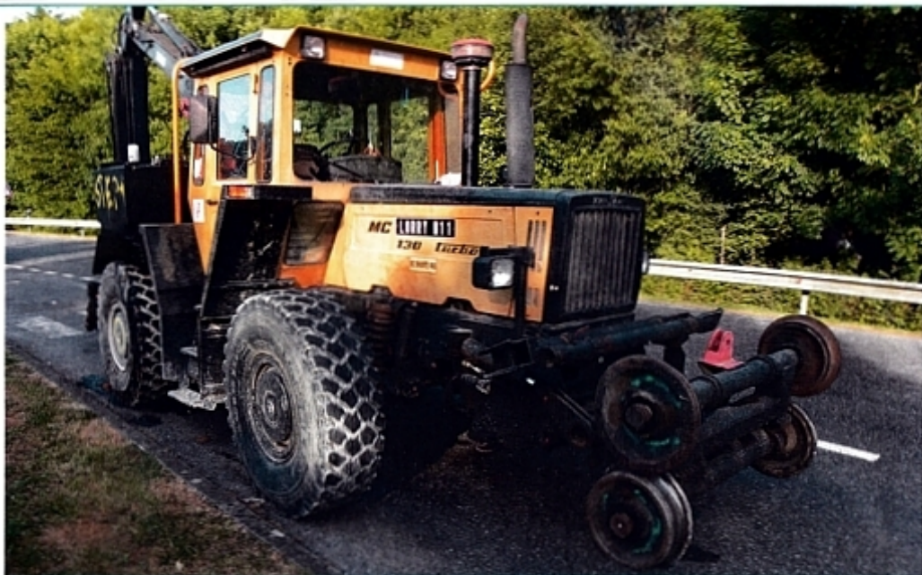
Дорожно-рельсовая модель с экскаватором на корме на работе во Франции.

Спрос увеличивался, производство росло. Посредством MB-trac 1100 компания «Мерседес-Бенц» учредила новый класс мощности и обрела большое влияние. До 1984 года 1100-е сходили с конвейера в первом исполнении. Затем без проблем перешли к следующей конструктивной версии. В 1987 году ее в свою очередь сменила новая модель, с модернизированным двигателем. Примерно за 15 лет производства MB-trac 1100 завоевали репутацию надежного транспортного средства и способствовали популяризации тракторов Trac в 1980-х годах. В середине этого десятилетия MB-trac 1100 считался непревзойденным универсалом и новатором в области коммунальной техники. В этой сфере его ждала на удивление долгая жизнь, в особенности в качестве представителя тяжелого класса. До прекращения производства Trac в 1991 году модель 1100 постоянно была в продаже. Даже сегодня эти машины продолжают служить во всем мире.