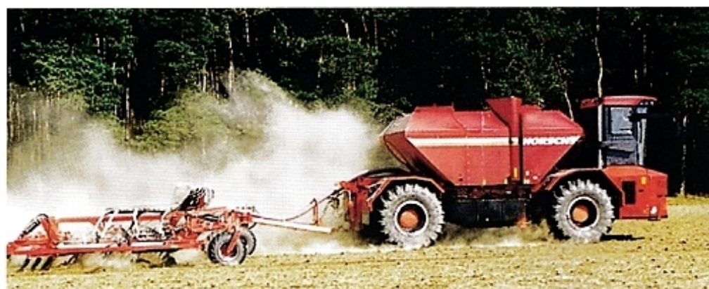
Трактор Terra Variant просто переключается с одного вида работ на другой.

Несмотря на свои размеры, трактор Terra Variant очень мобилен. Незначительный радиус поворота четырех управляемых колес делает его чрезвычайно маневренным.