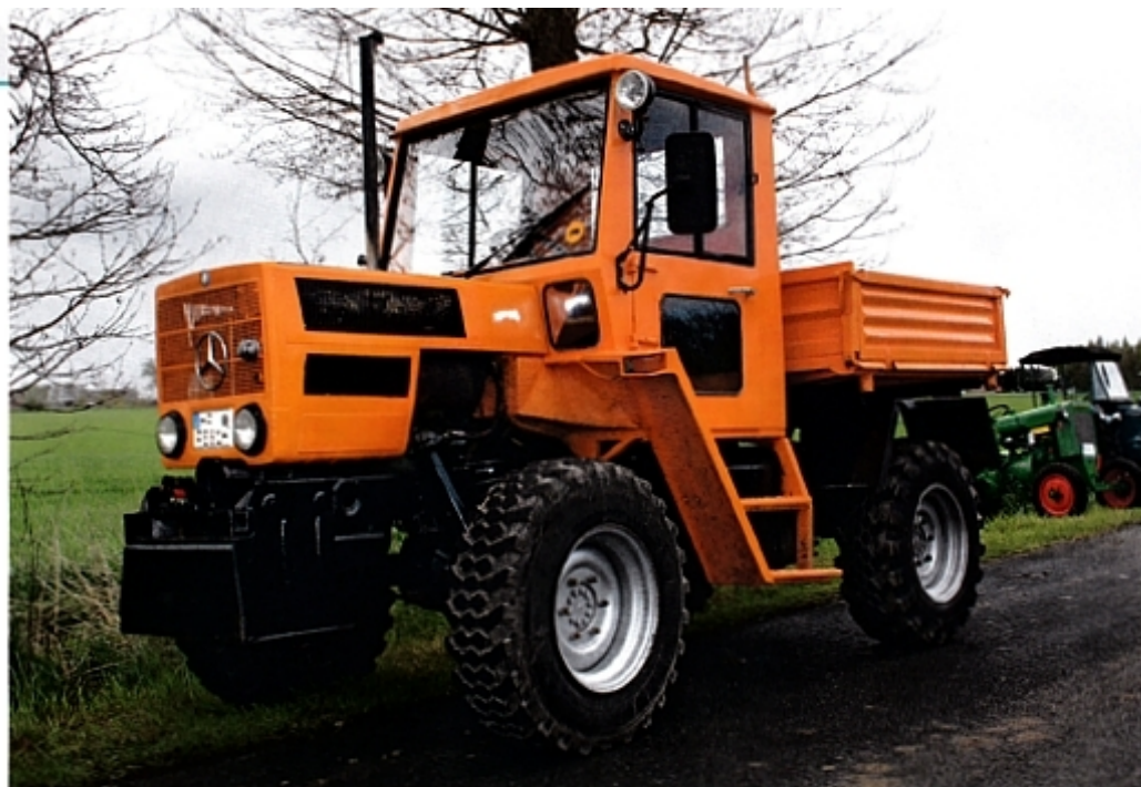
MB-trac 700 как муниципальное транспортное средство, оборудованное кабиной прямого бортового кузова самосвала.

В середине 1980-х годов европейское сельское хозяйство достигло высокого уровня механизации. Тракторов уже было достаточно. Крупные компании делают ставку на соответствующую