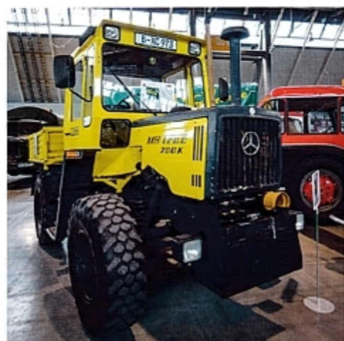
Меньший брат трактора MB-trac – 700 K.

После многообещающего начала в аграрном секторе компания Mercedes-Benz («Мерседес-Бенц») в 1970-е годы постоянно расширяла ассортимент, добавляя различные тракторы MB-tracs.