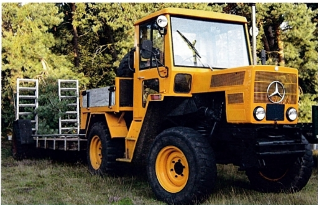
MB-trac подходил и в качестве тягача для работы с прицепом.