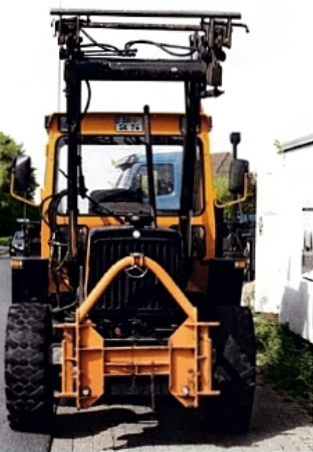
Большое преимущество трактора MB-trac – быстрая смена навесного оборудования.