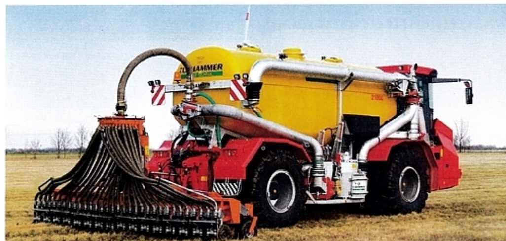
Бортовой компьютер автоматически регулирует норму внесения удобрений даже при изменении скорости и ширины захвата.

секунды. Бортовой компьютер и система GPS-навигации также снижают нагрузку на водителя. В просторной комфортабельной кабине достаточно места и доступен круговой обзор для двоих. Полностью автоматическая система кондиционирования воздуха, а также тонированные стекла гарантируют хорошее самочувствие при сильной жаре. При необходимости ночной работы мощные ксенонные фары освещают рабочую зону. Удобные сиденья с пневматической подвеской позволяют водителю работать долгие часы без чрезмерной усталости. Кроме того, регулируемая в трех позициях рулевая колонка помогает установить оптимальное положение для каждого тракториста. А чтобы не заскучать во время работы, фермер может прямо в кабине настроить СВ-радиостанцию, установить и слушать радио и пользоваться телефоном.