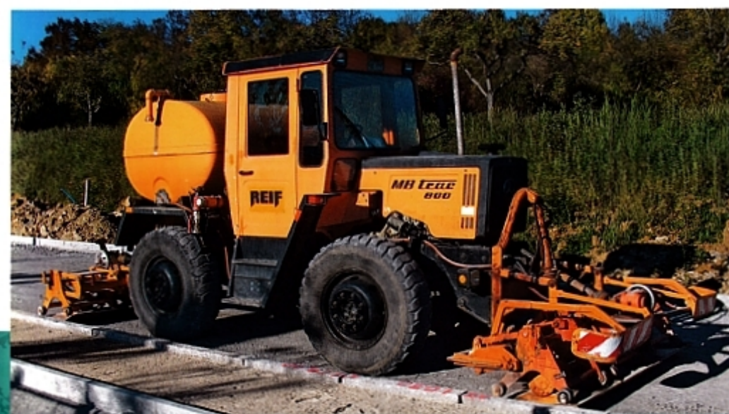
MB-trac 800 служит уплотнителем плитки и цистерной для воды.

Помимо этих удобств, MB-trac 1100 обладал множеством технических аспектов, делавших его незаменимым для применения в коммунальном хозяйстве. Особенность этой тяжелой серии (в том числе моделей MB-trac 1100 и 1300) заключалась в прекрасных возможностях реверсивного механизма. Благодаря ему водитель легко маневрировал 110-сильным трактором с прицепом в уличном движении или с дополнительным оборудованием