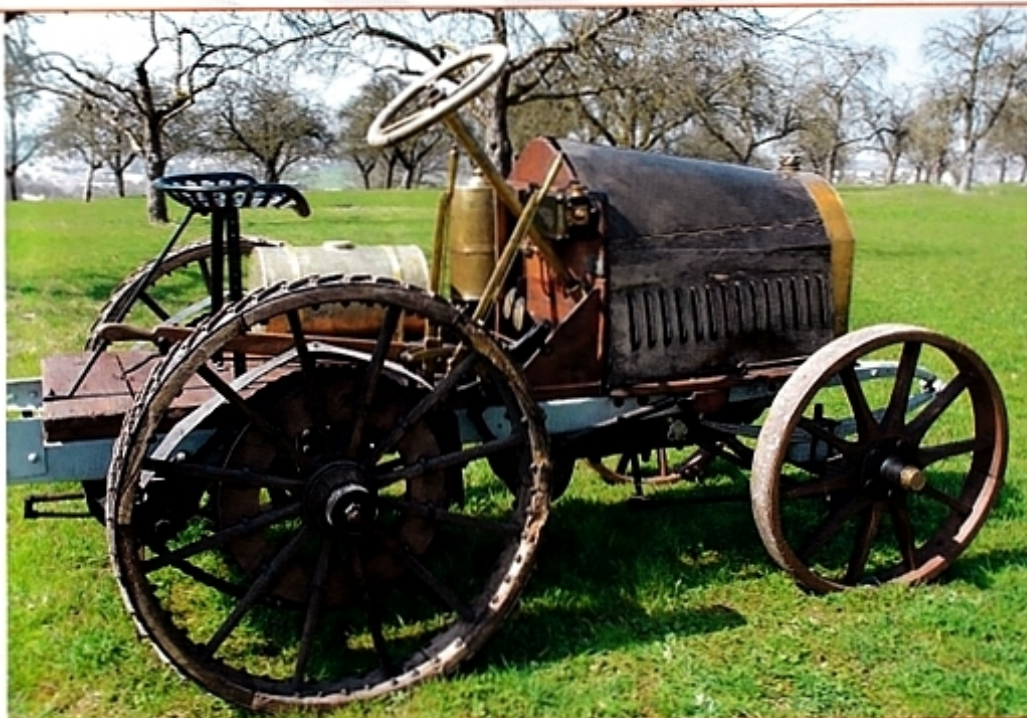
Трактор «Бергманн» 1906 года изготовлен из дерева, стали и железа. Согласно современным данным, это старейший трактор в Германии.