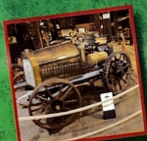
Старейший трактор Германии