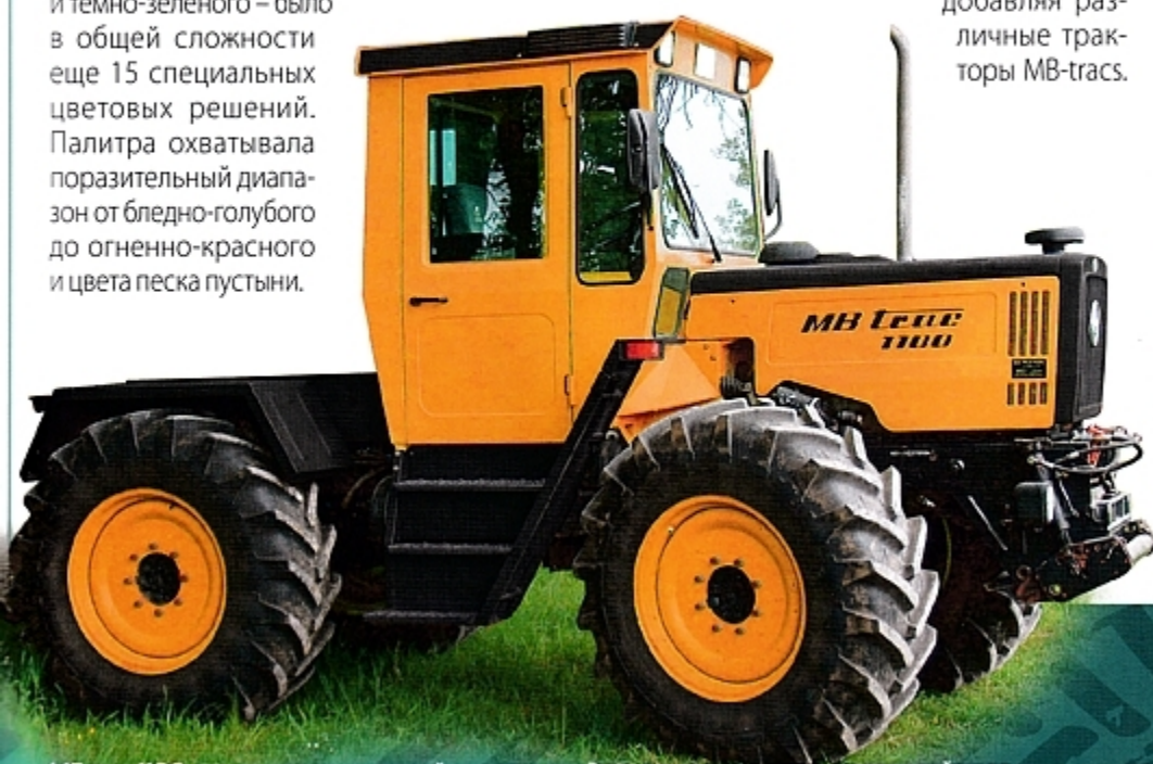
MB-trac 1100 в типично оранжевой окраске предприятия коммунального хозяйства.

Сенсацией в первую очередь стало представление моделей 1100 и 1300 тяжелого класса, увеличившее клиентский спрос. Переработанная концепция появилась на рынке в самый подходящий момент, прежде всего для коммунальной сферы. Ядро ее грузового парка преимущественно составляли работавшие по всей стране меньшие грузовики Unimog. Благодаря трактору MB-trac 1100, представлявшему своего рода сверхкрупный вариант «универсального моторного устройства», коммунальщики прорвались в новый класс мощности. При этом они извлекали пользу из соответствующих известных преимуществ трактора Unimog, но могли делать это на более высоком уровне, поскольку расположенная в центре кабины водителя обеспечивала хороший обзор и MB-trac отличался огромной силой тяги. MB-trac 1100