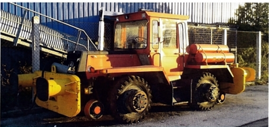
MB-trac в качестве дорожного и рельсового транспортного средства.