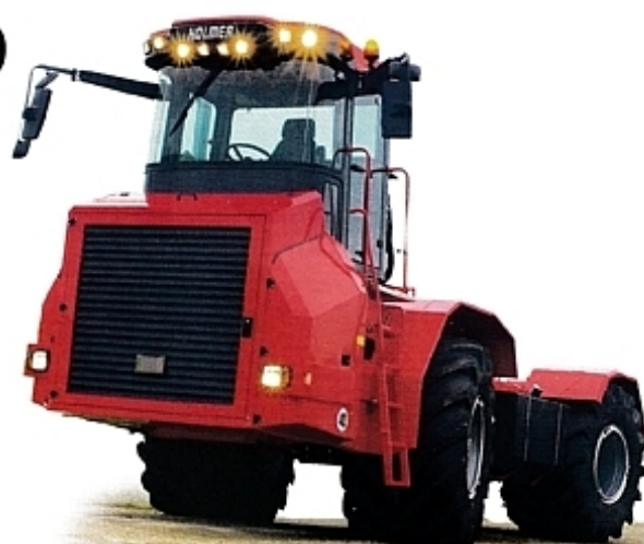
Трактор Terra Variant – одно из крупнейших серийных транспортных средств, выпускаемых в Европе.

Сегодня в сельском хозяйстве появляются тракторы удивительных форм и впечатляющих размеров, работу которых всё больше и больше координируют и обеспечивают процессоры. Разработанный и произведенный компанией Holmer («Хольмер») трактор Terra Variant («Терра Вариант») – пример современной сельскохозяйственной технологии.