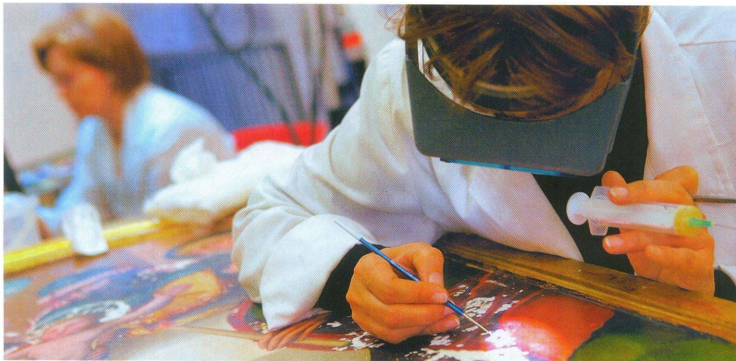
РЕСТАВРАТОРАМ НЕОБХОДИМО НЕ ТОЛЬКО ВИРТУОЗНОЕ ВЛАДЕНИЕ КИСТЬЮ, НО И ЗНАНИЯ В ОБЛАСТИ ХИМИИ И ДАЖЕ КРИМИНАЛИСТИКИ