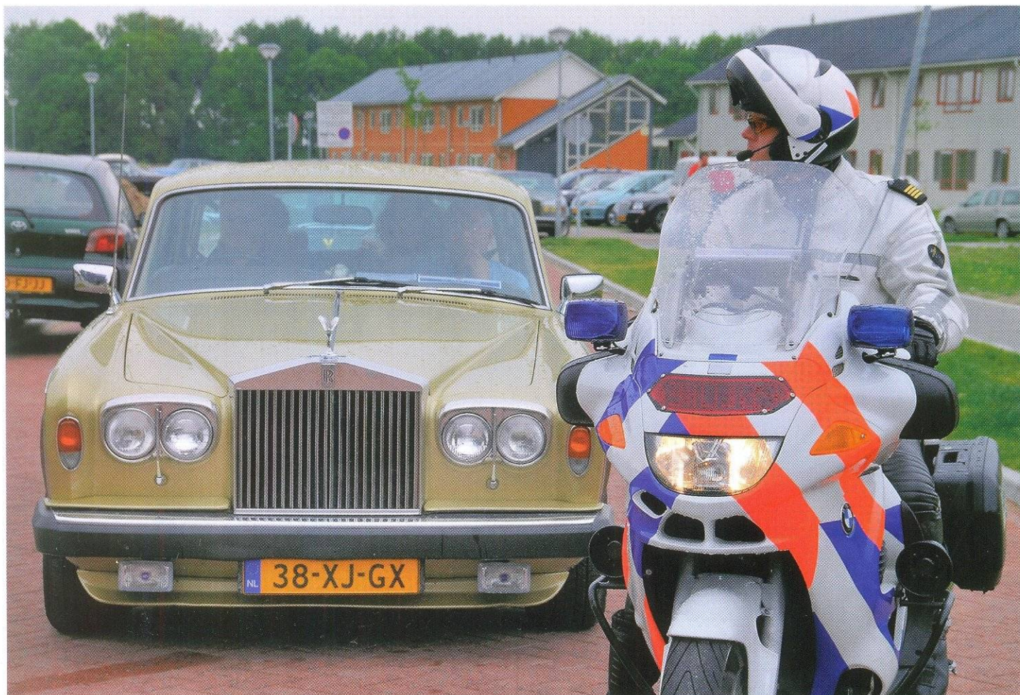
СОПРОВОЖДЕНИЕ VIP-ПЕРСОН — ЧАСТЬ РАБОТЫ ПОЛИЦЕЙСКИХ МОТОЦИКЛИСТОВ

ность за охрану королевской семьи, других важных персон, осуществляет закупки полицейского оружия, боеприпасов, формы, техники и другого оборудования. Важным подразделением агентства является национальное управление по сбору разведанных в сфере преступности. При нем действует и национальное бюро Интерпола.