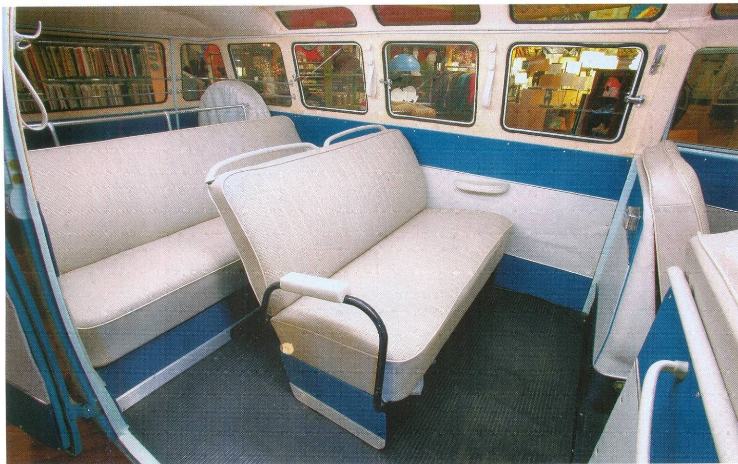
В ЭТОЙ ВЕРСИИ TRANSPORTER 1963 ГОДА БЫЛО 21 ОКНО

ску, установили двухконтурную тормозную систему. В целом модернизация оказалась удачной, модель продолжала пользоваться огромным спросом. Выпускали второе поколение Transporter на том же заводе в Ганновере. Примечательно, что из 2,5 миллионов автомобилей этой серии около 70 % пошли на экспорт.