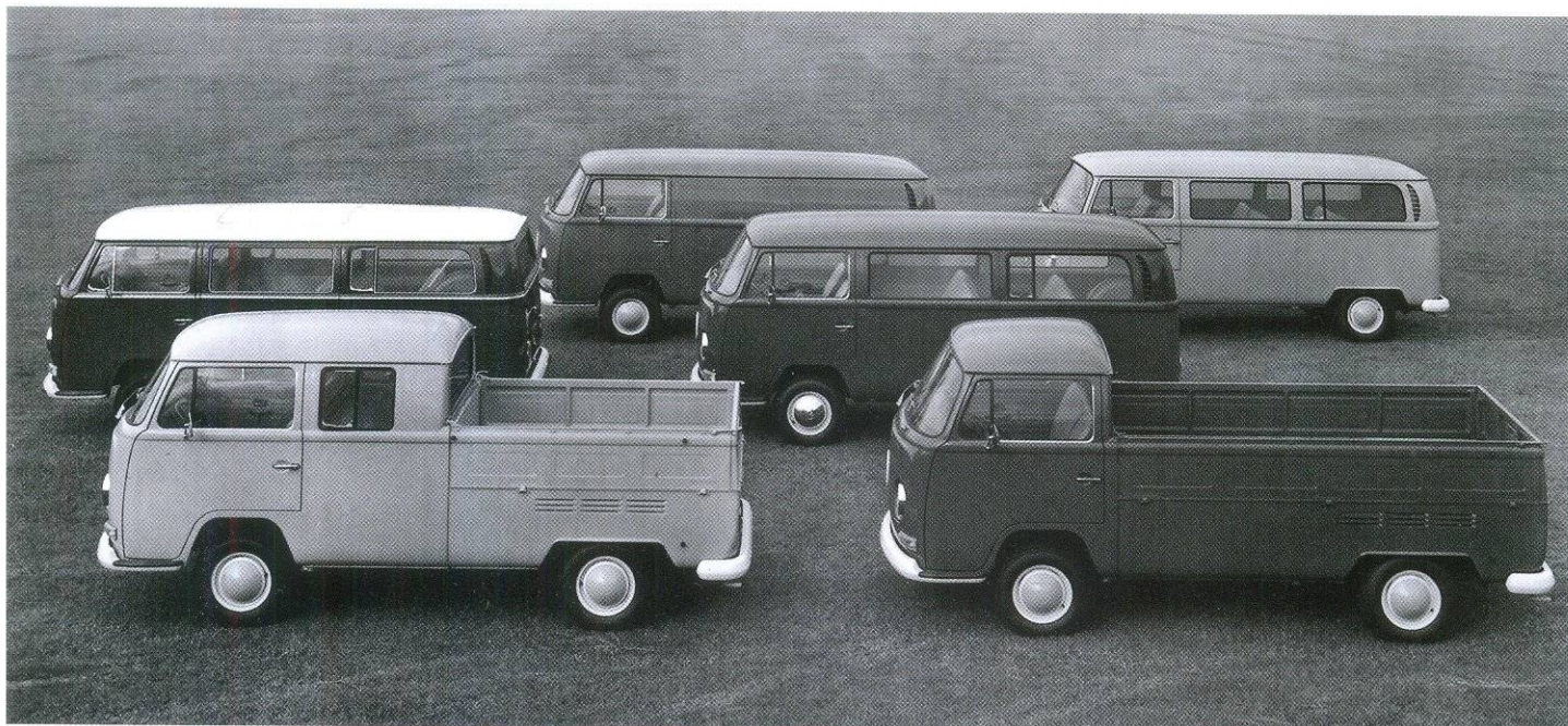
В 70-Е ГОДЫ VOLKSWAGEN T2 ВЫПУСКАЛСЯ С ШЕСТЬЮ ВАРИАНТАМИ КУЗОВА

Деловое чутье не обмануло представителей Volkswagen — машина действительно «пришлась ко двору». Спросом пользовались разные версии: развозной фургон, микроавтобус, грузовая платформа с обычной и двойной кабиной, пикап, кемпер и т.д. Помимо частных заказчиков, Transporter с удовольствием приобретали муниципалитеты, почта, медицинские ведомства, банки, общественные организации, государственные учреждения и даже силовые структуры. Неприхотливый трудяга быстро завоевал популярность в Европе, а затем шагнул и за ее пределы — в США и Бразилию. В 1954 и 1963 годах у Transporter появились новые моторы объемом 1192 и 1493 см 3 , что позволило увеличить максимальную скорость до 110 км/ч. В 1962 году компания отметила своеобразный юбилей: из ворот предприятия вышел миллионный Transporter. Первое поколение автомобилей продержалось на конвейере до 1967 года. Впрочем, на бразильском заводе Volkswagen в городе Сан-Бернарду-ду-Кампу производство этой модели продолжалось еще в течение многих лет.