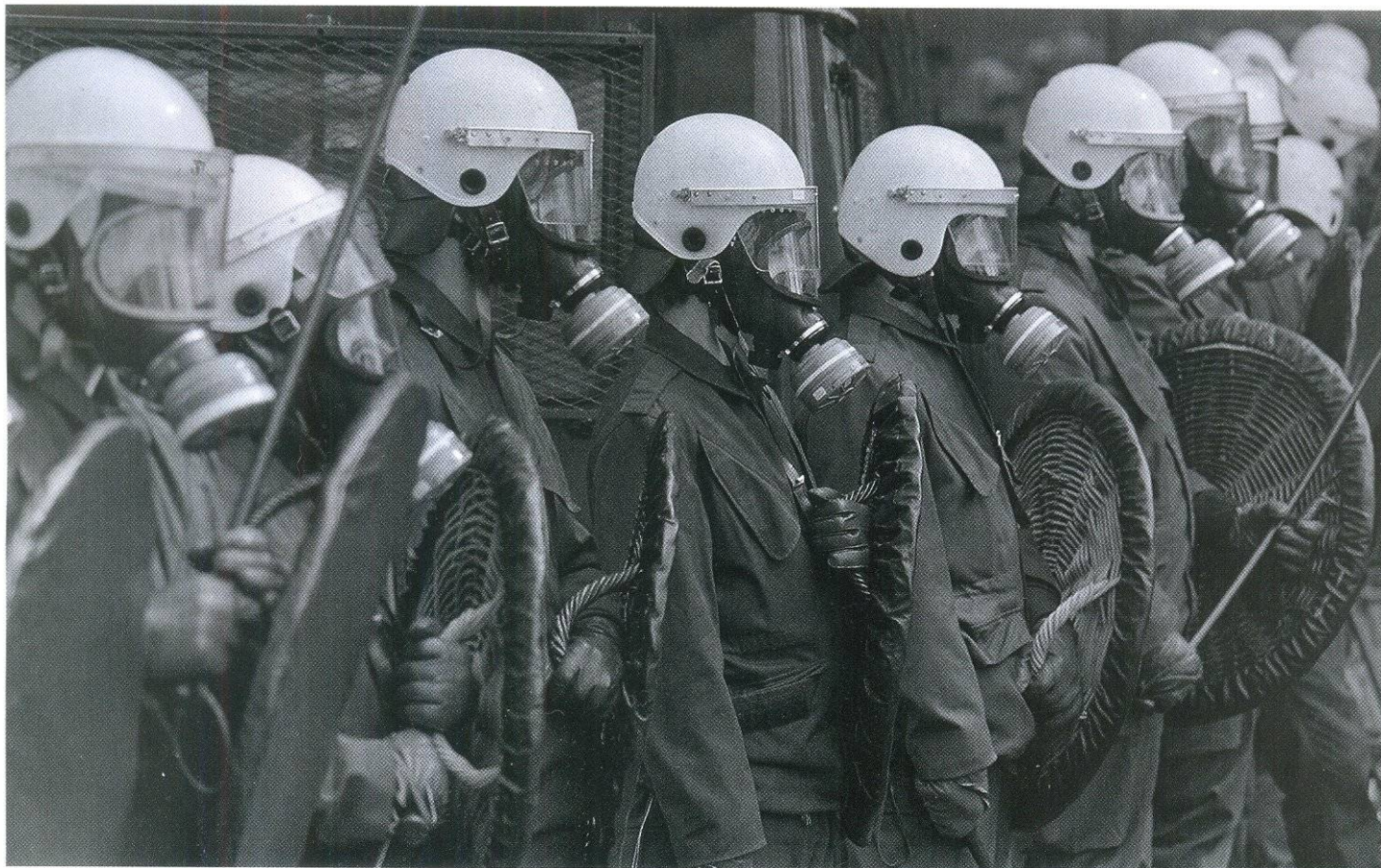
ГОЛЛАНДСКИЕ ПОЛИЦЕЙСКИЕ ГОТОВЫ ПРЕСЕЧЬ АКЦИИ АНАРХИСТОВ В ДЕНЬ ПРОВОЗГЛАШЕНИЯ ПРИНЦЕССЫ БЕАТРИКС КОРОЛЕВОЙ НИДЕРЛАНДОВ (30 АПРЕЛЯ 1980 ГОДА)

Голландская национальная полиция (Politie) находится в подчинении Министерства внутренних дел. В ее состав входит Национальное агентство полицейской службы и 25 региональных служб. Правопорядок в стране обеспечивает и Королевская жандармерия Нидерландов (Marechaussee), но эта структура, в отличие от полиции, считается военной организацией.