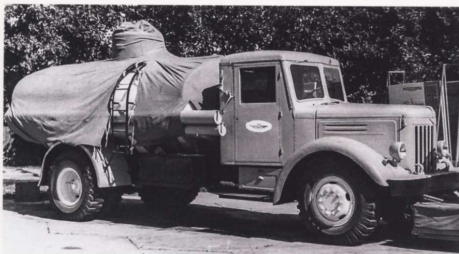
Топливная автоцистерна АЦ-8-200 на службе у авиаторов

ность цистерны (в целях предохранения ее от коррозии) металлизировалась цинком. В нижней части цистерна имела четыре приваренные опоры из четырехмиллиметровой листовой стали, отстойник и фланец для крепления сливного трубопровода. Сливной трубопровод предназначался для