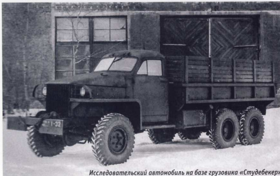
Исследовательский автомобиль на базе грузовика «Студебекер»

кого бронированного тягача «Пионер-Б». С 1936 года руководил проектированием полугусеничного бронеавтомобиля БА-30, построенного в 1937 году, созданием первого в СССР полноприводного (6×6) грузового автомобиля ЗИС-НАТИ-К1 на базе ЗИС-6, а в 1939 году — аналогичного полноприводного (4×4) грузового автомобиля ЗИС-НАТИ-К2 на базе ЗИС-5. Эта машина послужила основой для создания серийного грузовика ЗИС-32, выпущенного