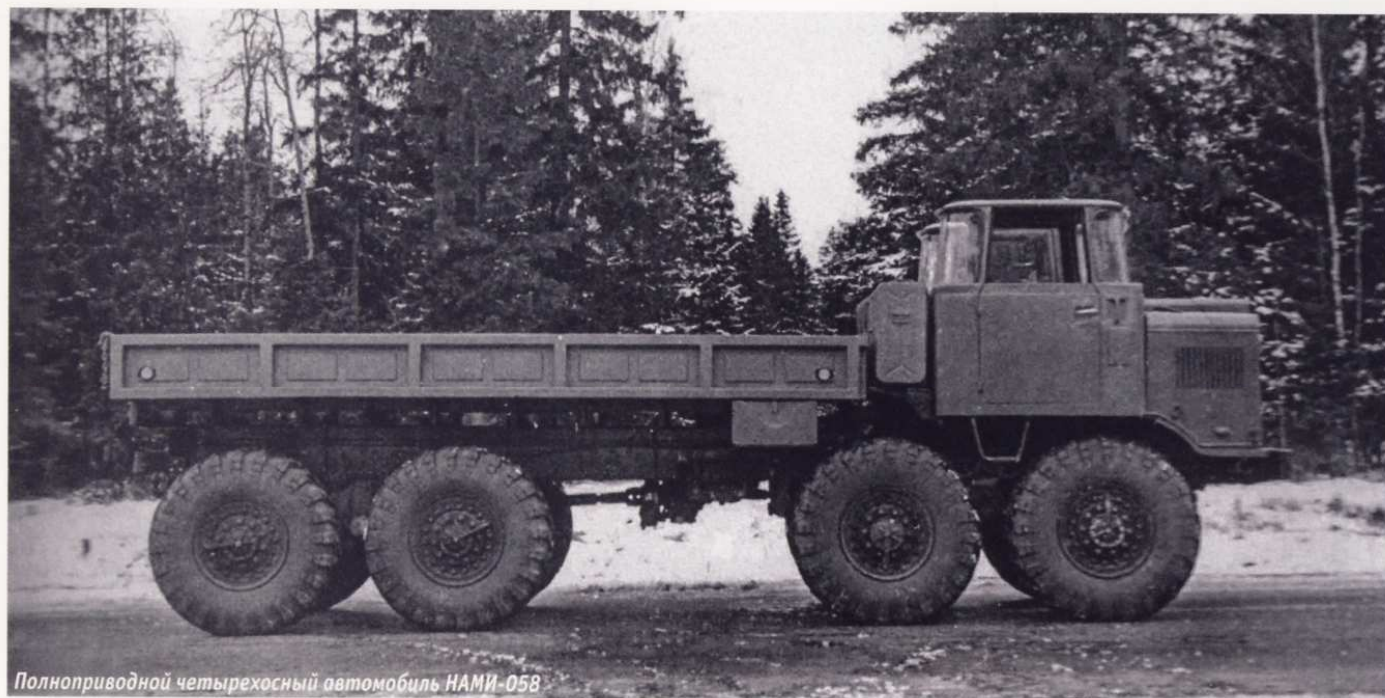
Полноприводной четырехосный автомобиль НАМИ-058