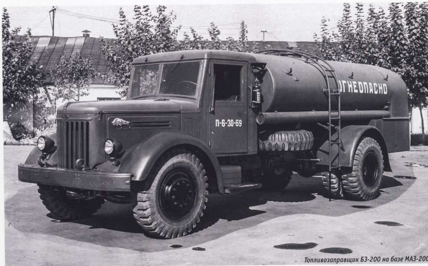
Топливозаправщик БЗ-200 на базе МАЗ-200