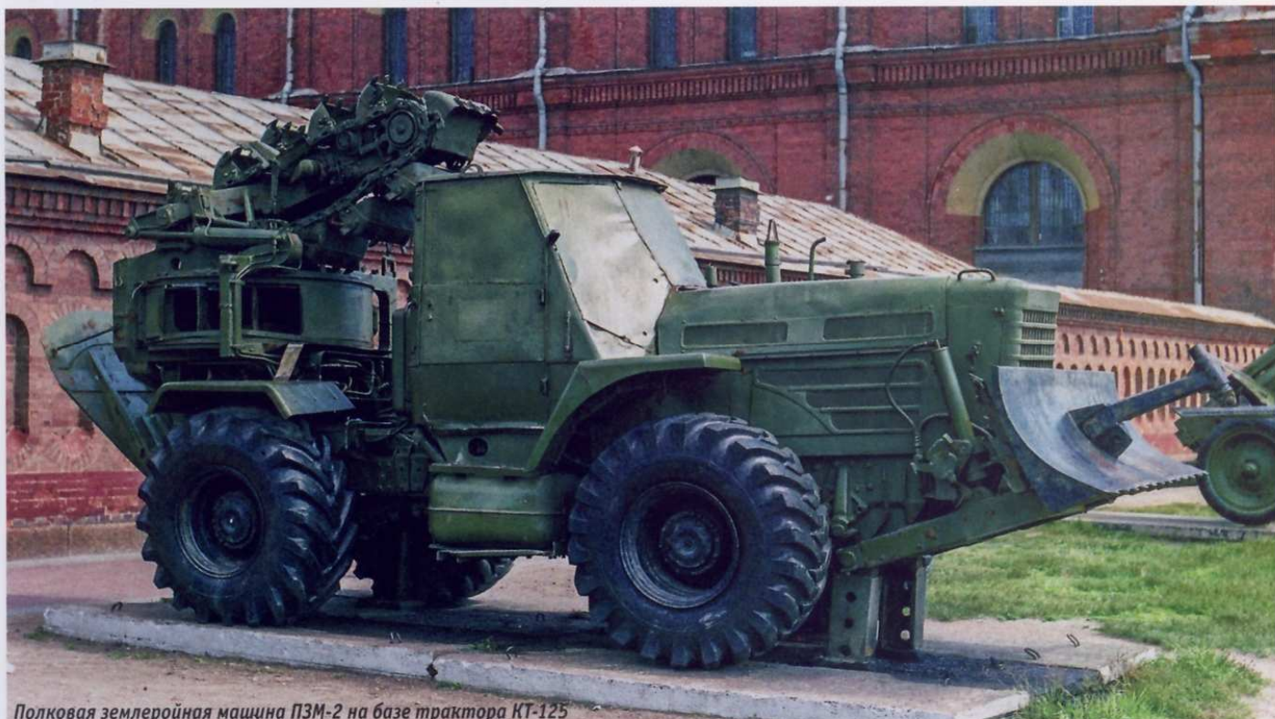
Полковая землеройная машина ПЗМ-2 на базе трактора КТ-125

выпускает бурильно-крановые машины БМ-205Д, БМ-308, БКМ-317, БКМ-513, БКМ-515, БКМ-1514, бурильные машины БМ-333, бурильно-свабойные машины