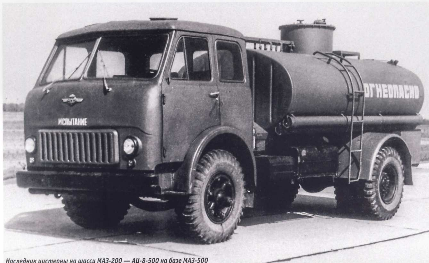
Наследник цистерны на шасси МАЗ-200 — АЦ-8-500 на базе МАЗ-500

Автоцистерна АЦ-8-200 имела емкость эллиптической формы, заполнявшуюся топливом через верхнюю заливную горловину перекачивающими средствами. Для этого необходимо было конец рукава бензопровода центральной отпускнуной магистрали