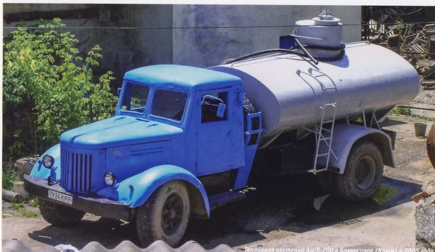
Топливная цистерна АЦ-8-200 в Бахчисарае (Крым) в 2005 году

и производство топливозаправщиков БЗ-200 было начато несколько раньше, чем автоцистерн АЦ-8-200. Поскольку Куйбышевский завод №207 в 1952 году был переориентирован на выпуск другой продукции, производство автоцистерн АЦ-8-200 началось лишь в 1954 году на киевском заводе «Стройдормаш». К этому времени уже произошла смена базового шасси, так как еще в 1951 году Ярославский автомобильный завод полностью передал производство двухосных дизельных грузовиков на Минский автомобильный завод, в результате чего появилось аналогичное шасси МАЗ-200. Отличительная особенность новых шасси — решетка радиатора с вертикальными, а не горизонтальными прорезями, как было на машинах ярославского производства. На обозначении самой цистерны эта рокировка никак не отразилась, так как цифровой индекс шасси не изменился и она по-прежнему называлась АЦ-8-200. С 1955 года эта автоцистерна использовалась не только в народном хозяйстве, но и в армии.