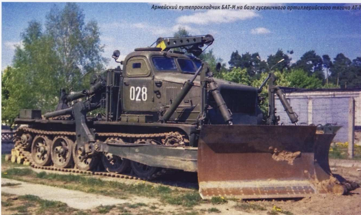
Армейский путепрокладчик БАТ-М на базе гусеничного артиллерийского тягача АТ-Т

Завод «Стройдормаш» был основан еще до Великой Отечественной войны, в 1932 году, по решению Киевского окружного военно-строительного управления.