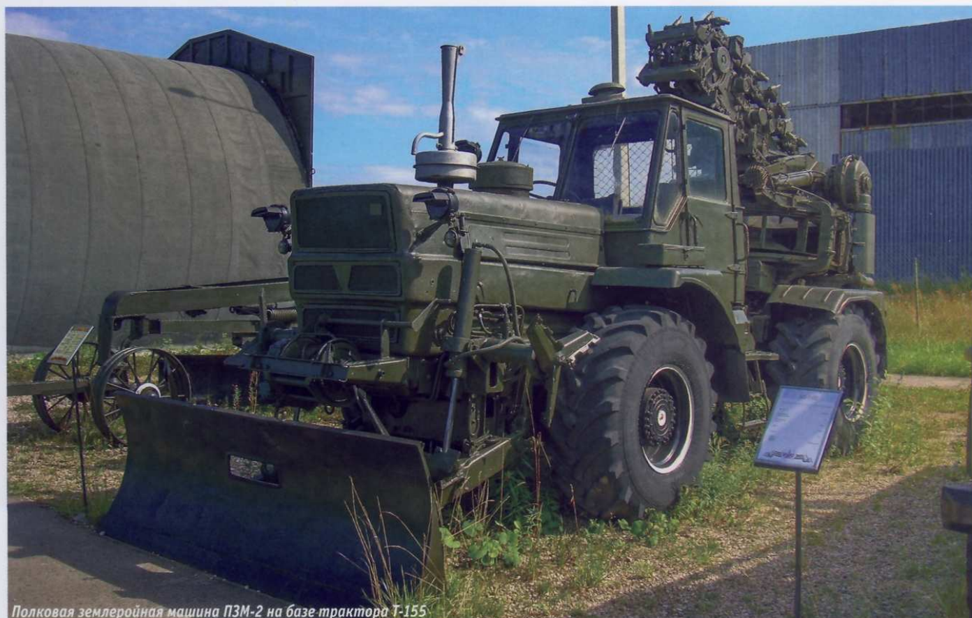
Полковая землеройная машина ПЗМ-2 на базе трактора Т-155

утрачены, большинство цехов пустует или находится в аварийном состоянии, часть заводской территории сдается в аренду.