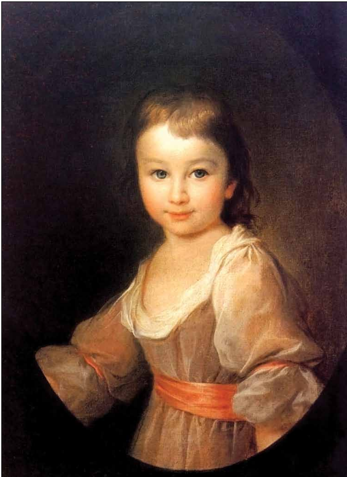
Портрет графини П. А. Воронцовой в детстве. Около 1790