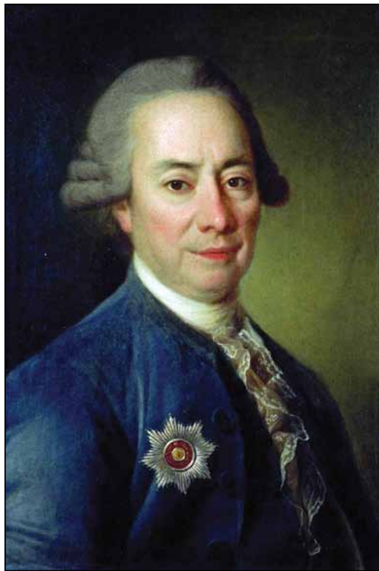
Портрет П. В. Бакунина Большого. 1782