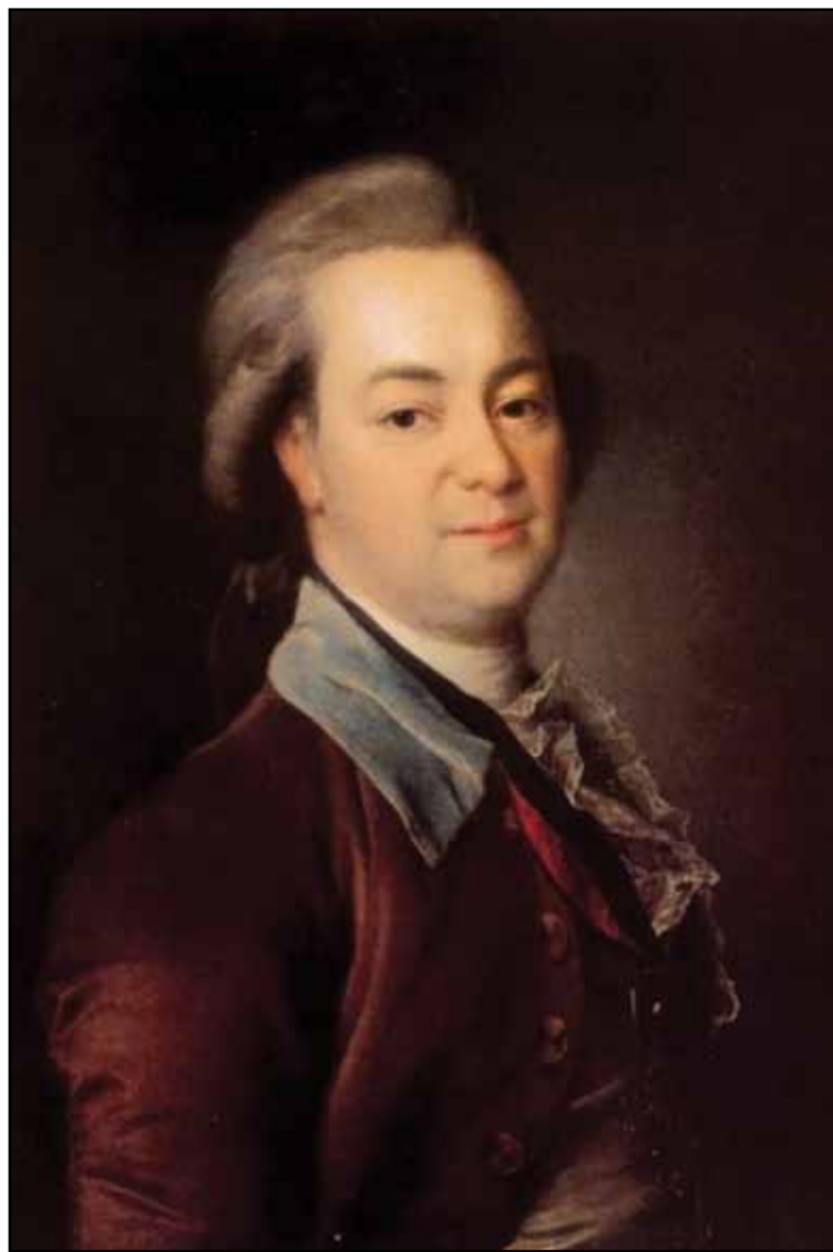
Портрет А. В. Храповицкого. 1782