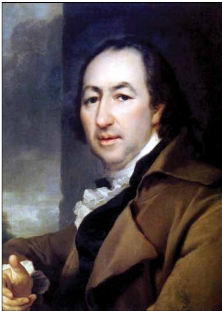
Портрет Н. И. Новикова. 1797