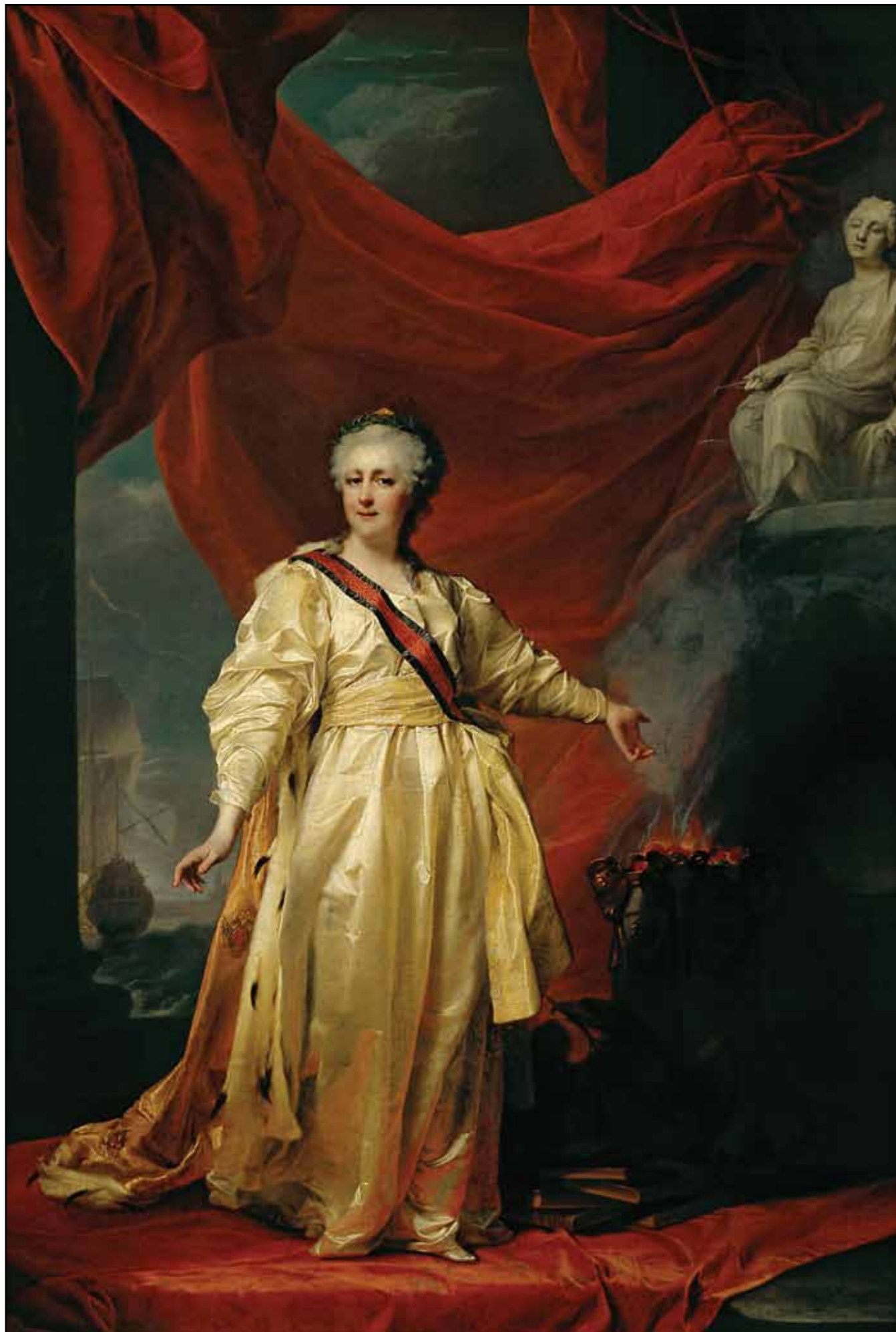
Портрет императрицы Екатерины II в виде законодательницы в храме богини Правосудия. Начало 1780-х