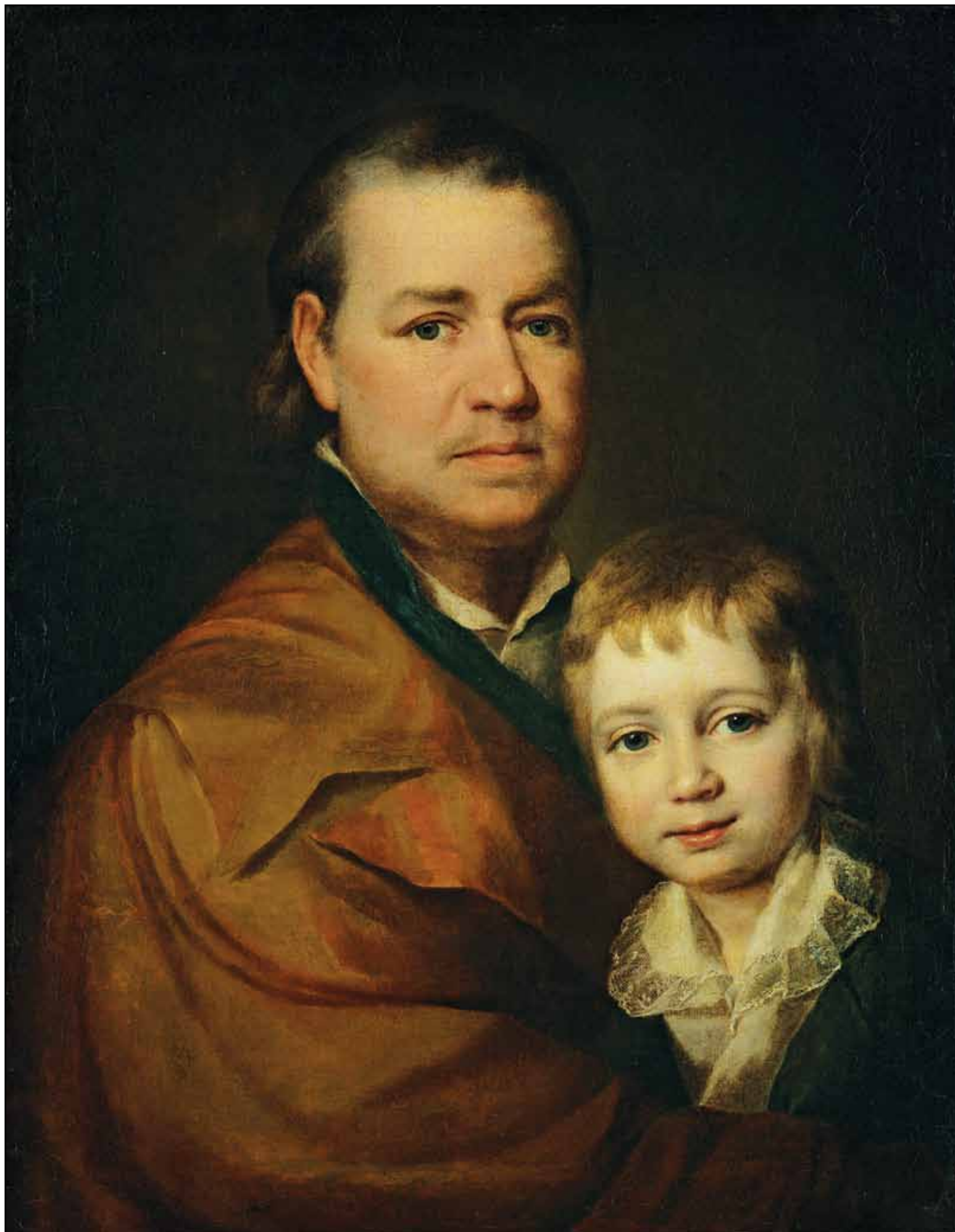
Портрет неизвестного пожилого человека с мальчиком. Не датировано