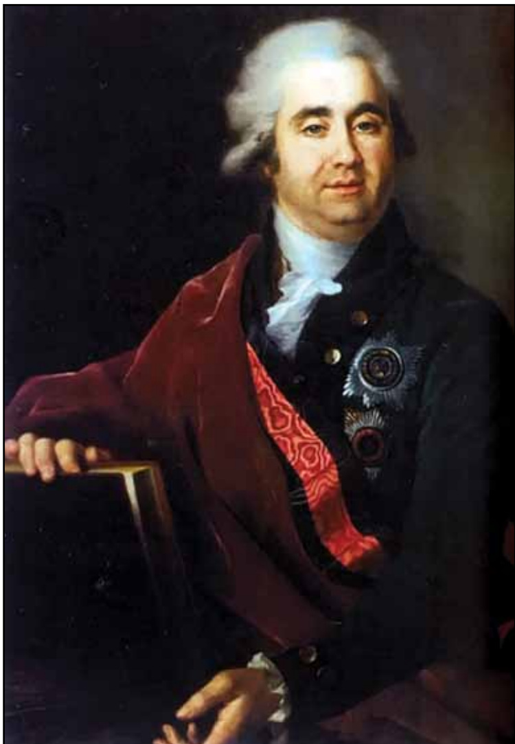
Портрет А. А. Безбородко. 1790-е