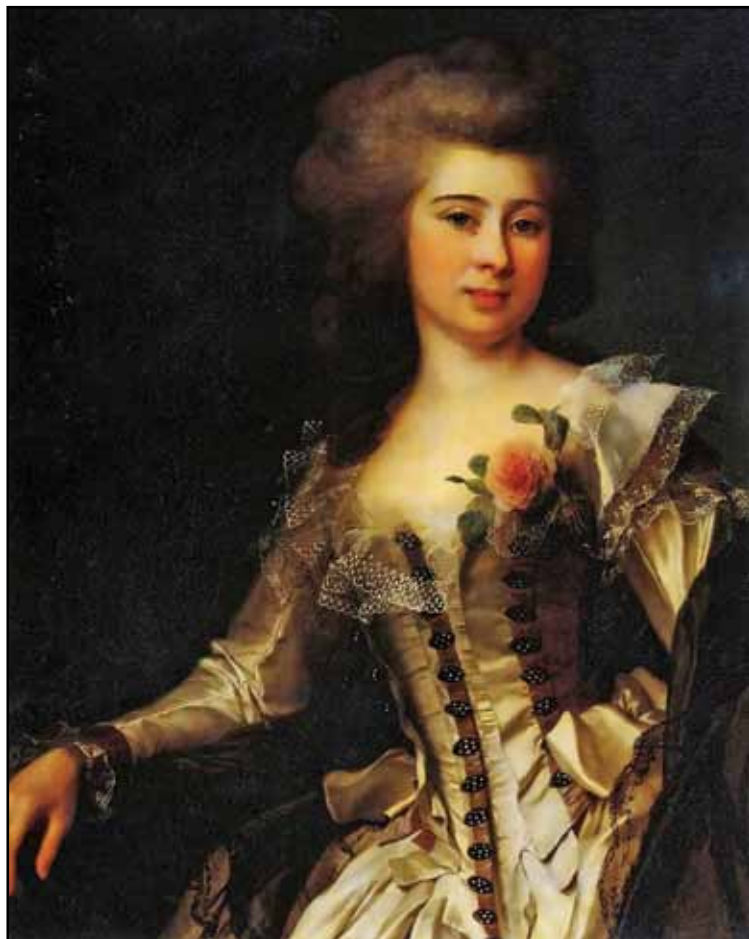
Портрет неизвестной с розой. 1788

Для успешного осуществления своего замысла Потемкин еще ранее потребовал от Бецкого предоставить ему для работы многих живописцев. И хотя президент Академии художеств все это держал в строжайшей тай-