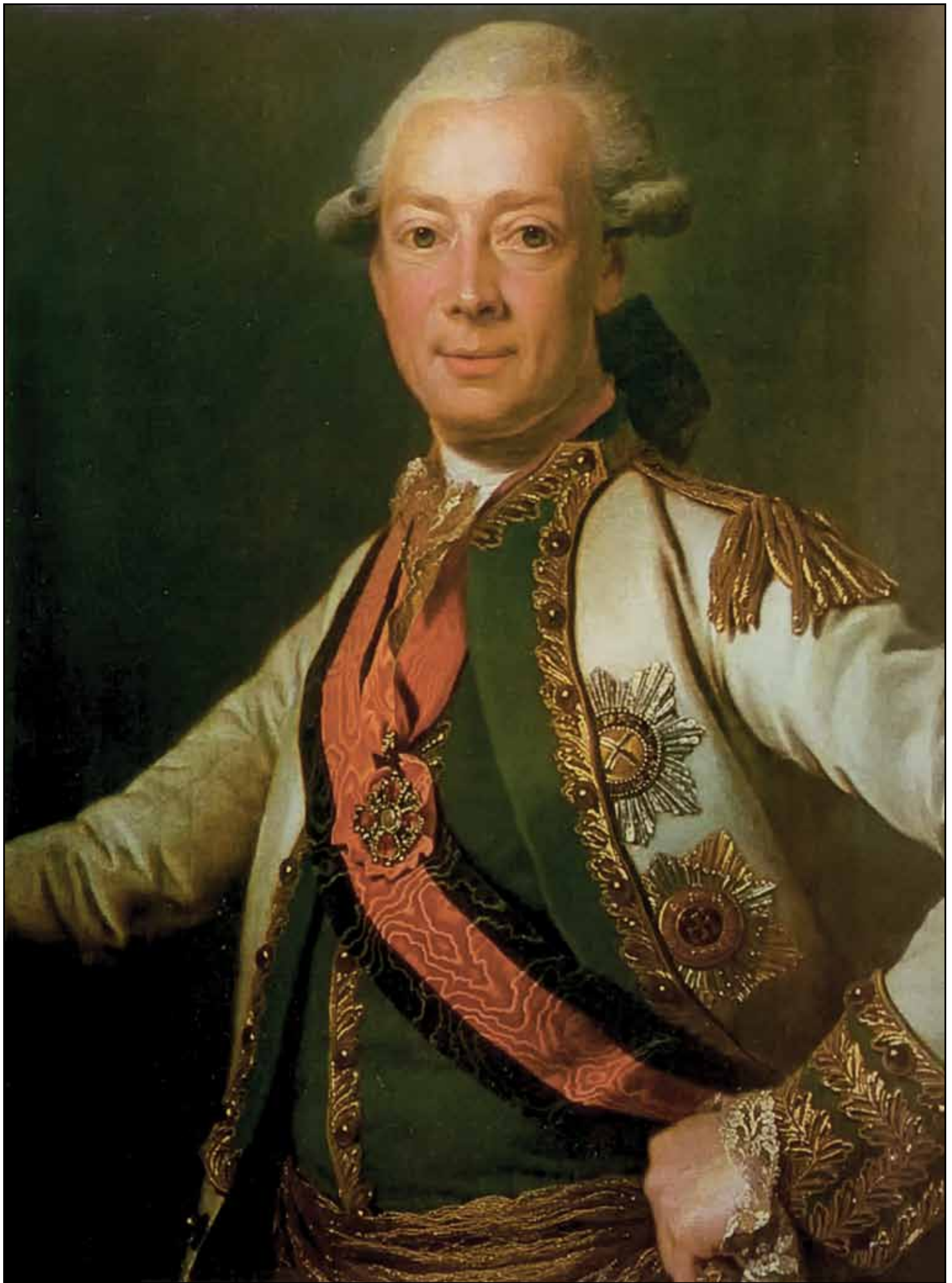
Портрет графа И. Г. Чернышева. 1790–1800-е