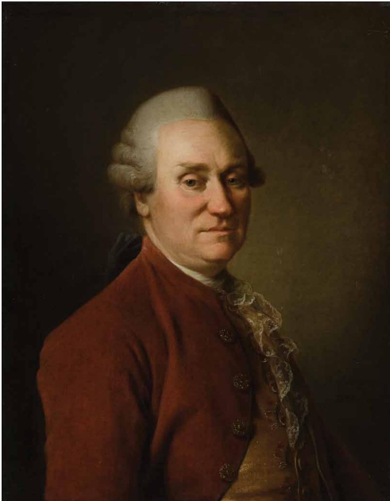
Портрет М. Ф. Полторацкого. 1780