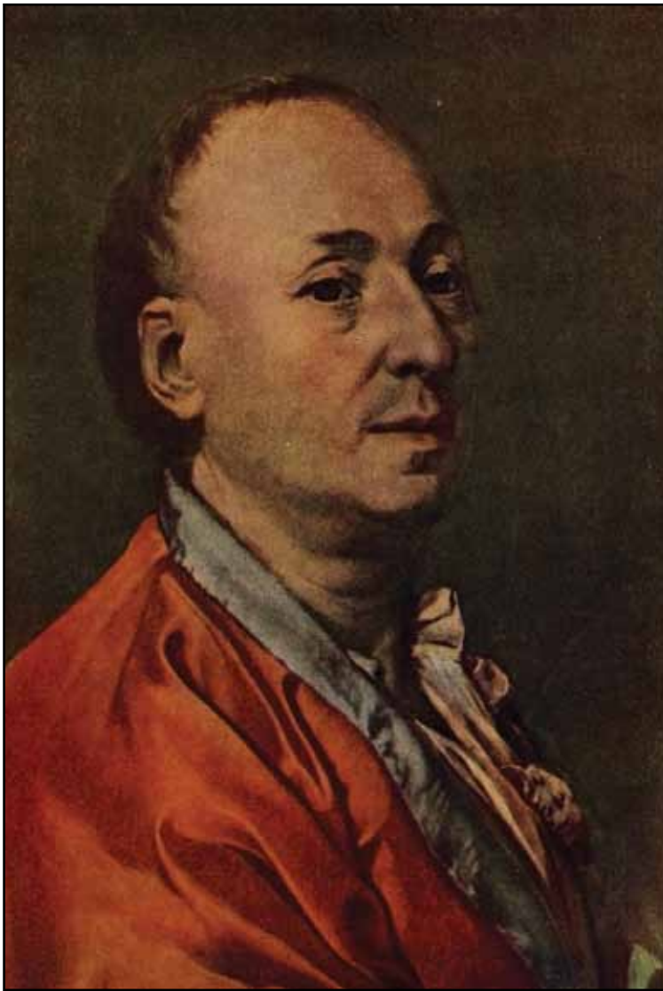
Портрет Д. Дидро. 1773–1774

Пример тому – «Портрет П. А. Демидова» (1773, Государственная Третьяковская галерея, Москва). На нем в изящной позе изображен представитель знаменитого рода тульских оружейников и владельцев горно-промышленных предприятий. Согласно положениям о создании парадного портрета (а перед нами именно он) этот богатый фабрикант и меценат должен был предстать со знаками отличия действительного статского советника и, возможно, на фоне оружия или добываемых его рабочими полезных ископаемых. Однако Прокофий Акинфиевич слыл человеком эксцентричным, дерзким, своевольным (хотя и образованным и с пытливым умом), поэтому портрет вышел совсем иным. (Попутно отметим, что Демидов был известен не только своими причудами – например, в его доме свободно разгуливали стаи обезьян, – но еще и искренней любовью к растениям и разведению экзотических садов. В его живой ботанической коллекции произрастали самые удивительные и редкостные экземпляры.)