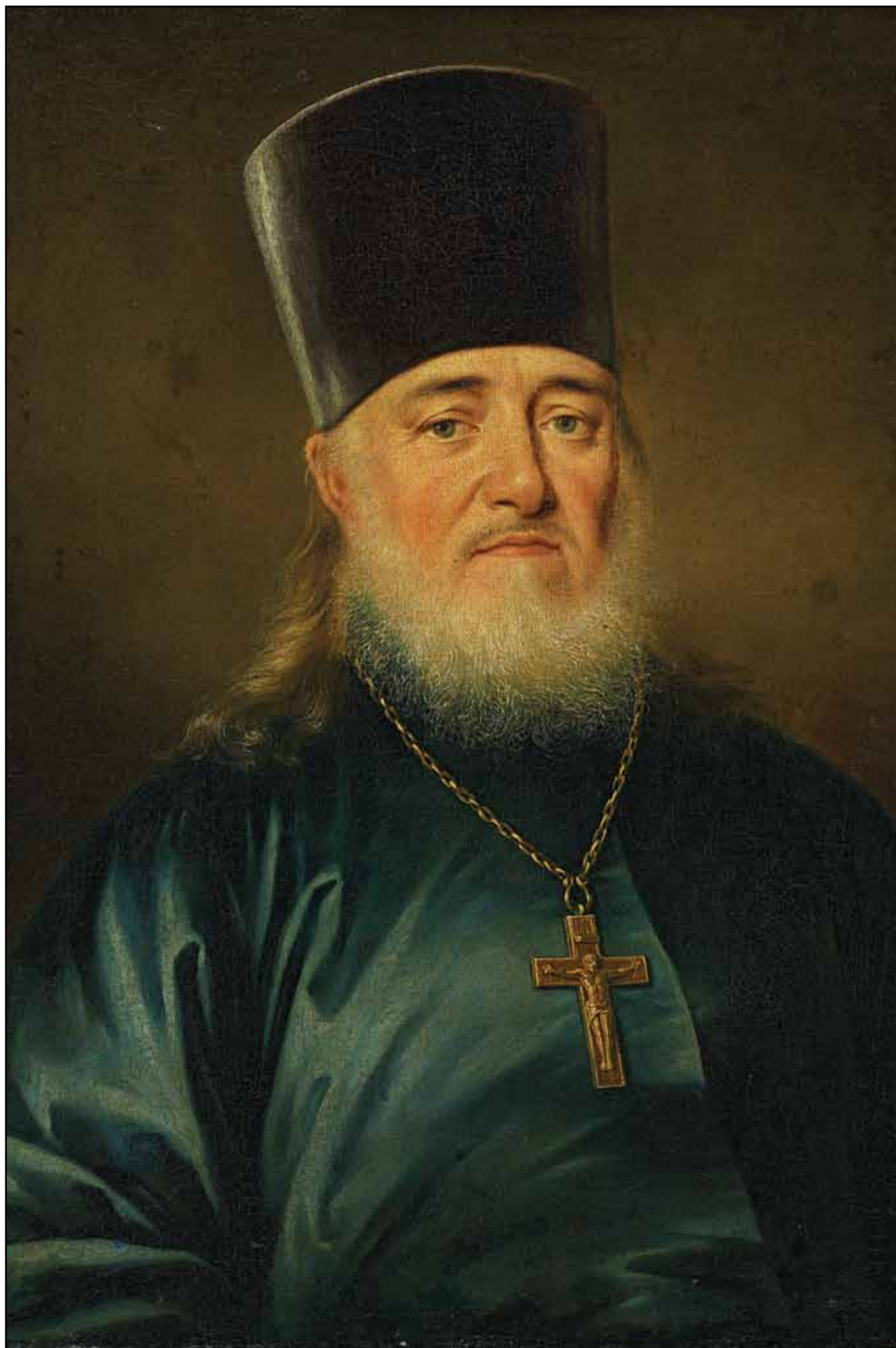
Портрет священника Петра Левицкого. 1812