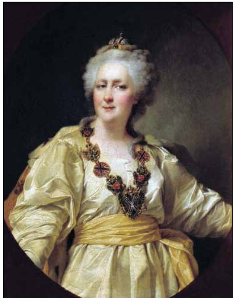
Портрет императрицы Екатерины II. 1794

К сожалению, в дальнейшем свадьба Александры Павловны с обрученным с ней с детских лет шведским королем Густавом IV Адольфом из-за дипломатических ошибок русских сватов так и не состоялась,