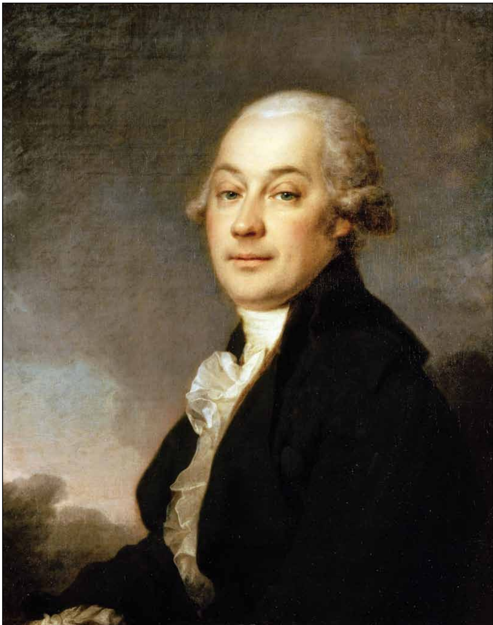
Портрет П. Г. Гауфа, 1790-е