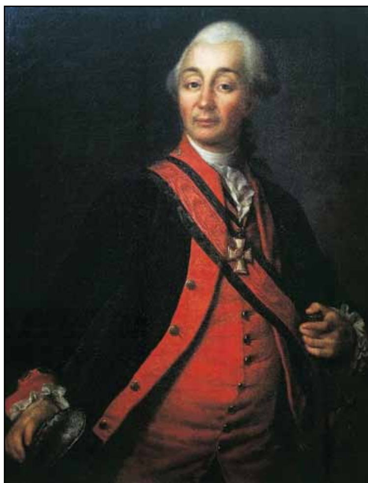
Портрет А. В. Суворова. 1786