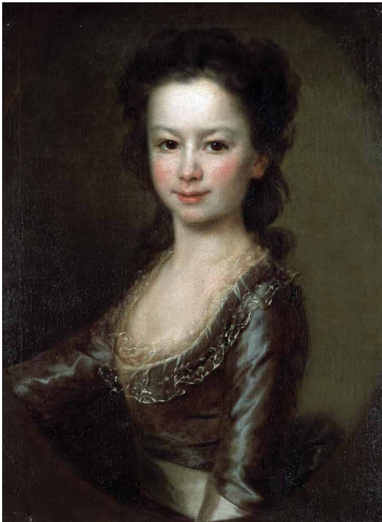
Портрет графини М. А. Воронцовой. Около 1790