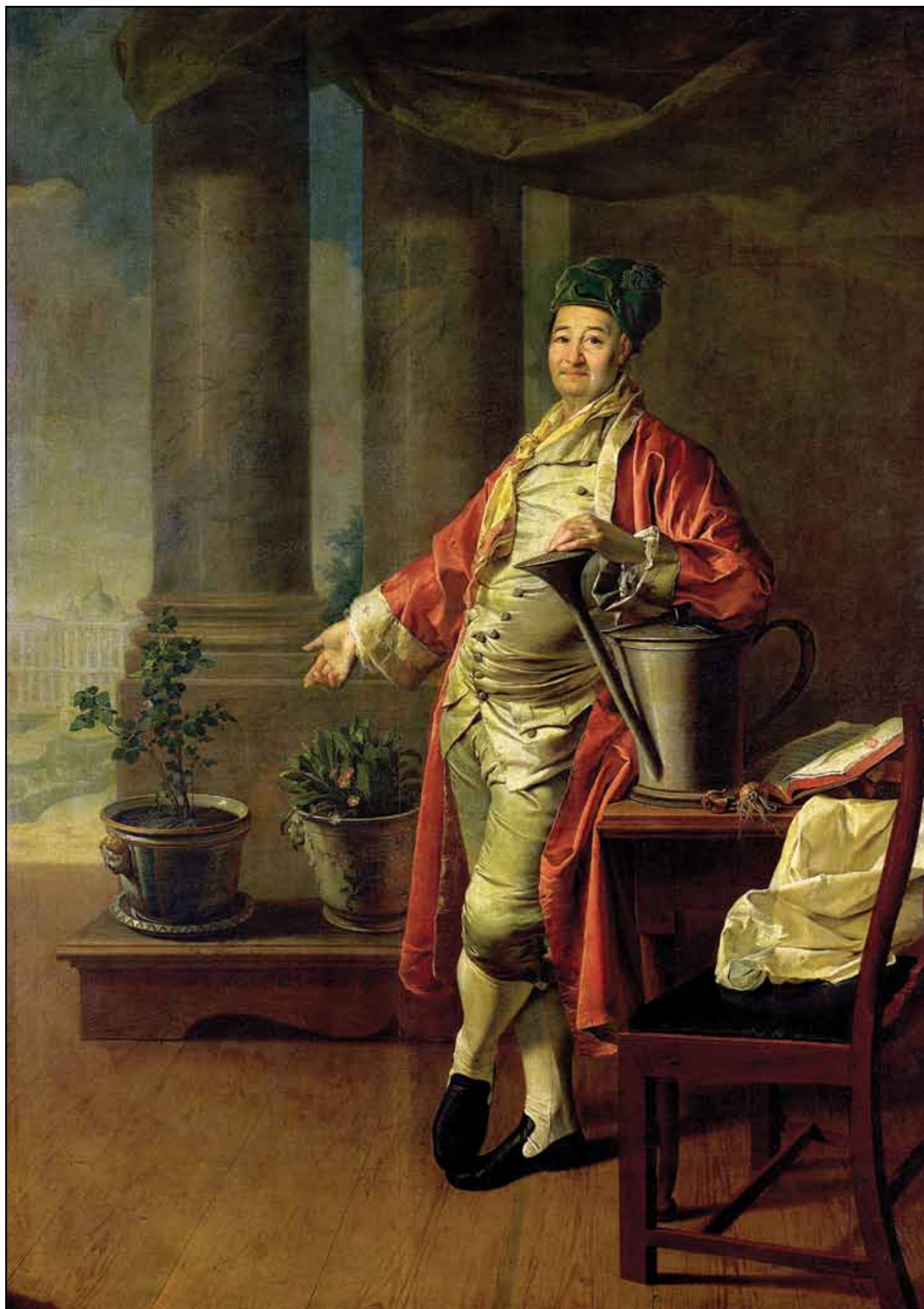
Портрет П. А. Демидова. 1773