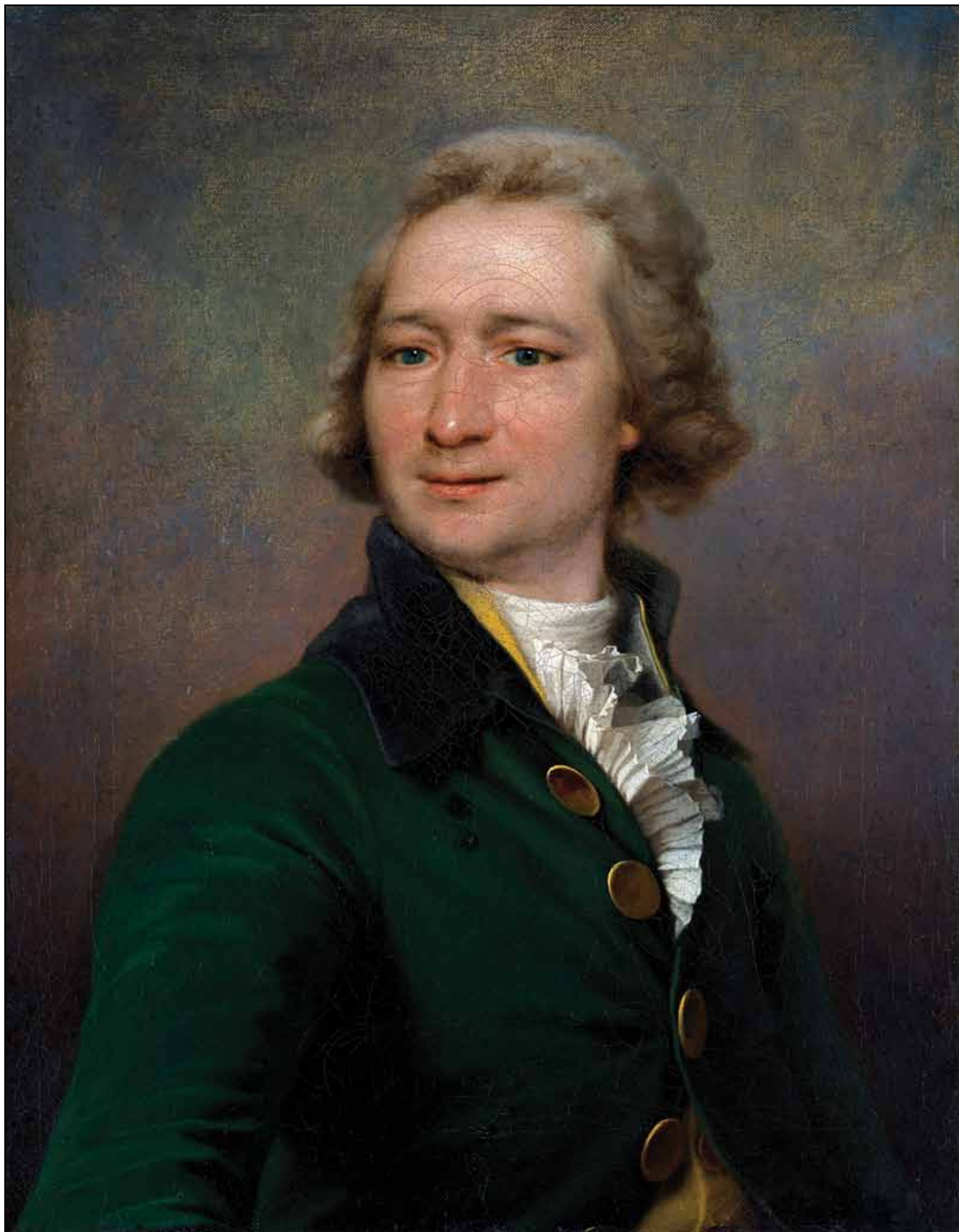
Портрет П. П. Дмитриева. 1790-е