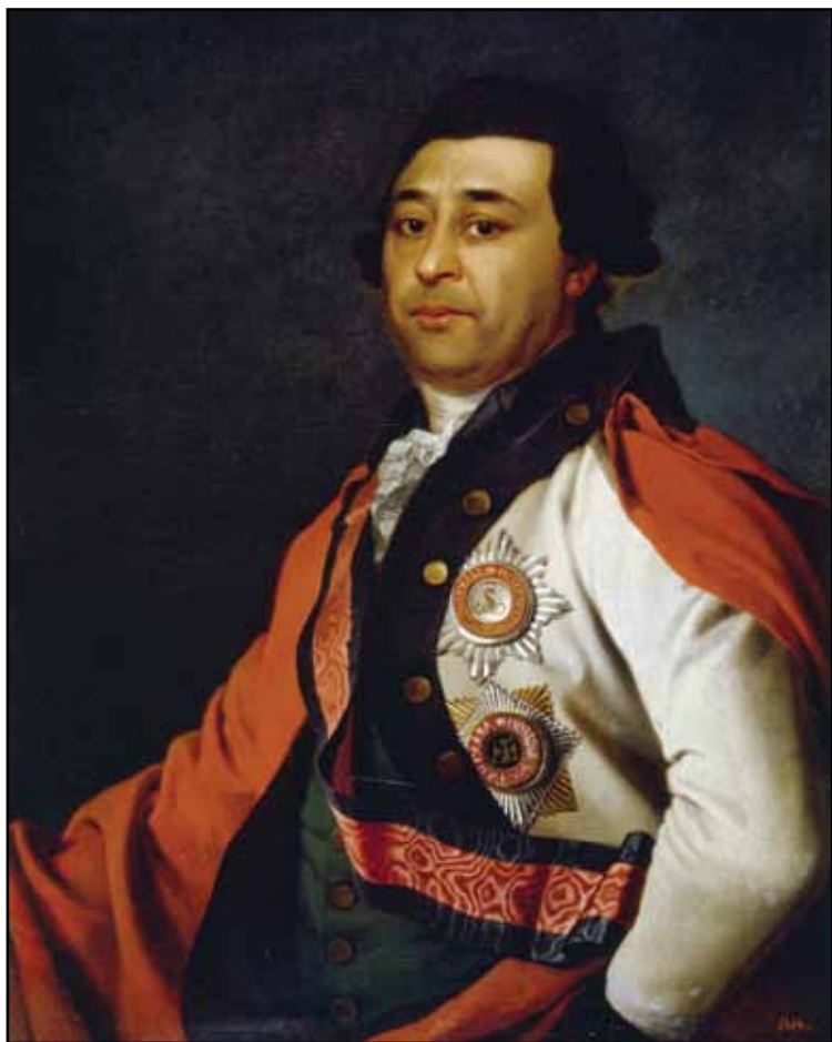
Портрет И. А. Ганнибала. 1780-е