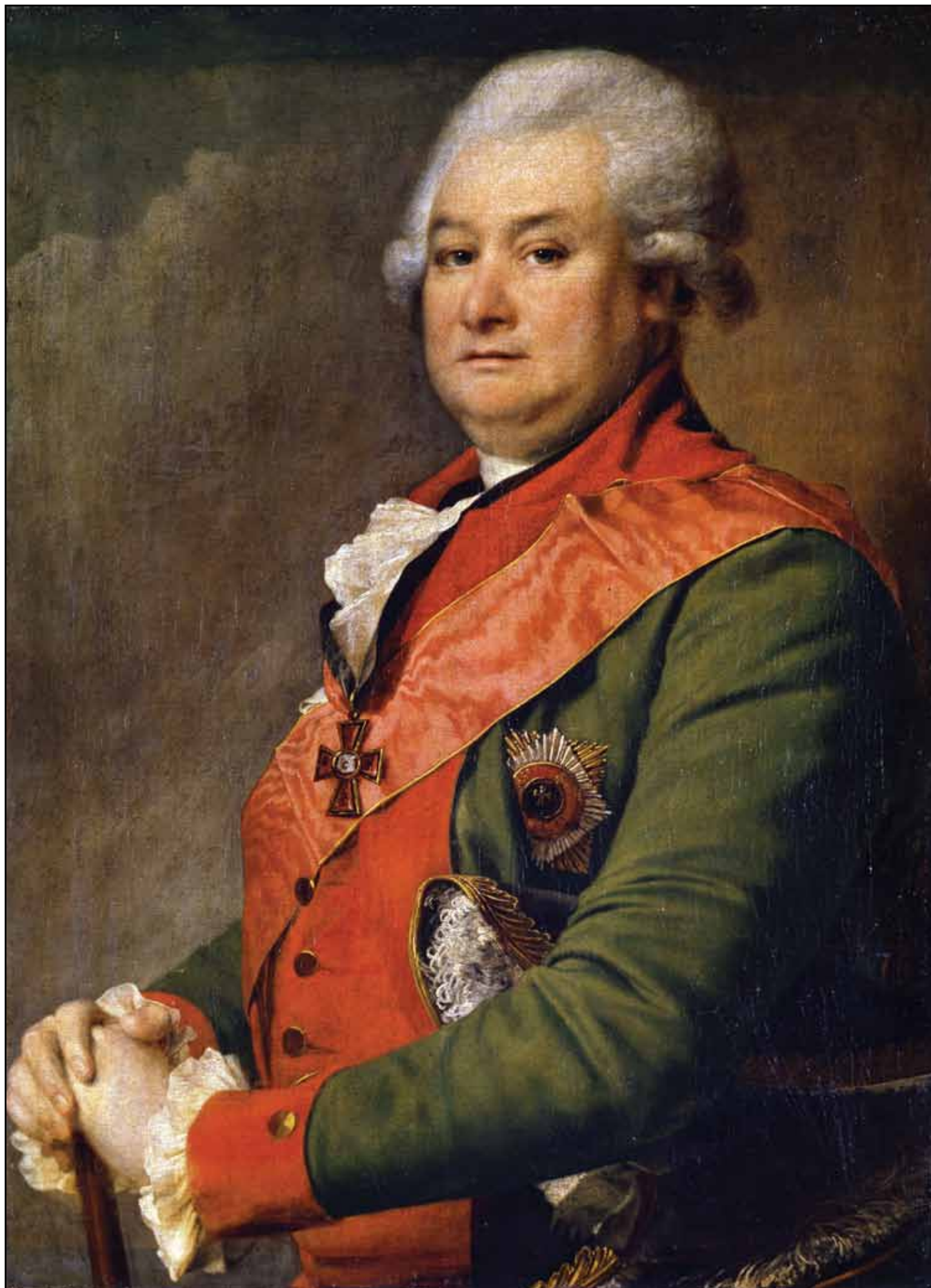
Портрет графа П. П. Коновницына. Конец 1790-х