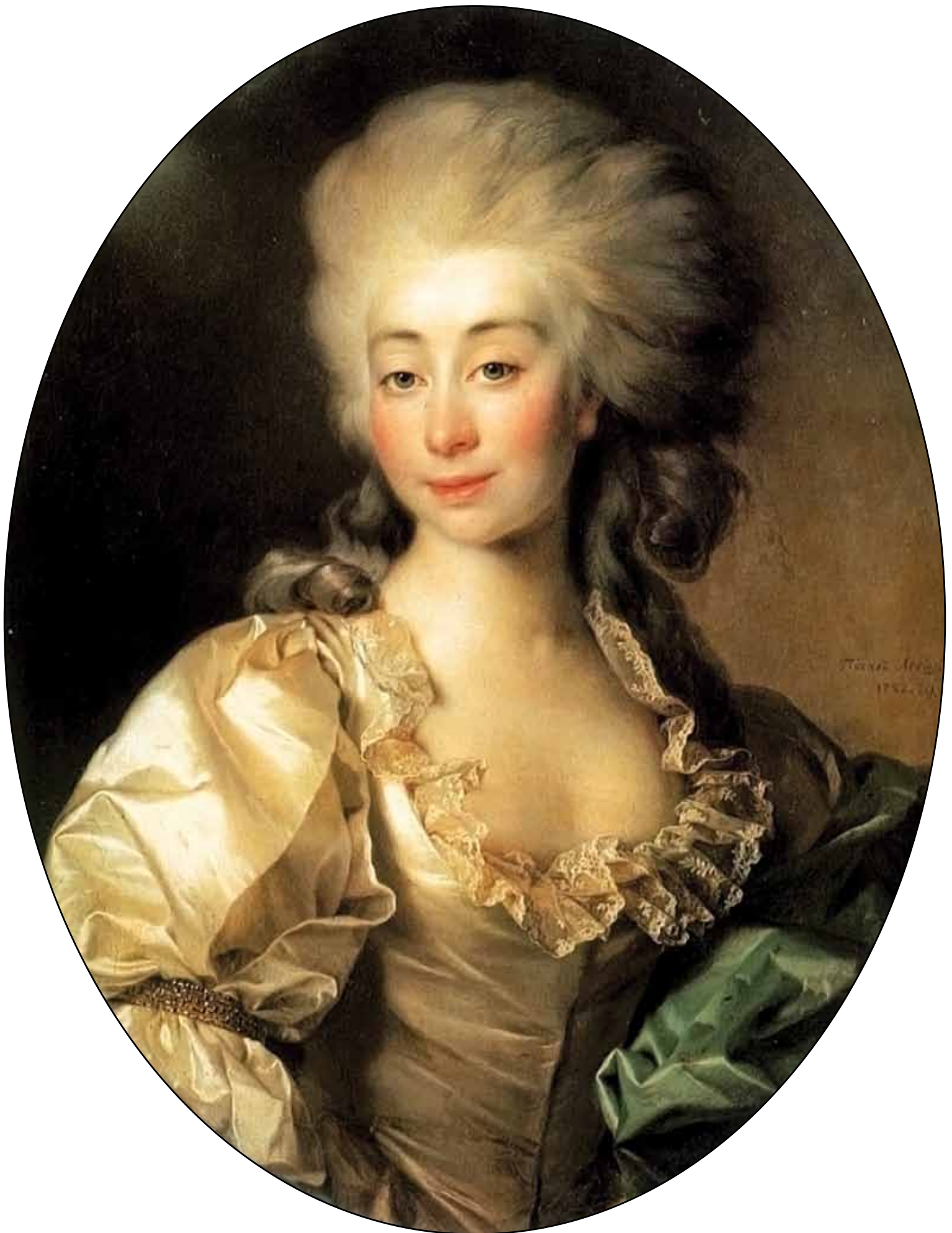
Портрет графини Урсулы Мнишек. 1782