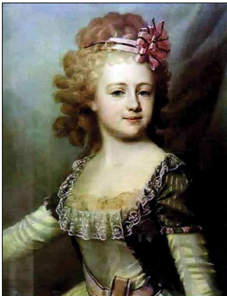
Портрет великой княжны Александры Павловны в детстве. 1790-е

После заключения мира с Турцией необходимо было возобновлять отношения с европейскими странами, особенно с Пруссией и Швецией. Екатерина II намеревалась решить этот вопрос привычным для