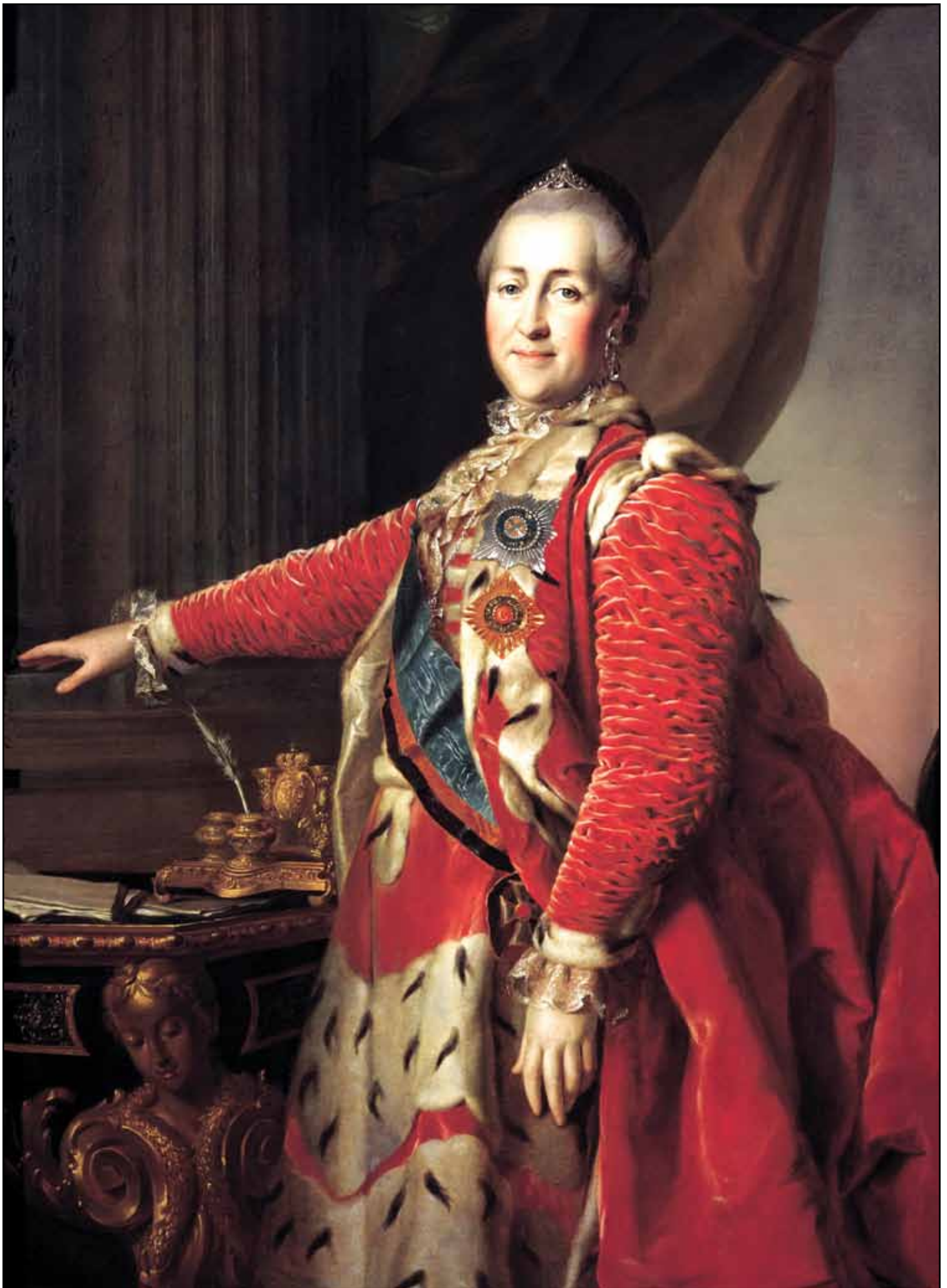
Портрет Екатерины II. Около 1782