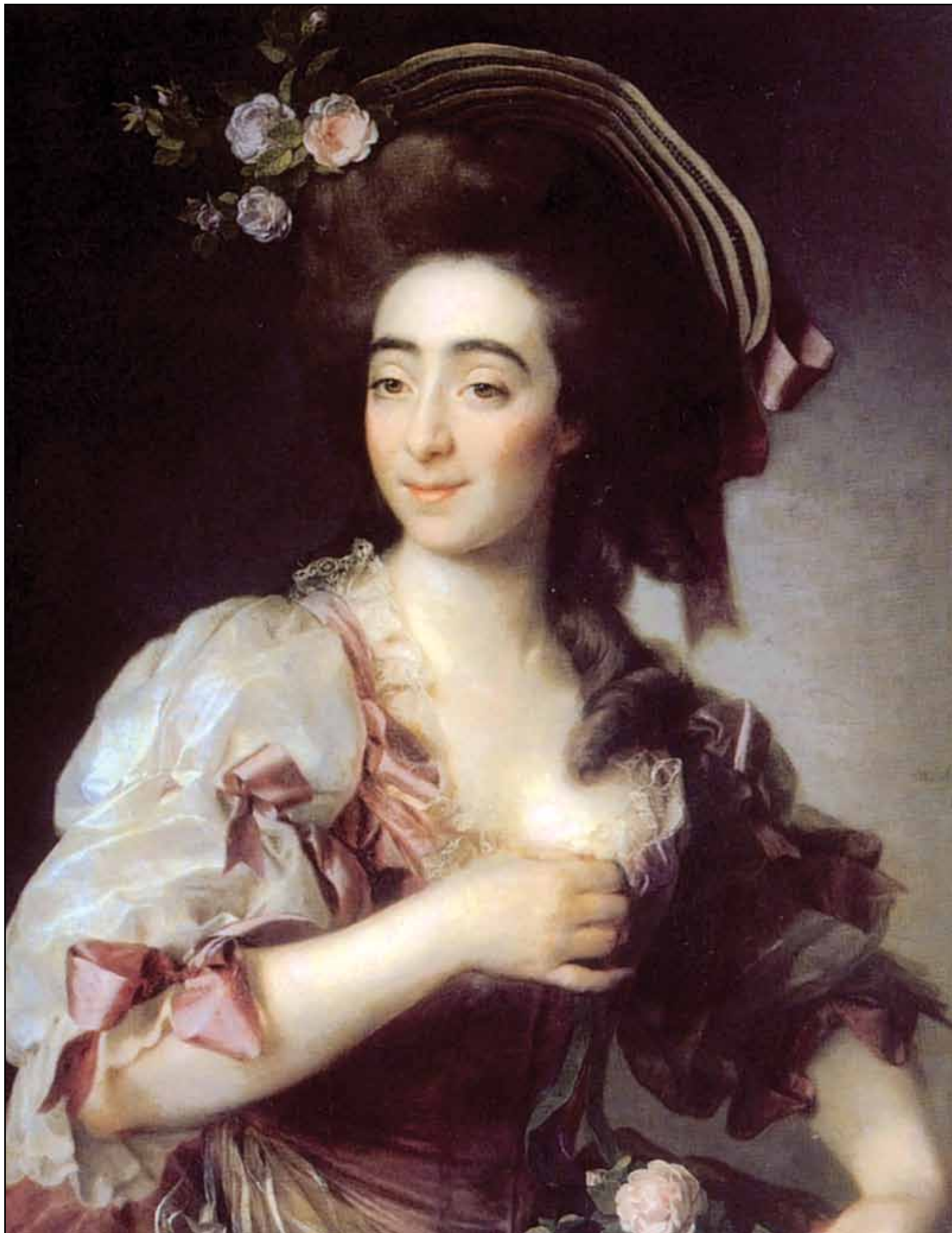
Портрет А. Давиа-Бернуцци. 1782