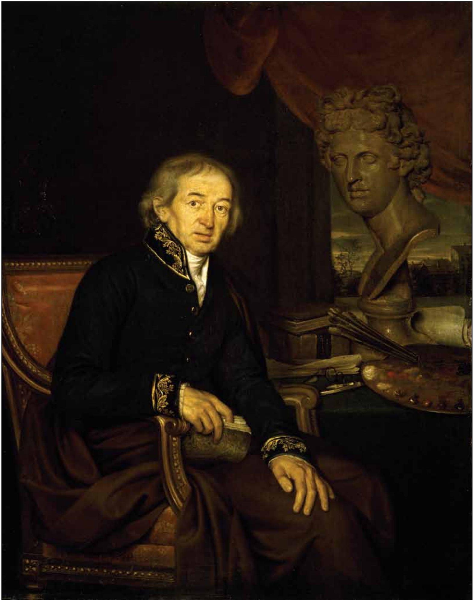
П. Е. Яковлев. Портрет Д. Г. Левицкого. 1800-е