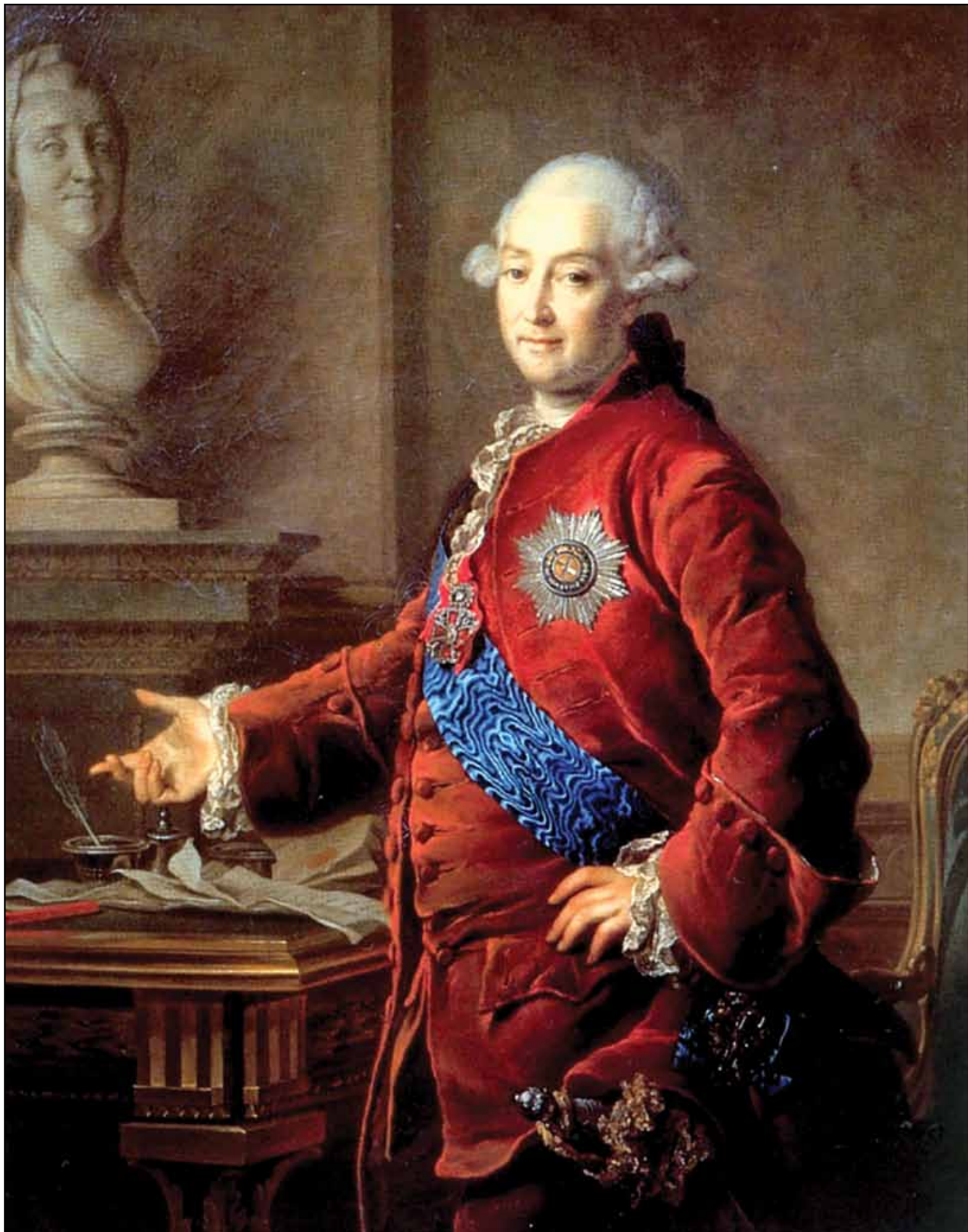
Портрет вице-канцлера князя А. М. Голицына. 1772