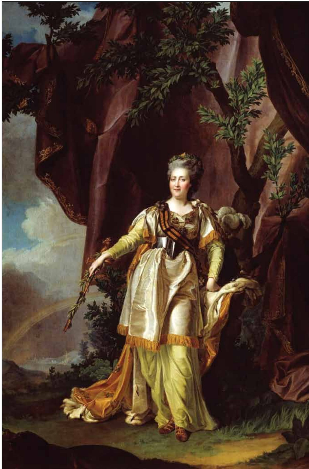
Портрет императрицы Екатерины II. 1787