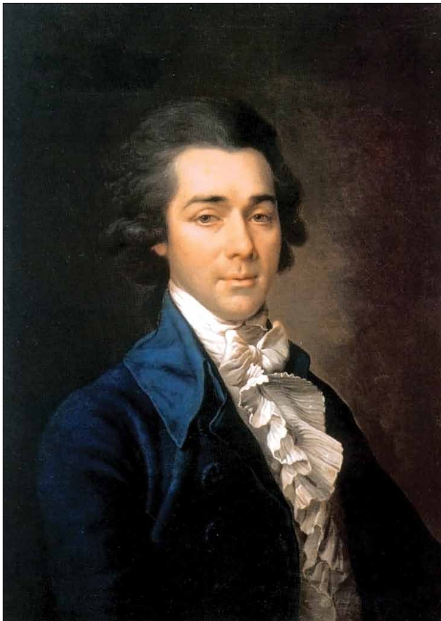
Портрет Н. А. Львова. 1789