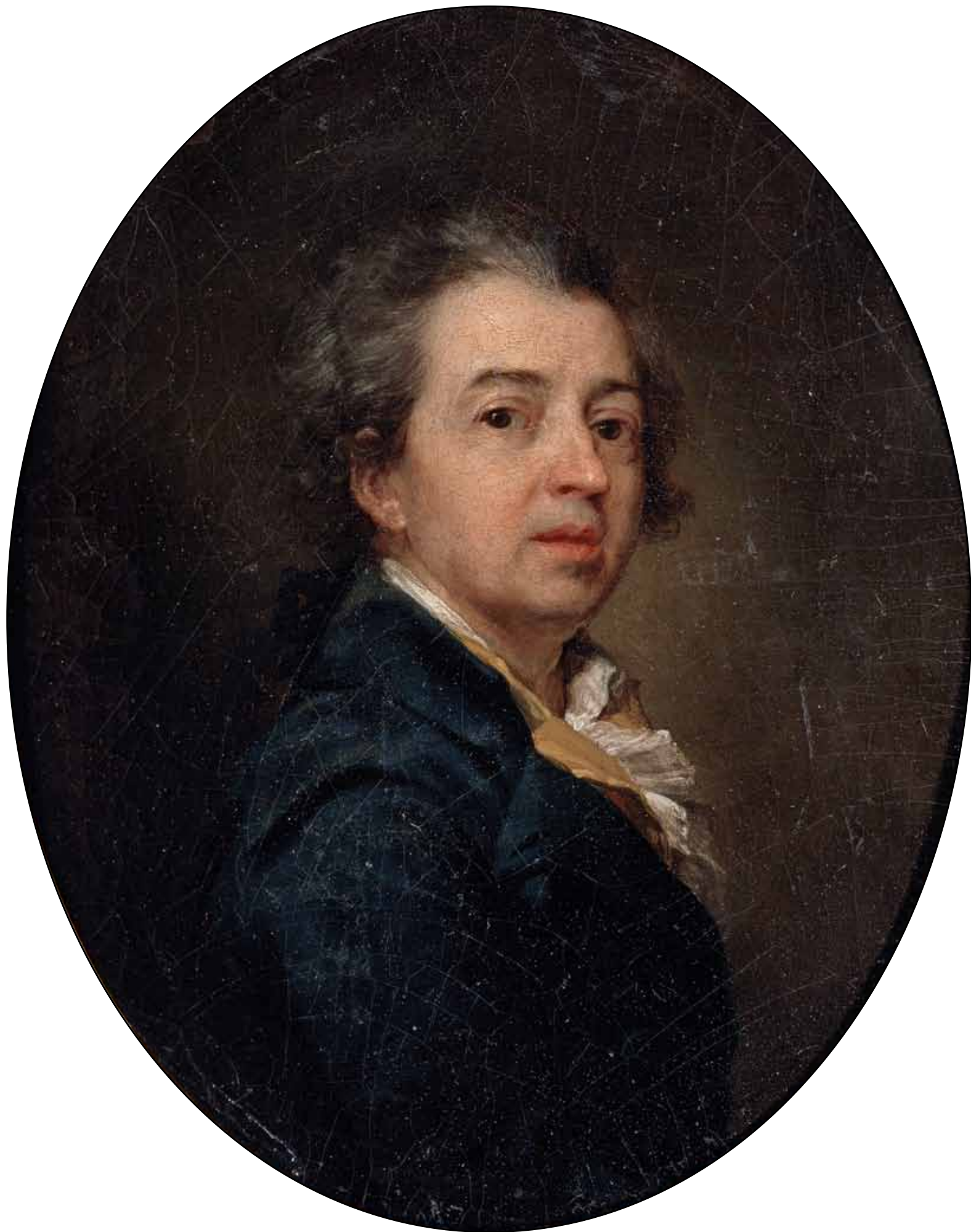
Автопортрет. 1783 (?)