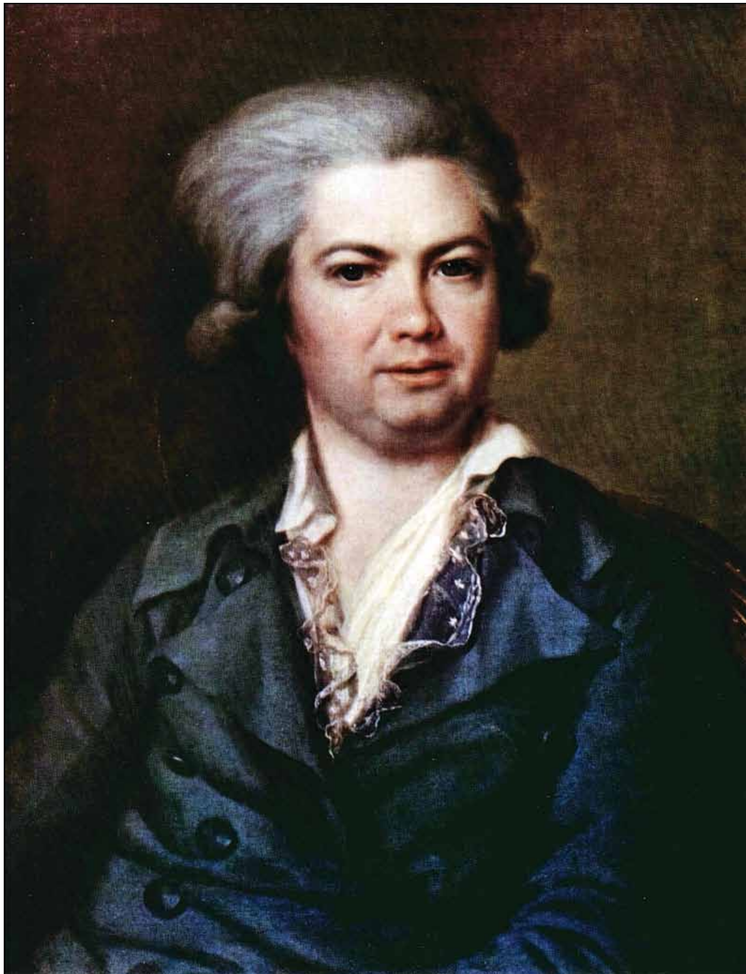
Портрет графа А. II. Воронцова. Конец 1780-х