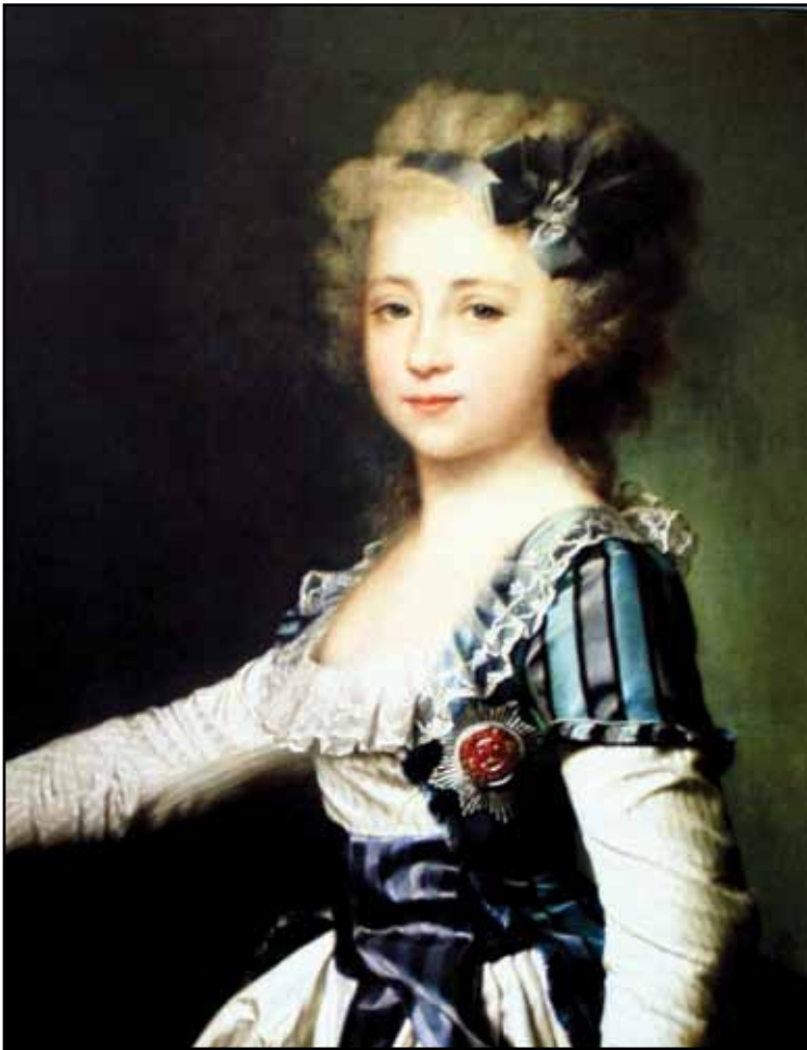
Портрет великой княжны Елены Павловны в детстве. 1791