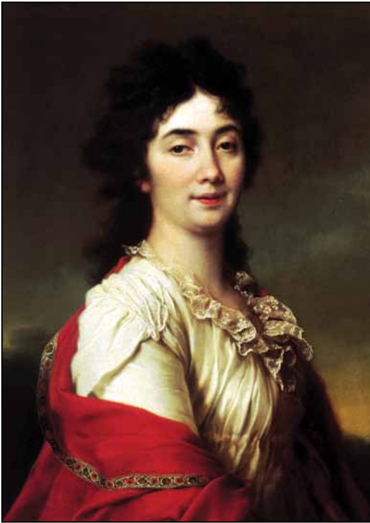
Портрет А. С. Протасовой. Около 1800

Русский музей, Санкт-Петербург) выполнен, как всегда, безупречно. Изображенная по грудь молодая женщина выглядит немного усталой и надменной. Ее большие карие глаза взирают на зрителей с холодным безразличием, и только разомкнутые алые губы свидетельствуют о былом озорстве и очаровании. Протасова представлена без парика, ее темные волосы убраны назад и спадают на плечи. Красная накидка небрежно сброшена с плеча, сияющее шелковое светло-кремовое платье с кружевным воротником выгодно оттеняет смуглую бархатистую кожу женщины. Анна Степановна, двоюродная племянница братьев Орловых и любимая фрейлина Екатерины II, была язвительной и своенравной, однако при этом обладала не только привлекательной внешностью, но и острым умом. В 1801 вступивший на престол Александр I возвел эту камер-фрейлину в графское достоинство. Достаточно редкое в истории событие (присуждение дворянского титула женщине) говорит само за себя.