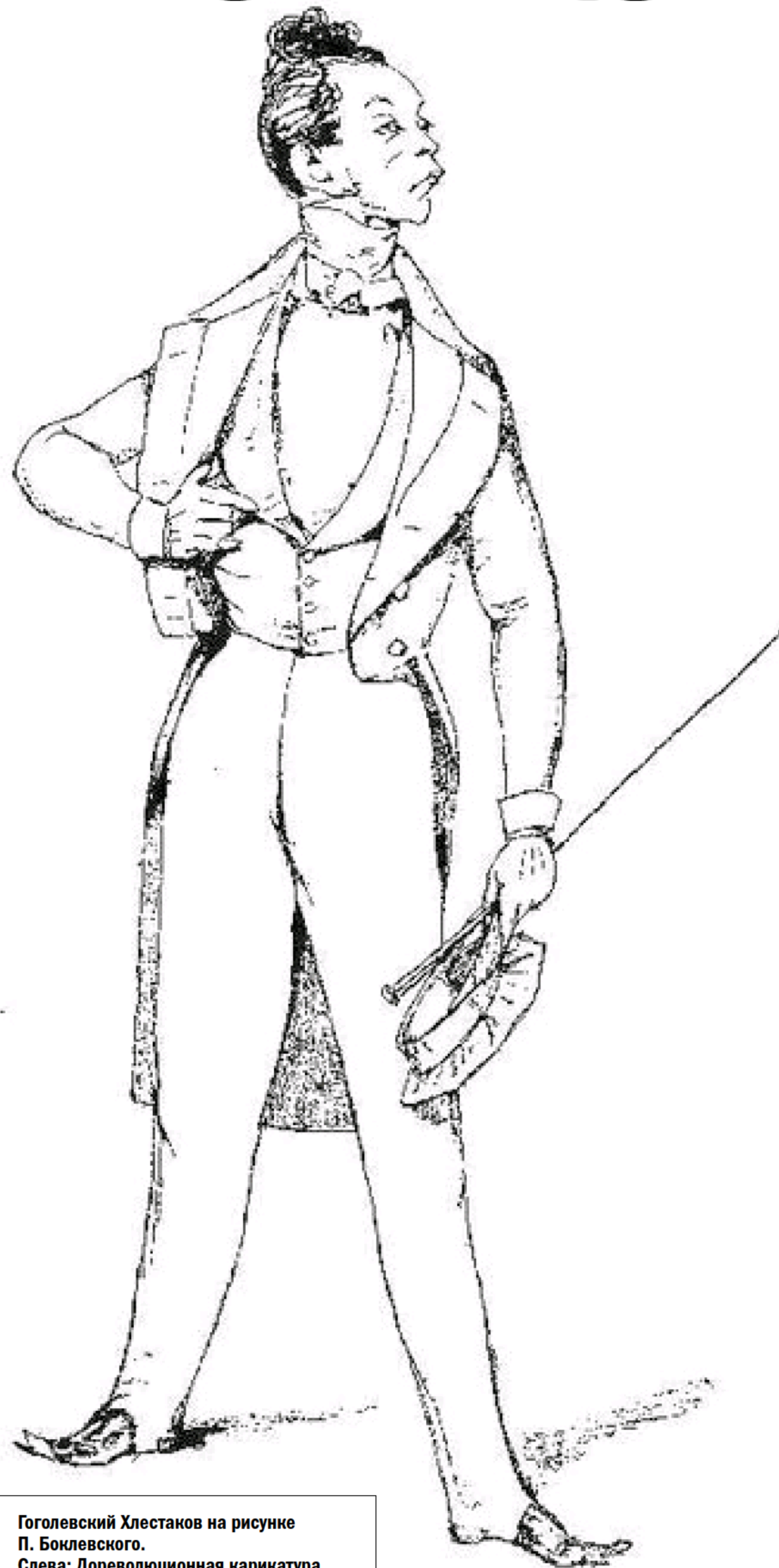
Гоголевский Хлестаков на рисунке П. Боклевского. Слева: Дореволюционная карикатура о взяточничестве

Книга, как нас учили, – лучший подарок. И это очень по-русски. Ведь вот что интересно. Как пишут исследователи истории взяточничества на Руси, само это понятие (на языке той эпохи взятка именовалась «посулом») впервые упоминается в правовых документах конца XIV века. А традиция подарков и подношений представителям власти куда длиннее. И никто эти подношения взятками не считал. Потому что первоначально они вообще были единственным источником содержания «госаппарата». Мы хорошо помним из истории такое слово, как «кормление». Так как представители центральной власти на местах никакого жалования не получали, то жили на содержании местного населения – кормлении.