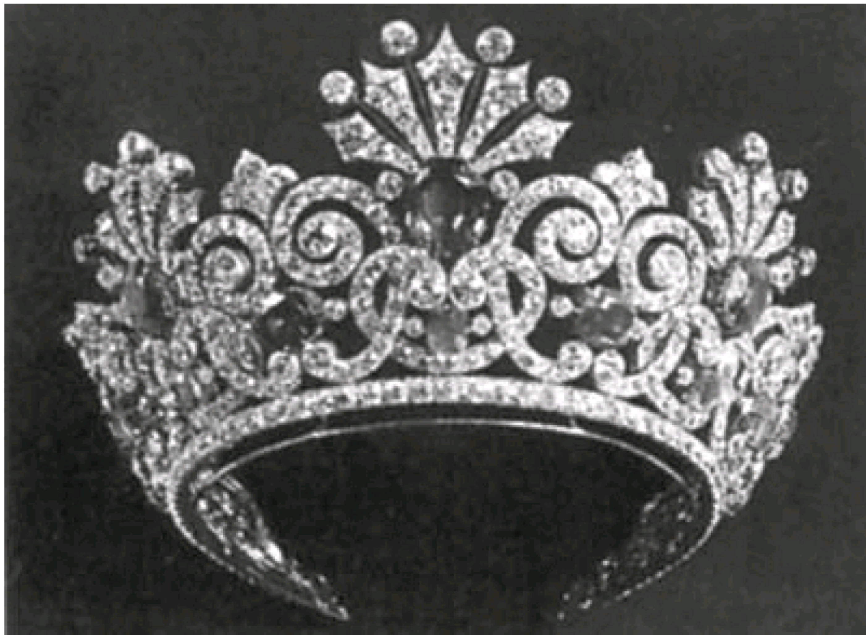
Диадема с сапфирами, принадлежавшая императрице Марии Федоровне

В апреле 1919-го Мария Федоровна вместе с семьями дочерей навсегда покинула Россию. Сначала поселилась в Англии у сво-