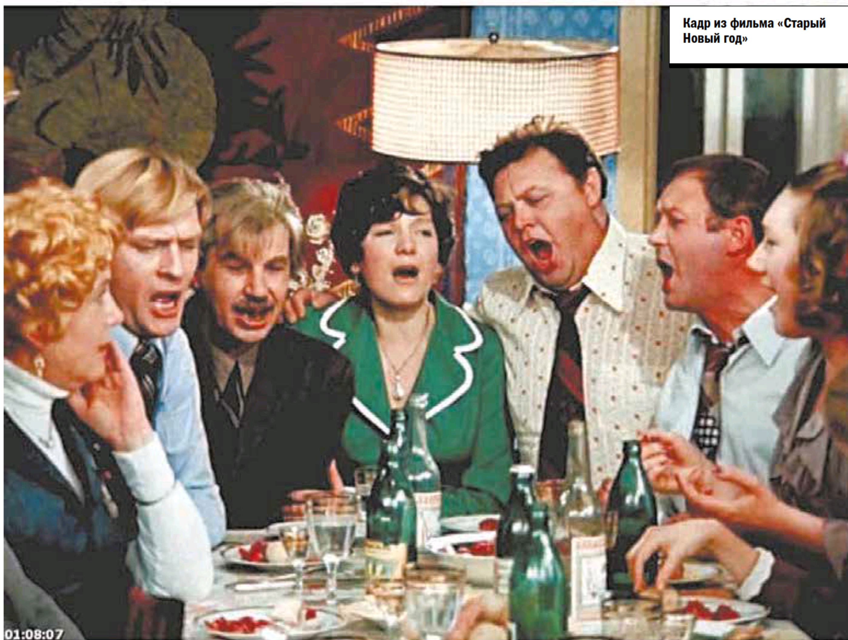
Кадр из фильма «Старый Новый год»

их от дубля к дублю, не выдержал и высказал все, что думал по поводу «заливной рыбы». Это вошло в фильм. А что касается сцены, когда Ипполит в пальто и шапке принимает душ, Яковлев действительно был удивлен, что пошла горячая вода: для мосфильмовской студии в те годы это было редкостью.