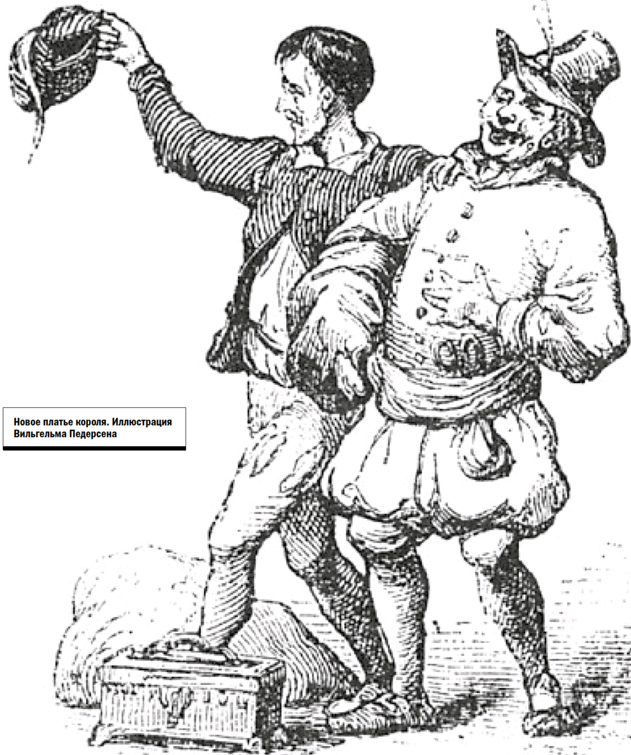
Новое платье короля. Иллюстрация Вильгельма Педерсена

Действительно, мальчик был не такой, как все. Казалось, он жил в собственном мире – все время что-то выдумывал, воображал. Его одевали в перешитые отцовские обноски, а он был уверен, что носит роскошные одежды. Однажды родители взяли его в театр. Вряд ли мальчуган понял содержание спектакля, но магия театра покорила его навсегда. После этого отец по просьбе Ханса-Кристиана сделал ему кукольный театр, и мальчик теперь постоянно играл в куклы, сам шил для них