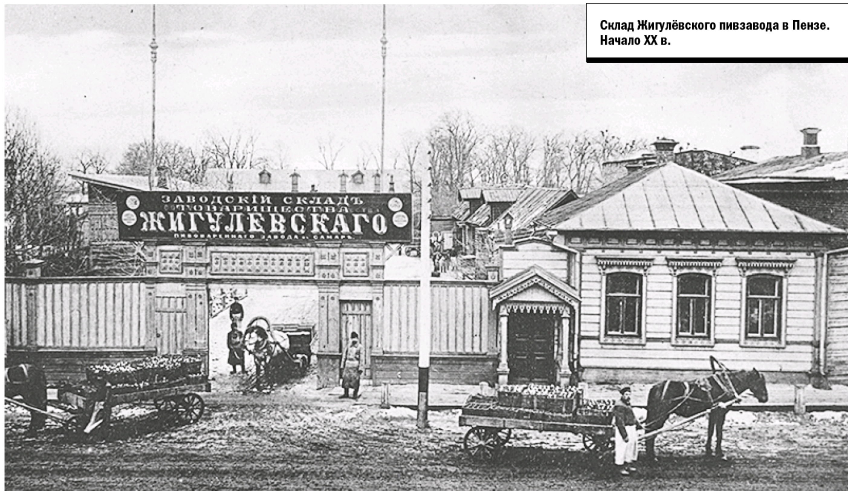
Склад Жигулёвского пивзавода в Пензе. Начало XX в.