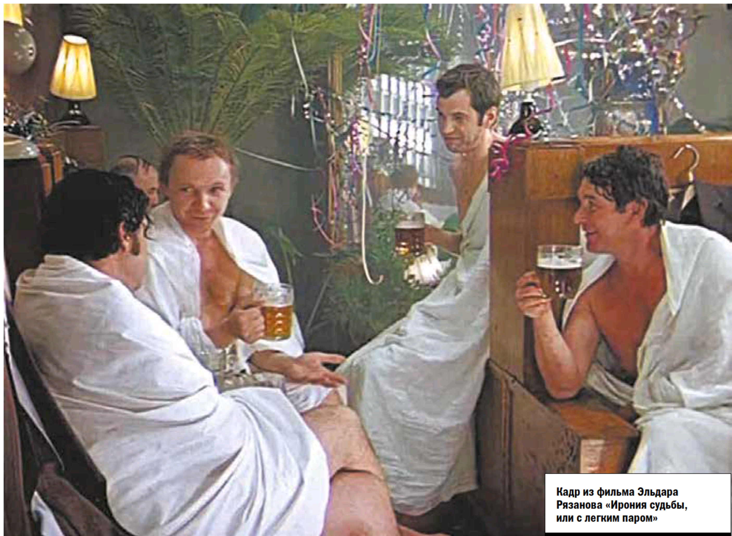
Кадр из фильма Эльдара Рязанова «Ирония судьбы, или с легким паром»

Одна из главных сцен «Старого Нового года», в Сандуновских банях, на самом деле снималась вовсе не там, хотя в кадре герои