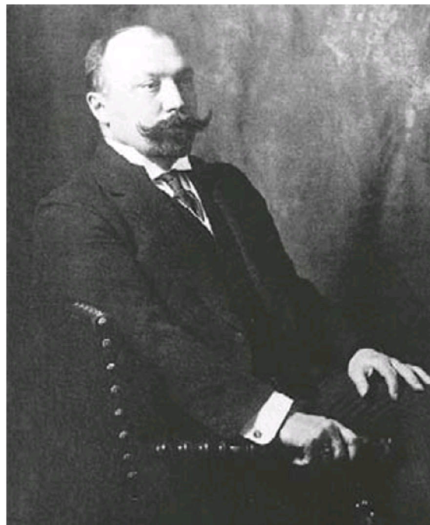
Министр финансов П. Л. Барк. 1915 г. Справа: Российский император Николай II на теннисном корте. Крым, Ливадия, 1910 г.

– Божественно! Очаровательно! Нектар! И какой спрос!