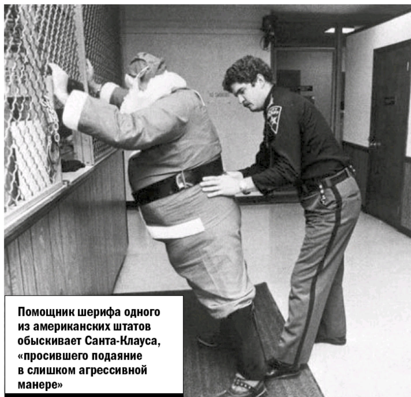
Помощник шерифа одного из американских штатов обыскивает Санта-Клауса, «просившего подаяние в слишком агрессивной манере»