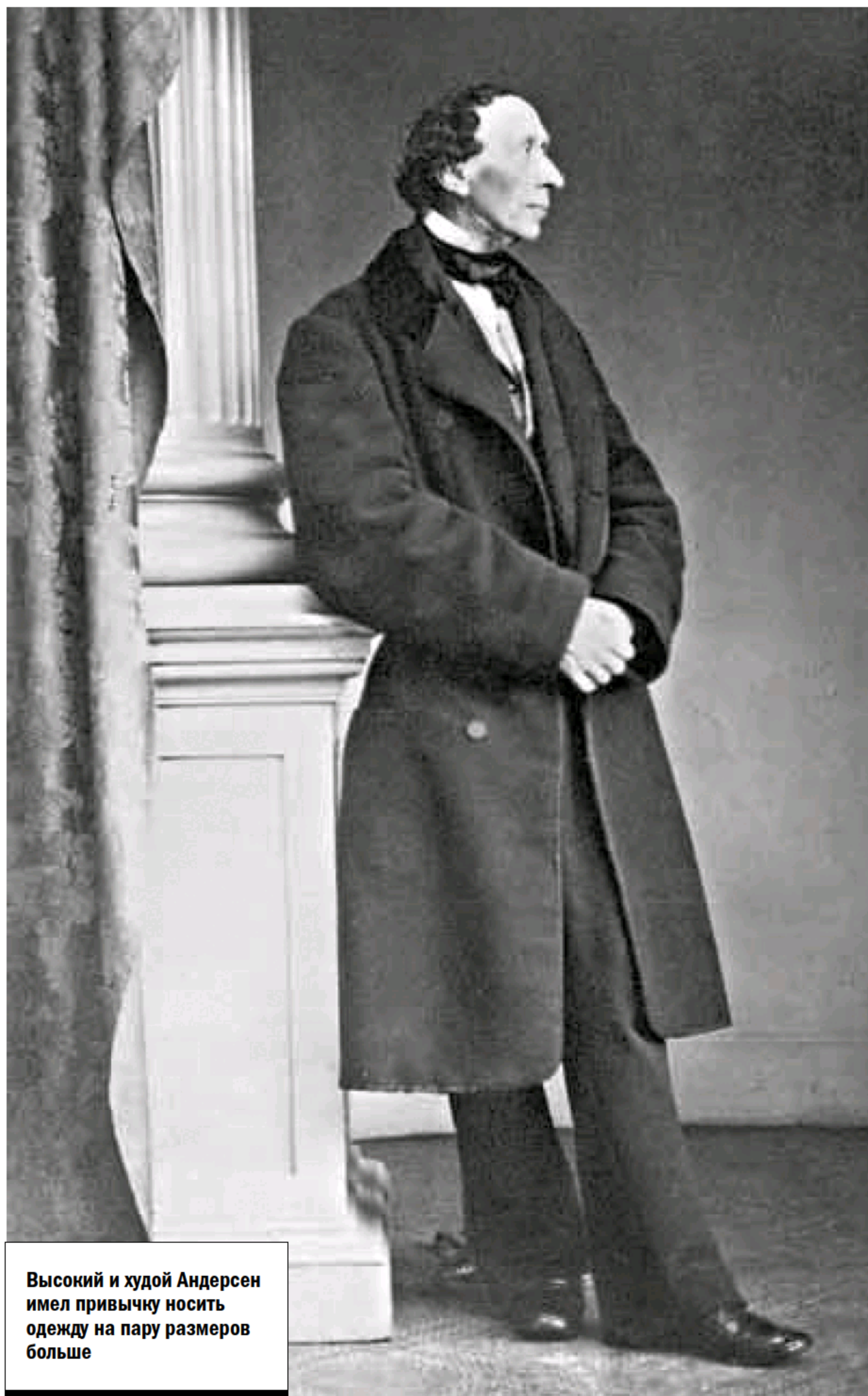
Высокий и худой Андерсен имел привычку носить одежду на пару размеров больше

Еще одним памятником Андерсену стала Международная неделя детской книги, ежегодно проходящая в разных странах мира. «Книжкина неделя», как ее называют в нашей стране, всегда открывается 2 апреля, в день рождения Ханса-Кристиана Андерсена. ■