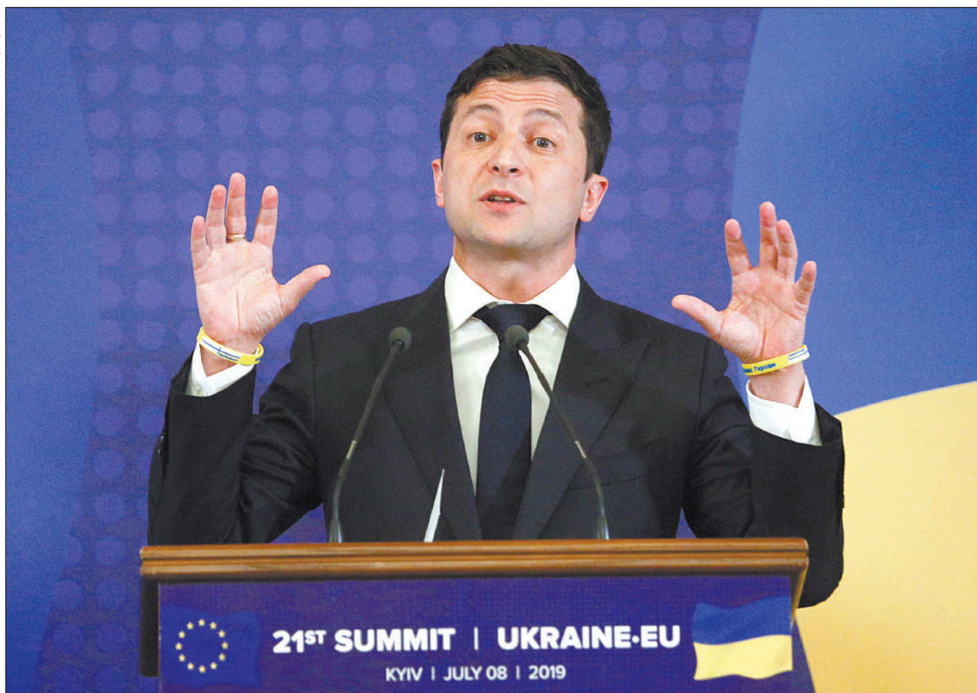
ПРЕЗИДЕНТ УКРАИНЫ ВЛАДИМИР ЗЕЛЕНСКИЙ

– Губернаторская повестка дня остается прежней: согласование общегосударственной политики и местного самоуправления. В этом плане требования президента к мэрам городов