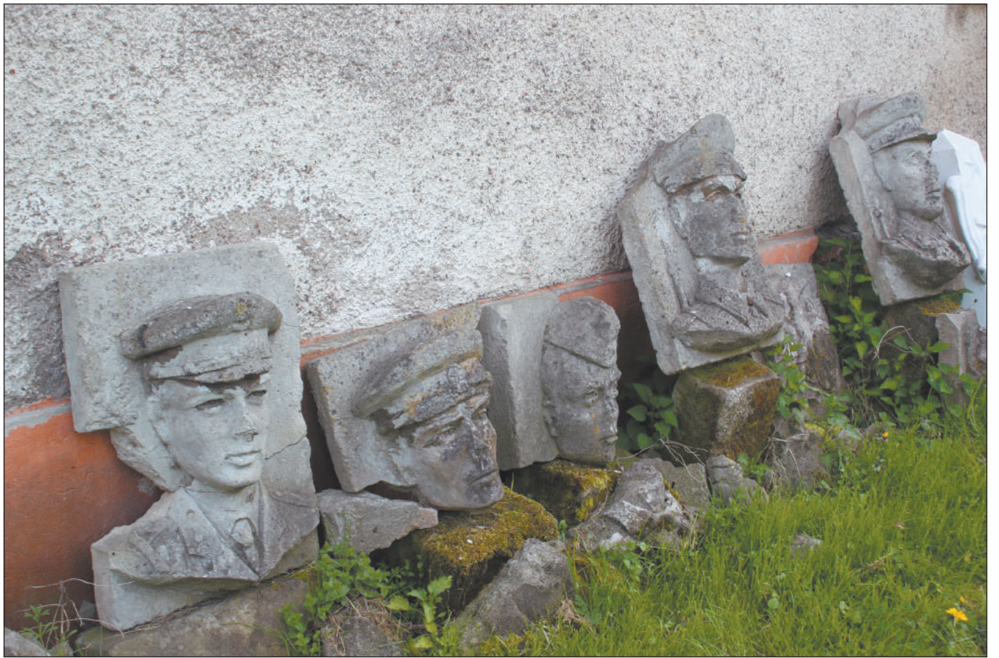
БАРЕЛЬЕФЫ СОВЕТСКИХ СОЛДАТ, ВЫБРОШЕННЫЕ В ПОЛЬШЕ

По мнению эксперта, «подобные статьи являются, прежде всего, месенджером для российской оппозиции – вы можете на нас рассчитывать и солидаризоваться с нами». В подтверждении этих слов уже несколько западников из России подержали клеветников из Die Welt.