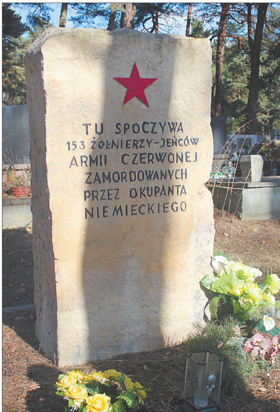
могила советских воинов в польше