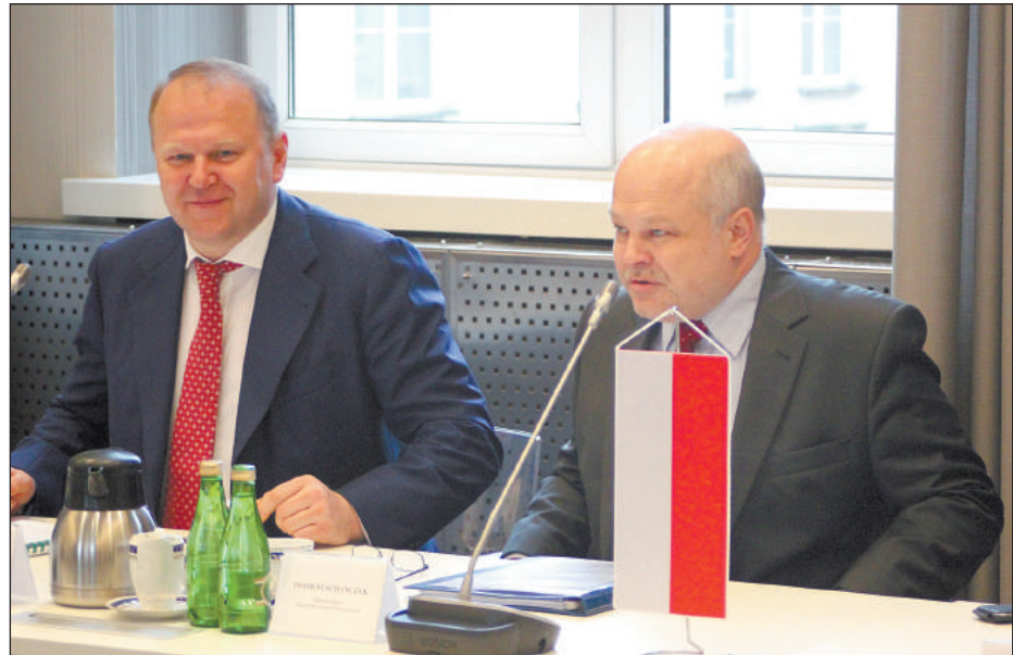
СЛЕВА ПОЛПРЕД ПРЕЗИДЕНТА РФ В УФО НИКОЛАЙ ЦУКАНОВ