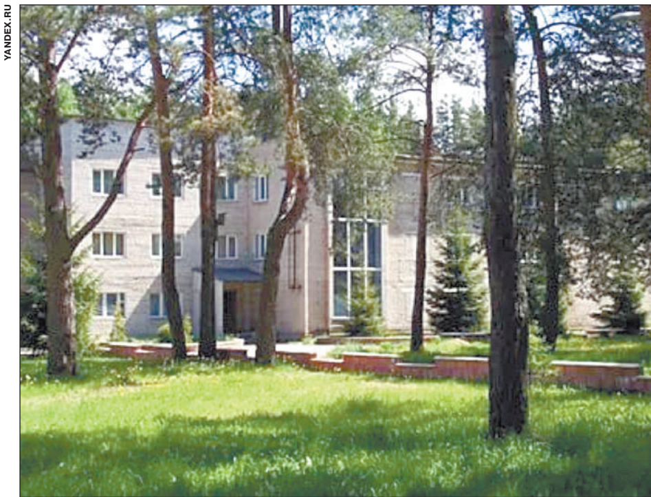
САНАТОРИЙ ГОЛУБЫЕ ОЗЕРА (ПСКОВСКАЯ ОБЛАСТЬ)