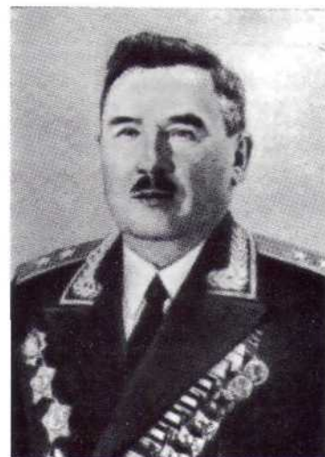
▲ А. И. Данилов

Первые награждения орденом II степени произошли согласно Указу Президиума Верховного Совета СССР от 26 октября 1943 года. Орденом Богдана Хмельницкого II степени №1 был награжден командир саперного батальона майор Б. В. Тарасенко за обеспечение переправы через Днепр в ходе его форсирования. Орден II степени №2 был вручен командиру стрелковой бригады подполковнику И. А. Каплуну за отличие во время той же операции.