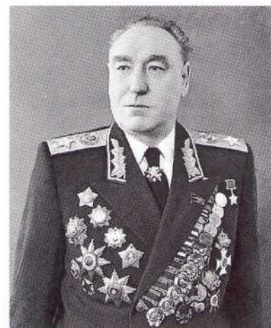
▲ Маршал С. С. Бирюзов