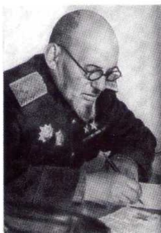
▲ С.А. Ковпак