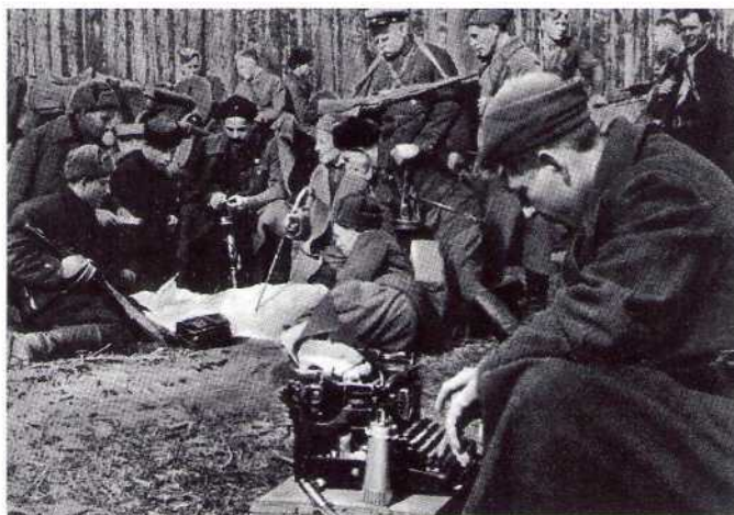
▲ Разработка операции в штабе партизанского соединения С. А. Ковпака