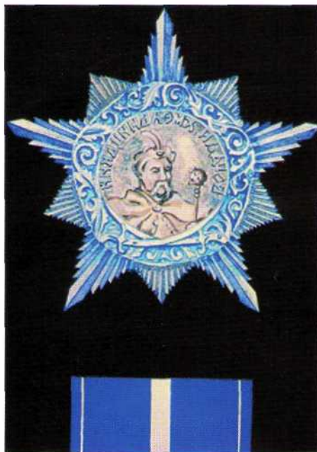
▲ Проектный рисунок ордена Богдана Хмельницкого (вместе с эскизом орденской планки)