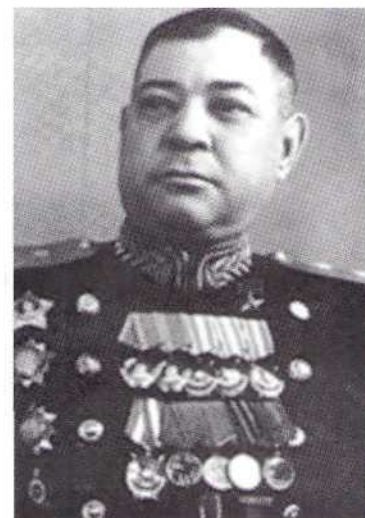
▲ В. К. Баранов

Осенью 1943 года орден Богдана Хмельницкого III степени был вручен летчику-штурмовику лейтенанту Г. Т. Береговому (впоследствии дважды Герой Советского Союза и летчик-космонавт СССР).