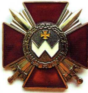
▲ Орден Богдана Хмельницкого II степени (Украина)

16 марта 2000 года Верховная Рада Украины приняла закон Украины «О государственных наградах Украины», которым была установлена государственная награда Украины — орден Богдана Хмельницкого I, II, III степени. Законом было предусмотрено, что его действие распространяется на правоотношения, связанные с награждением лиц, удостоенных знаков отличия Президента Украины. Президенту было рекомендовано привести свои решения в соответствие с принятым Законом.