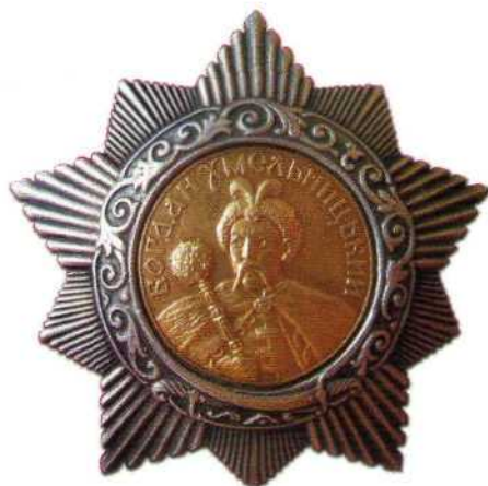
▲ Орден Богдана Хмельницкого II степени