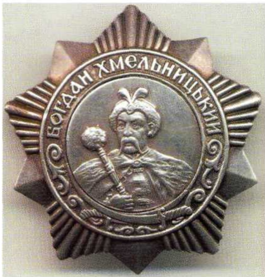
▲ III степень ордена Богдана Хмельницкого была единственной советской полководческой наградой, которой могли быть награждены солдаты и партизаны