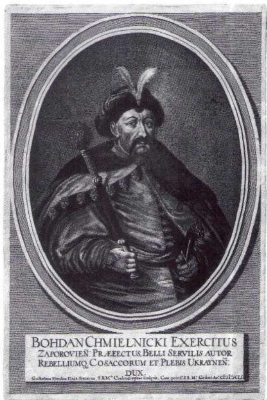
▲ Богдан Хмельницкий

Орден Богдана Хмельницкого был учрежден последним из «сухопутных» полководческих орденов. Это единственный полководческий орден, одной из степеней которого могли удостоиваться рядовые бойцы и партизаны. Он также единственный орден СССР, имевший надписи не в русском варианте произношения (украинская транскрипция «БОГДАН ХМЕЛЬНИЦЬКИЙ»).