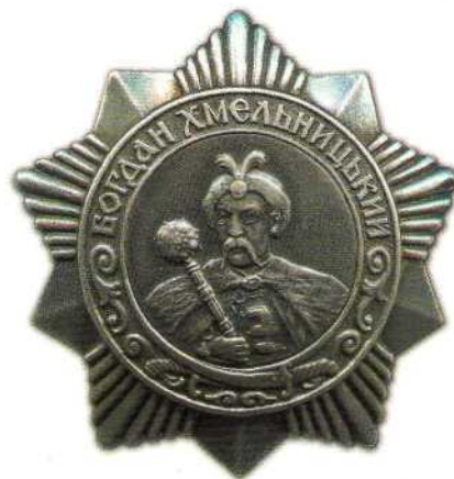
▲ Орден Богдана Хмельницкого III степени

освобождены угоняемые на немецкую каторгу советские граждане, нарушены коммуникации и линии связи, уничтожены транспорты противника.