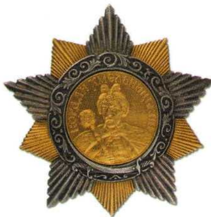
▲ Орден Богдана Хмельницкого I степени