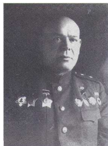
▲ Н.П. Пухов (фото 1943 года)