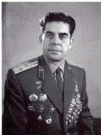
▲ Г. Т. Береговой

Л етчик-космонавт СССР, дважды Герой Советского Союза (единственный, кто удостоен первой звезды Героя за Великую Отечественную войну, а второй - за полет в космос). Заслуженный летчик-испытатель СССР. Генерал-лейтенант авиации. Кандидат психологических наук.