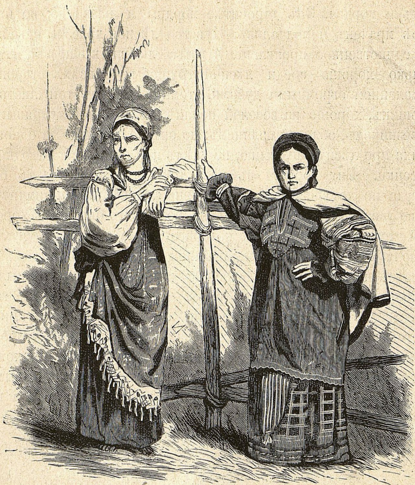
ЧЕРЕМИСКИ ВЪ ИХЪ КОСТЮМАХЪ.