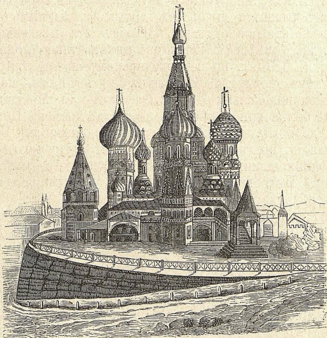
Церковь Василия Блаженного.

Между тѣмъ, сѣверная и сѣверо-западная часть Россіи, отдѣленная отъ восточной дремучими лѣсами, непроходимыми болотами, Волгой, обратилась къ мастерамъ изъ западной Европы, они занесли къ нимъ стиль романскій, въ духѣ котораго и стали строить всѣ церкви этихъ частей Россіи.