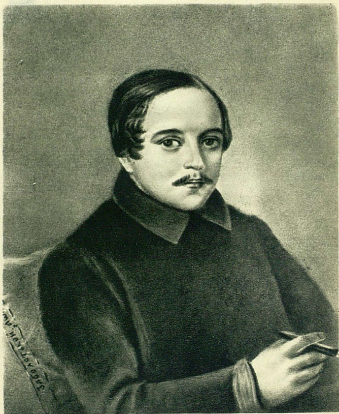
М. Ю. ЛЕРМОНТОВ — студент. (С портрета П. Заболотского.)