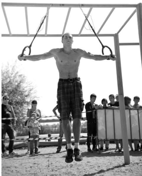
Трезвость даёт преимущества в спорте

— Мы стремимся увеличить количество людей, которые личным примером и авторитетом распространяют трезвый образ жизни. Очень ждём принятия и выполнения законопроектов об ограничении продажи алкоголя. Также планируем сделать систематическим празднование Дня здоровья, подготовить специалистов, расширив масштабы популяризации трезвости и регулярно проводить лекции для белоцерковцев, распространять газеты о трезвости среди жителей города, популяризировать сайт «Трезвая Украина» и т. д.