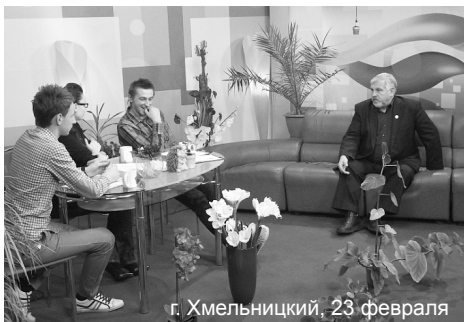
г. Хмельницкий, 23 февраля

После плодотворной беседы, которая понравилась журналистам, была записана ещё одна передача, которую обещали выпустить на экраны позже.