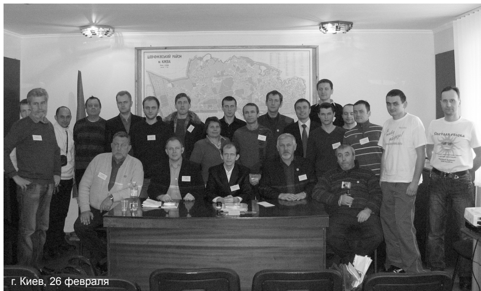
г. Киев, 26 февраля