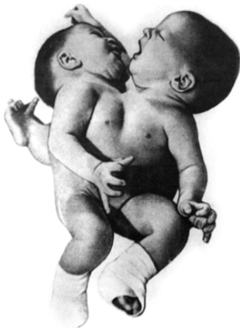
Рис.2. Сиамские близнецы. Рождаются из зародышевых клеток, повреждённых алкоголем