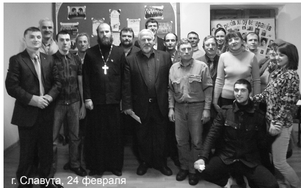
г. Славута, 24 февраля