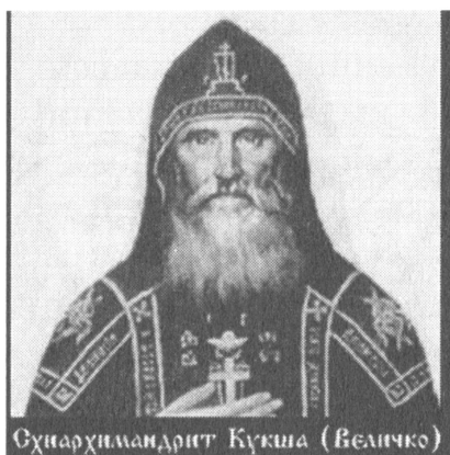
Схиархимандрит Кукша (Величко)

Православная Церковь всегда славилась подвижниками благочестия, старцами, святыми людьми. Одним из светильников веры во тьме богоотступничества, духовного оскудения и невежества XX столетия был преподобный и духоносный отец схиигумен Кукша (Величко) .