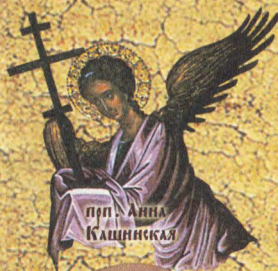
прп. Анна Кашницкая