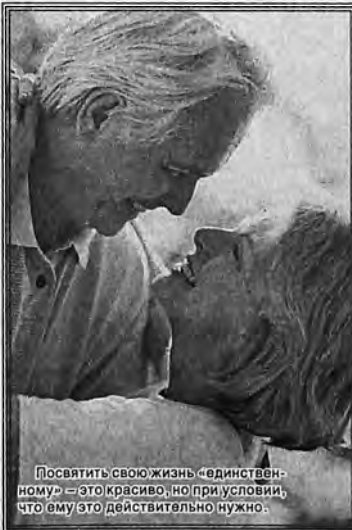
Посвятить свою жизнь «единственному» — это красиво, но при условии, что ему это действительно нужно.

Без розовых очков: конечно, практика и бабки-ворожихи здесь ни при чём. Это обычный психологический приём «Не думаю о белой ошейнике». Человек произнёс: «Никто не будет любить сильнее», и всё — заложил в голову девушку «программку», с тех пор она станет всех кандидатов сравнивать с «колдуним», а те согласно «программе» проигрывают. Будь барышня менее внушаемой, давно бы выкинула его из головы. Бывают и другие причины, из-за которых кажется, что привязана к одному-единственному на века. Когда он больно ударил по самооценке, внушил комплексы, разбил сердце. Вместо того чтобы обещать школадом и забыть супостата, обижённая асю жизнь будет доказывать, какую женщину «он, дурунь, потерял». И верить, что «дурунь» — единственный и любимый. Хотя при чём тут любовь?