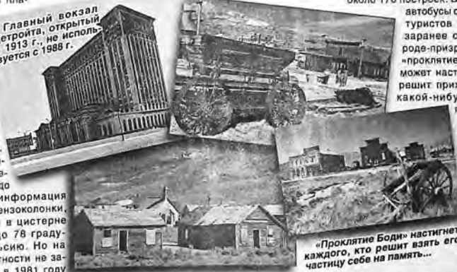
«Проклятие Боди» настичет каждого, кто решит взять его частицу себе на память...

поселении. Дурная слава Боди далеко вышла за пределы его территории. Он день за днём оправдывал своё прозвище — «город греха» бесконечной стрельбой, драками, кражами и насилием. Священник Уоррингтон, проживавший в городе, описывал его так: «Здесь царят беззаконие, похоть и море греха». К 1887 году было открыто новое месторождение золота, после чего Боди стал расти. Его население к 1890 году увеличилось почти до 10000 человек. Жизнь била ключом, круглые сутки работали более 65 баров, игровые автоматы, публичные дома и «чайнатаун», в котором можно было попробовать опиум. Помимо всего этого, город имел собственные пивоварни, а если алкоголя не хватало, его ввозили поездами.