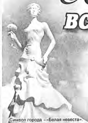
Символ города — «Белая невеста».