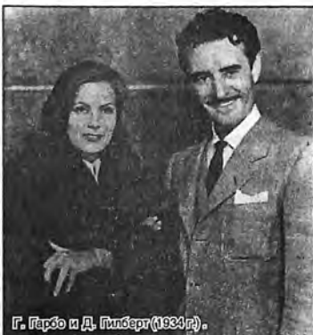
Г. Гарбо и Д. Гилберт (1934 г.).

были вложены нотки усталости, выжидания. А небольшой шведский акцент лишь придавал любимце публики дополнительный шарм. Теперь Майор являлся её новые работы в прокат под слоганом: «Гарбо говорит!», и публика валила валом. Интерес подогревал тот факт, что актриса в отличие от всех голливудских звезд и звёздочек никогда не давала интервью, не подписывала автографы, не общалась с поклонниками «Северный Сфинкс», говорив на большом экране, хранил молчание за кадром. «Вдохновение», «Сюзен Леннокс: её падение и возвышение», «Мигд Харн», «Какой ты меня хочешь» — фильмы выходили один за другим с неизменным успехом. Роль же по сути у Гарбо была одна и та же: роковая красавица-соблазнительница. Другой её вид не хотел никто — ни режиссёры, ни зрители. В 1938 году Гарбо решила на эксперимент и снялась в комедии. Критики признавали исключительно шлопом — да, блистательная, а обыватели и вовсе не желали разбирать юнскую актёрскую игру и попросту оставили картину. Через три года актриса предприняла ещё одну попытку вырваться из образа женщины-вамп: в фильме «Дулилка женщина» она танцевала, бегала на лыжах, плавала, только что на голове не стояла, но, увы, экшен ещё не