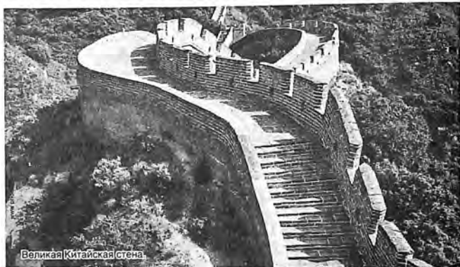
Великая Китайская стена

Китайцы ежегодно используют 74 миллиарда палочек для еды. Поставьте знак равенства 25 миллионам деревьев и почувствуйте лесам Поднебесной, такими темпами их скоро не останется! Национальные традиции традициями, но про такой предмет кухонного обихода, как вилка, тоже не стоит забывать – решили на