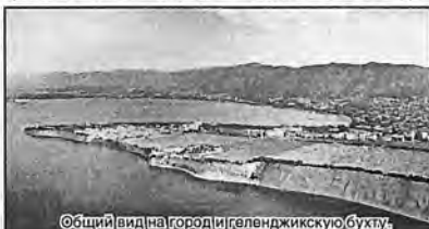
Общий вид на город и Геленджикскую бухту.

Также в Геленджике есть три аквапарка (один из которых является крупнейшим в Европе), знаменитый Утрищский дельфинарий, геологический музей, арт-галерея современного искусства «Белая лошадь», океанариум и «Сафари-парк». Последний — идеальное место для любителей дикой природы. Настоящая «горная страна» с канатной дорогой и зоопарком, в котором условия обитания животных максимально приближены к естественным. Причём, жители парка отделены