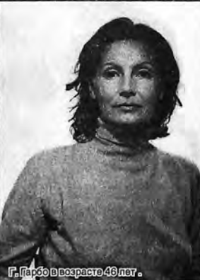
Г. Гарбо в возрасте 46 лет.

ссыкать. В 1932 году при подписании нового контракта настояла на гонорарах, равных которым не было тогда ни у кого — 250 тысяч долларов за каждый фильм. Мало того, ей предоставили исключительное право самой выбирать себе партнёра по картине и всех членов съёмочной группы. Деньги, слава, признание в кинобизнесе — всё было у её ног. Не было семьи, детей, домашнего уюта. Разумеется, у неё периодически