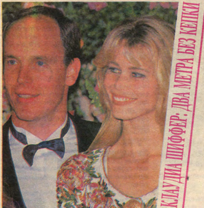
КЛАУДИЯ ШИФФЕР: ДВА МЕТРА БЕЗ КЕЛКИ