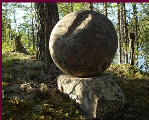
Фото. Сейд, менгир северян

Что есть область сия? В ней Земля и Луна, Ложь и Истина слиты ма'caus'ка к ма|куш|ке ; единство их — се|йд ло парей , людей Северя , ма'cou'ки глаз: мен|гир Мен|ы , Луны, камень на камне как Вечность на брении, Луна на Земле, Шар на куб|е , гнезде ( куб|ло — укр.) бранных, над тьмой Огнь ( см. ).