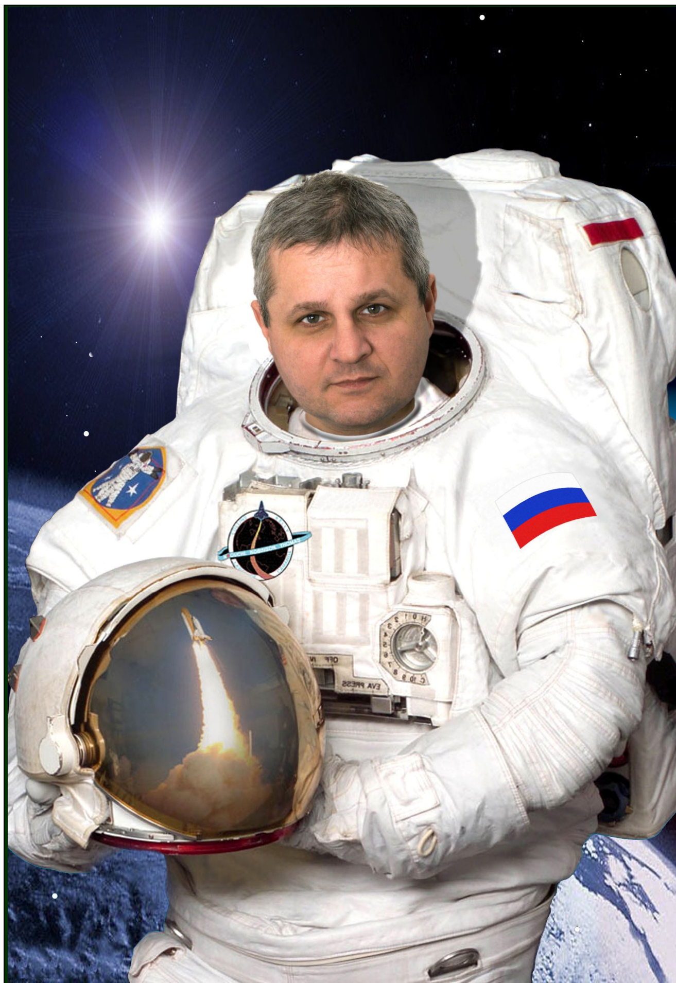
L una * O leg * V ladimirovich * E rmakov