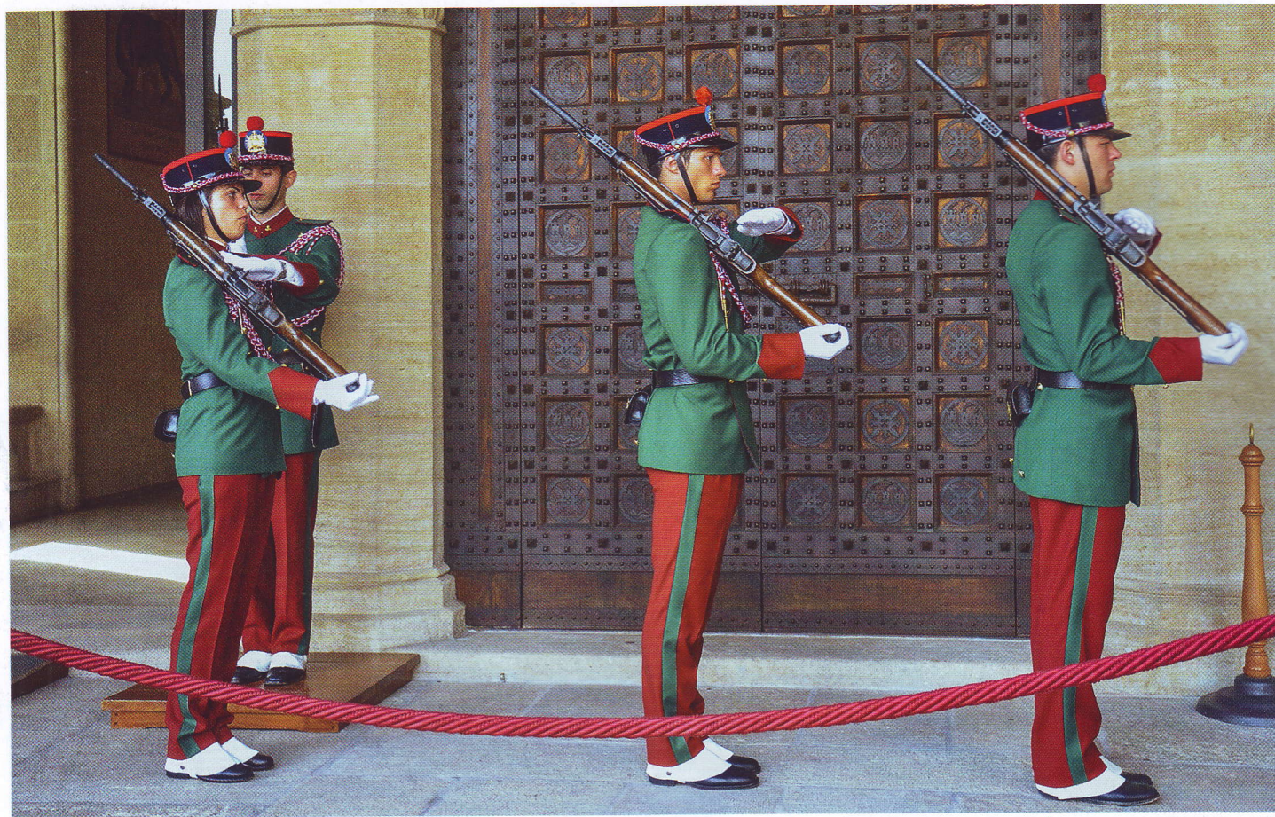
СМЕНА КАРАУЛА У ЗДАНИЯ ПАРЛАМЕНТА РЕСПУБЛИКИ САН-МАРИНО. ГВАРДЕЙЦЫ ОДЕТЫ В СТАРИННЫЕ МУНДИРЫ

Структурно жандармерия Республики Сан-Марино делится на базовые оперативные группы, которые называются бригадами. В составе корпуса и два самостоятельных отдела — отдел информации, расследований и судебной полиции и отдел предупредительных служб и опергрупп. Кроме того, в стране действует и подразделение по связям с Интерполом.