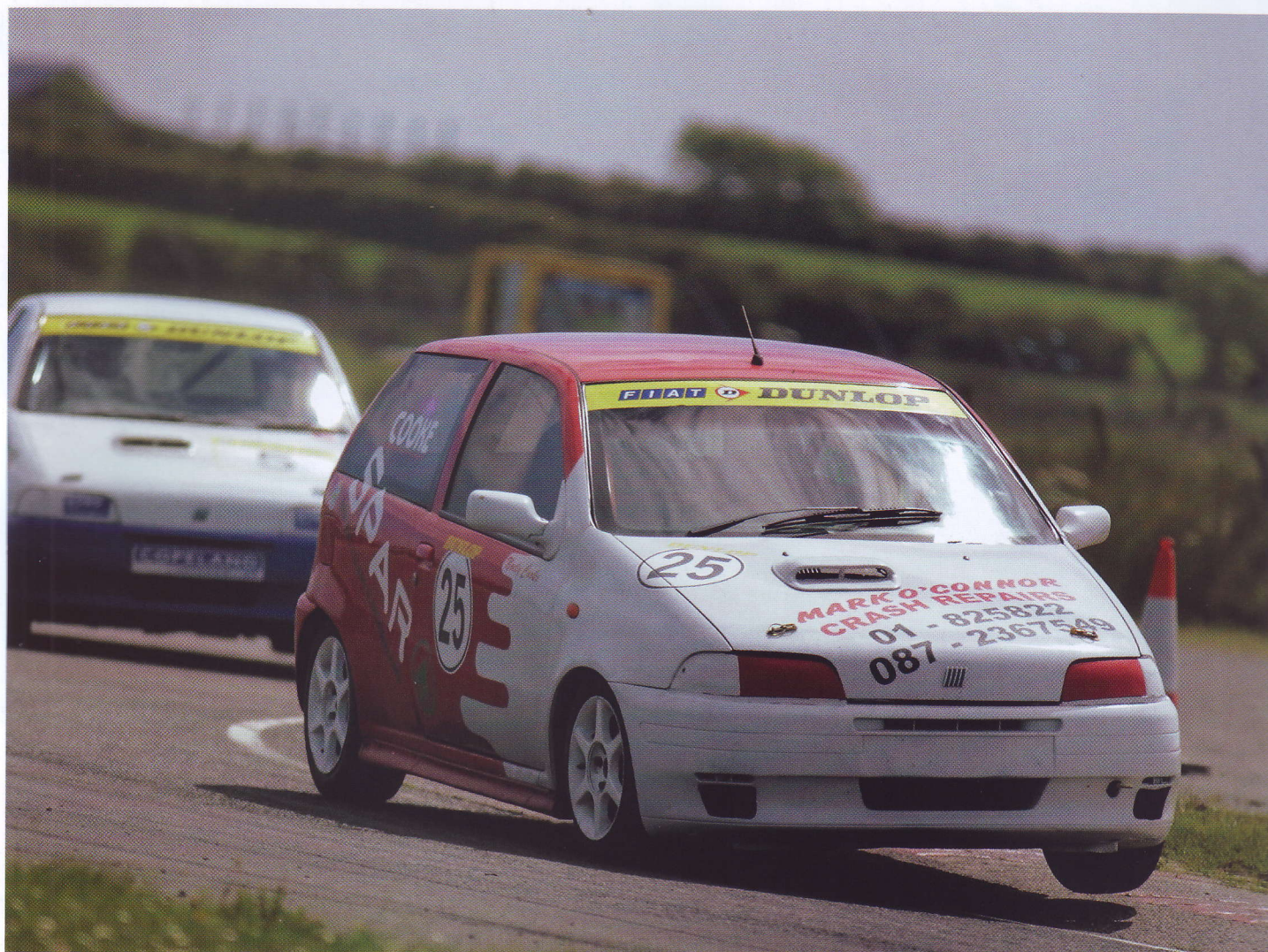
FIAT UNO PUNTO ВО ВРЕМЯ ГОНКИ «КИРКИСТОУНСКОЕ КОЛЬЦО» (СЕВЕРНАЯ ИРЛАНДИЯ, ГРАФСТВО ДАН)

с Джорджетто Джуджаро. А вот интерьер стилисты FIAT создавали в собственном дизайн-бюро.