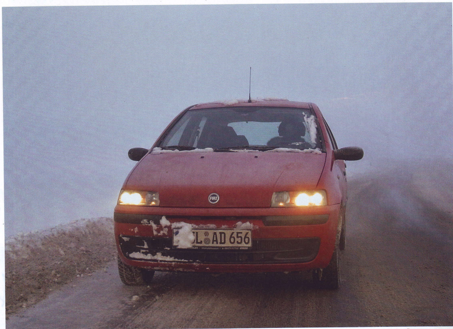
FIAT PUNTO ВО ВРЕМЯ СНЕЖНОЙ БУРИ В ГЕРМАНИИ

В линейку двигателей входили несколько бензиновых моторов объемом от 1,1 до 1,6 л и мощностью от 55 до 90 л.с., оборудованных непрямым впрыском топлива. Автолюбителям предлагали и 1,7-литровые турбированные дизели мощностью 63 и 70 л.с.