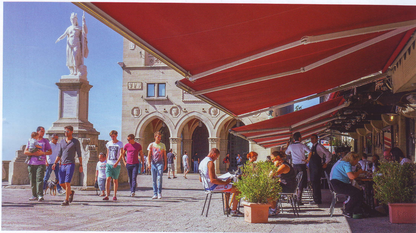
САН-МАРИНО СЧИТАЕТСЯ ОДНИМ ИЗ ТУРИСТИЧЕСКИХ ЦЕНТРОВ ЕВРОПЫ. В СЕЗОН СЮДА СЪЕЗЖАЮТСЯ ДЕСЯТКИ ТЫСЯЧ ТУРИСТОВ

Сан-Марино — одно из самых маленьких государств Европы, со всех сторон окруженное территорией Италии. Его площадь составляет всего 60,57 квадратных километров, а численность населения чуть более 30 тысяч человек. Государственный язык — итальянский.