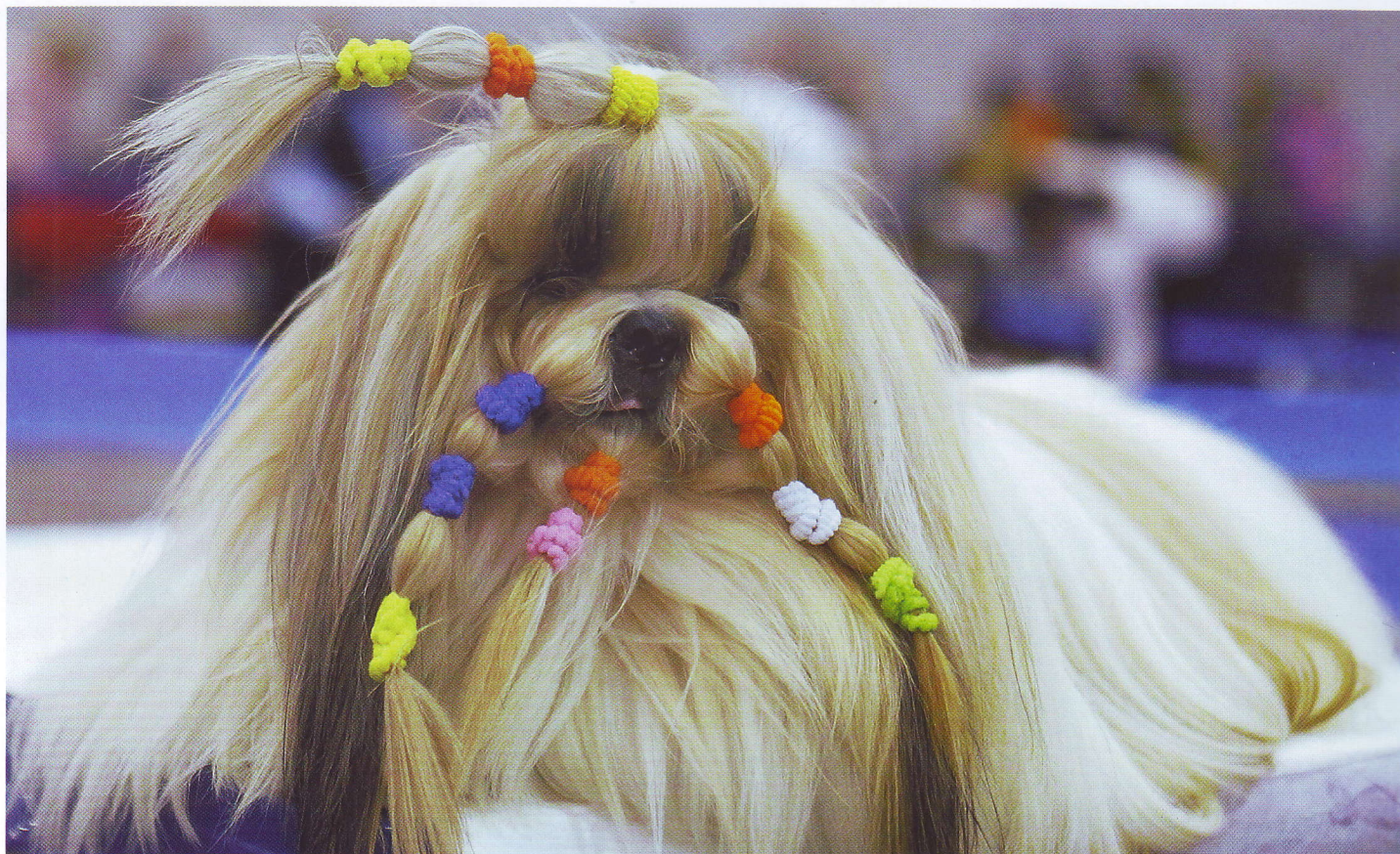
ВЛАДЕЛЬЦЫ СОБАК — УЧАСТНИКОВ ДОГ-ШОУ НЕ ЖАЛЕЮТ НИ СИЛ, НИ ДЕНЕГ, ЧТОБЫ ИХ ПИТОМЦЫ ВЫГЛЯДЕЛИ СНОГШИБАТЕЛЬНО

что-либо с земли и мыть им лапы после окончания прогулки. Однако этому предупреждению вняли далеко не все, и уже к вечеру нескольких собак пришлось отправить к ветеринару с признаками отравления. Позже стало известно, что пострадавших животных спасти не удалось.