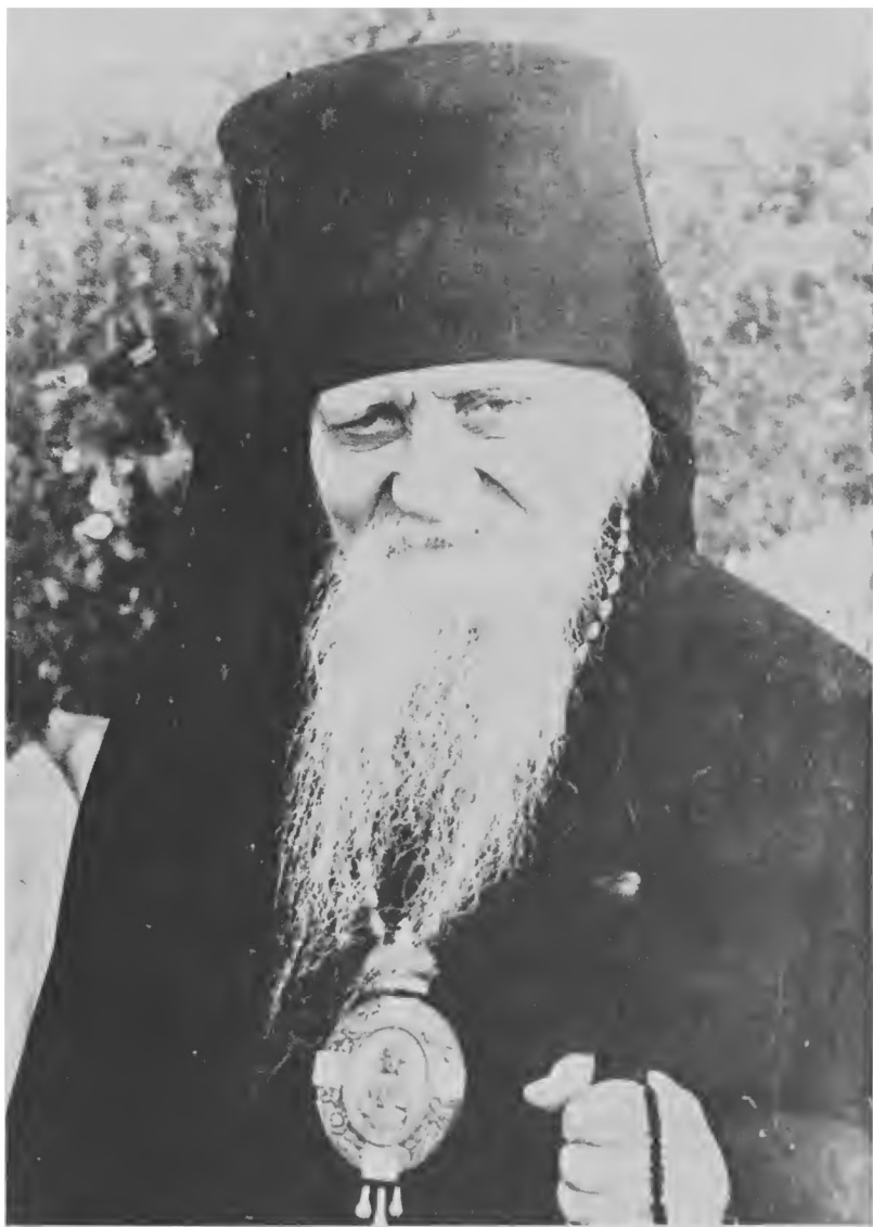
Епископ Ковровский Афанасий (Сахаров)