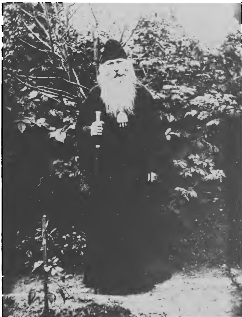
Епископ Дмитровский Серафим (Звездинский)