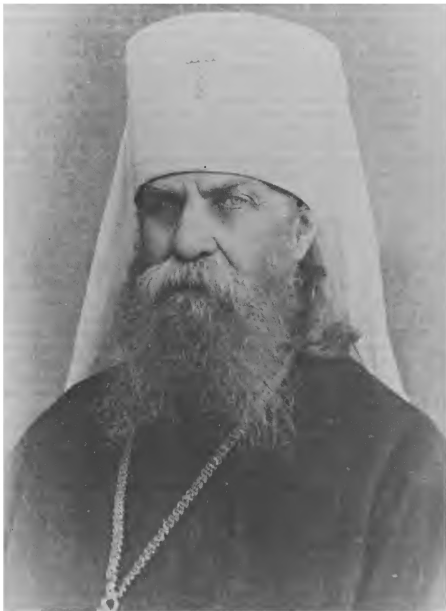
Митрополит Крутицкий Петр (Полянский)