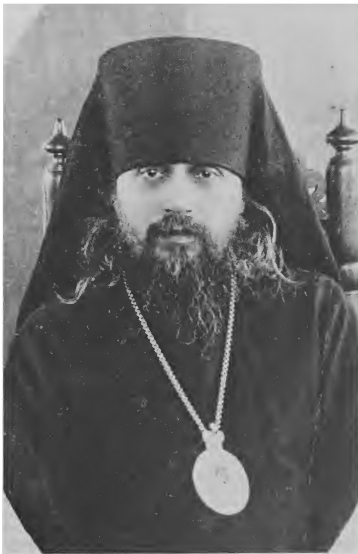
Архиепископ Серпуховский Арсений (Жадановский)