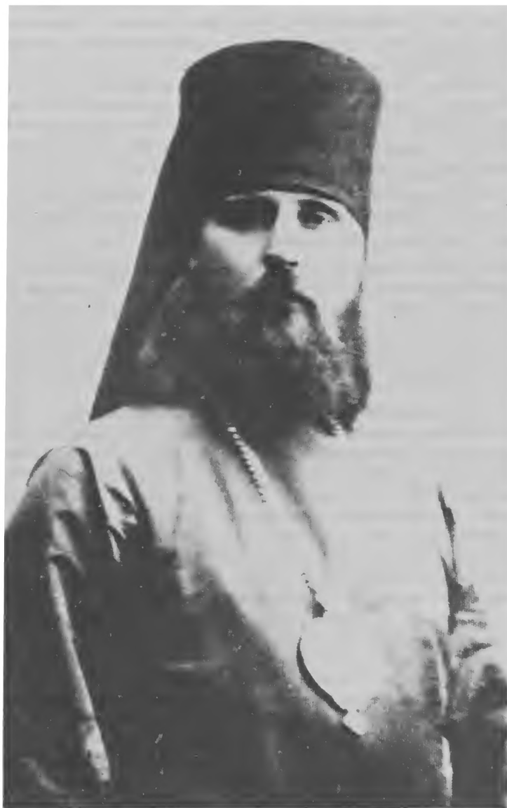
Архиепископ Иларион (Троицкий)