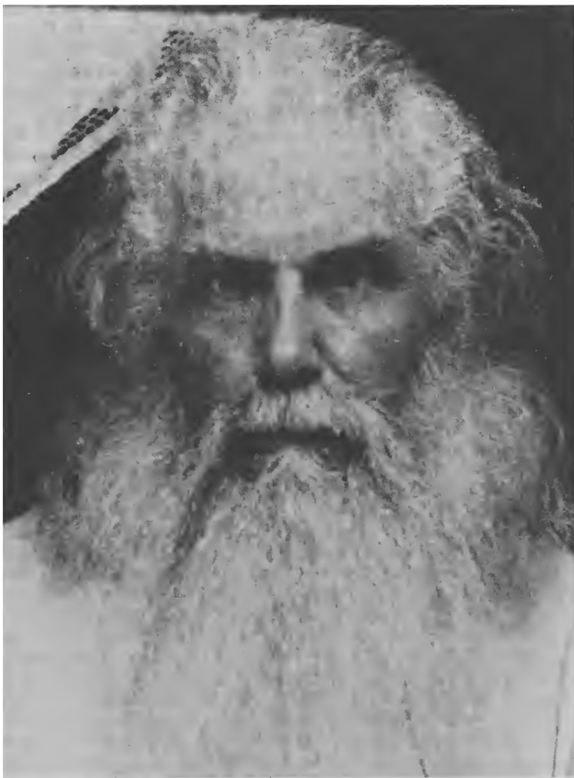
Митрополит Казанский Кирилл (Смирнов)