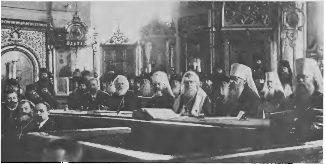
Всероссийский Поместный Собор 1917 г.

Президиум, слева направо: кн. Евгений Трубецкой, прот. Николай Любимов, митр. Арсений Стадницкий, Патриарх Тихон, митр. Антоний Храповицкий.