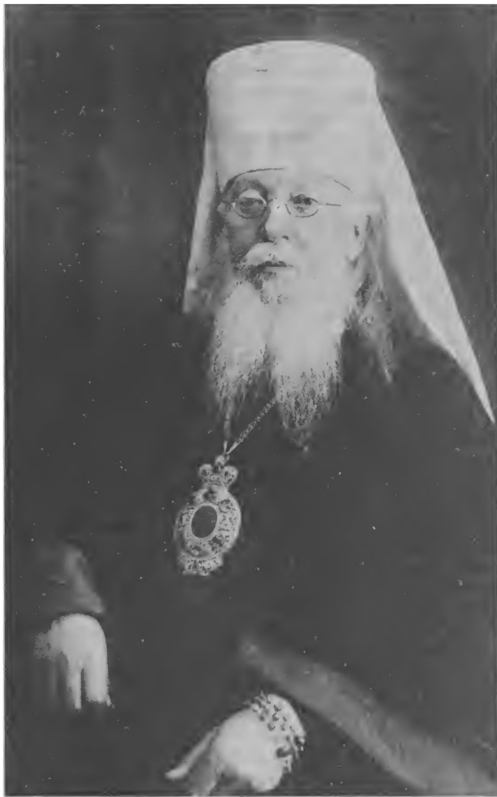
Митрополит Ярославский Агафангел (Преображенский)