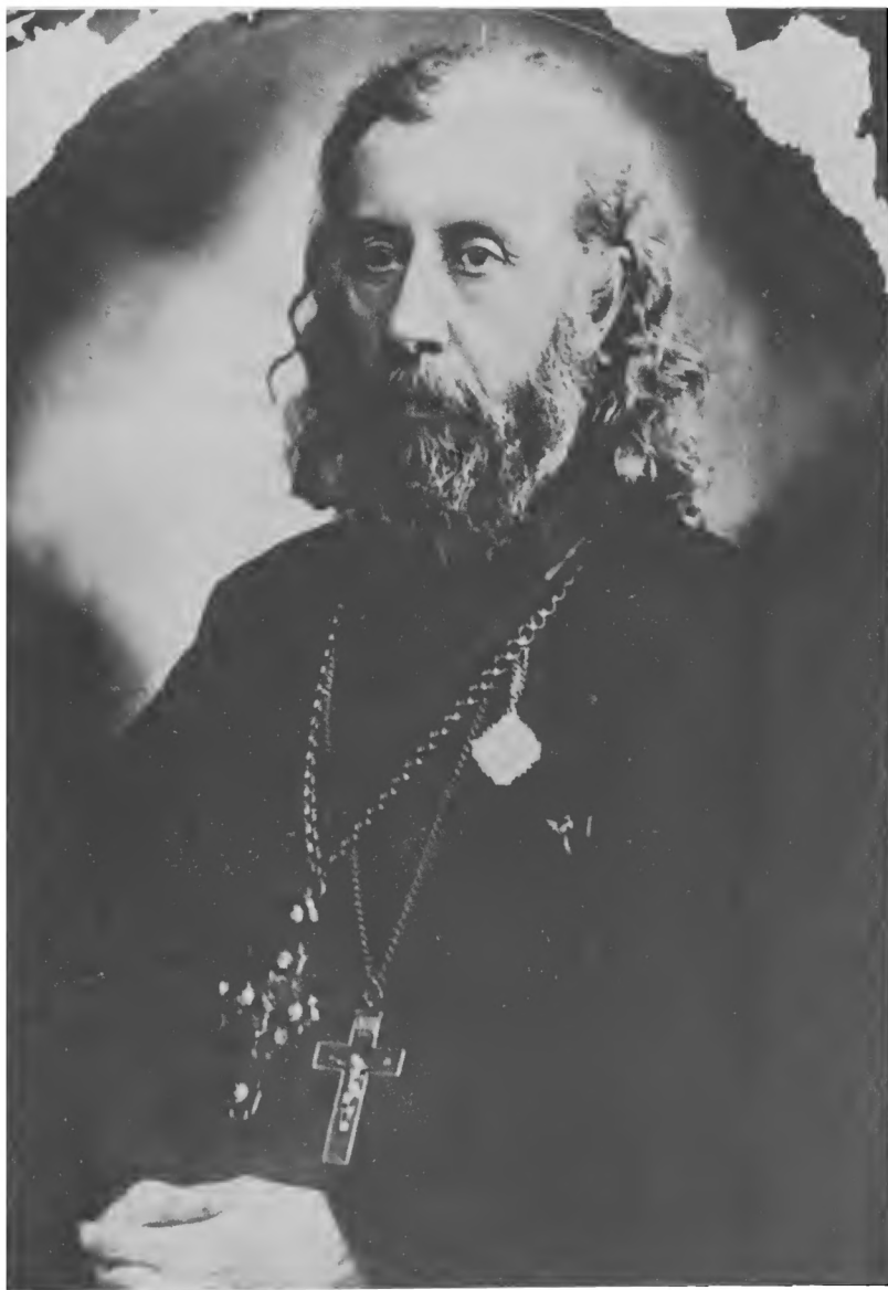
Прот. Димитрий Любимов (будущий архиеп. Гдовский)