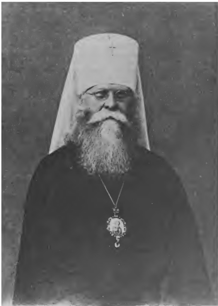
Митрополит Иосиф (Петровых)