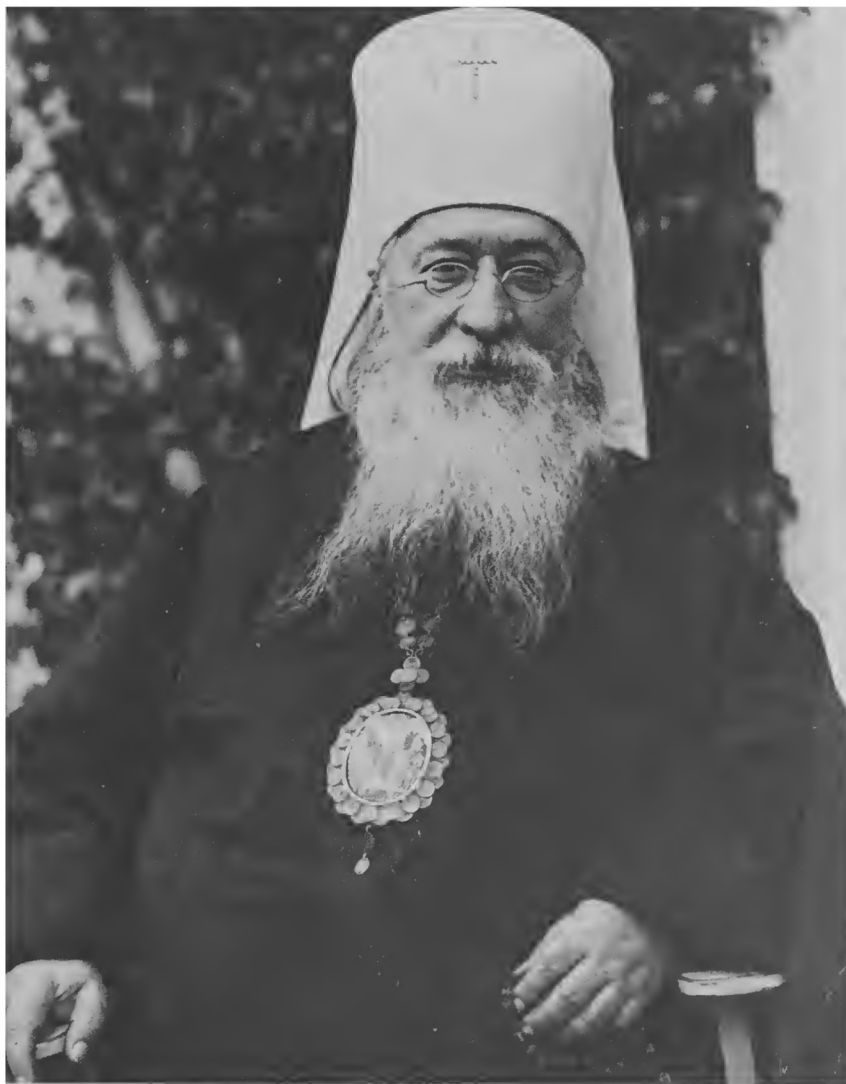
Митрополит Евлогий (Георгиевский)