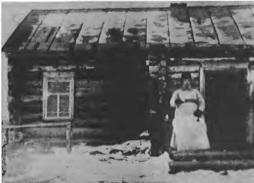
Митрополит Крутицкий Петр на острове Хэ