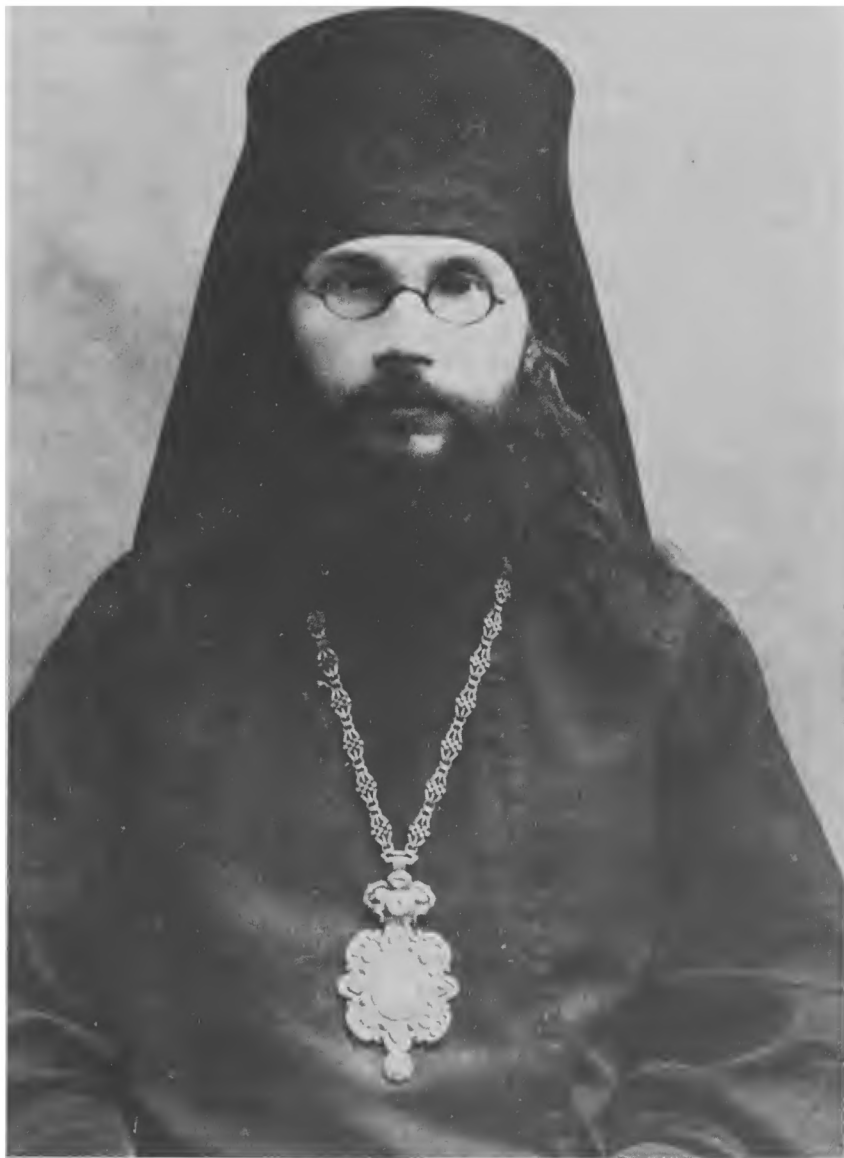
Архиепископ Волоколамский Феодор (Поздеевский)