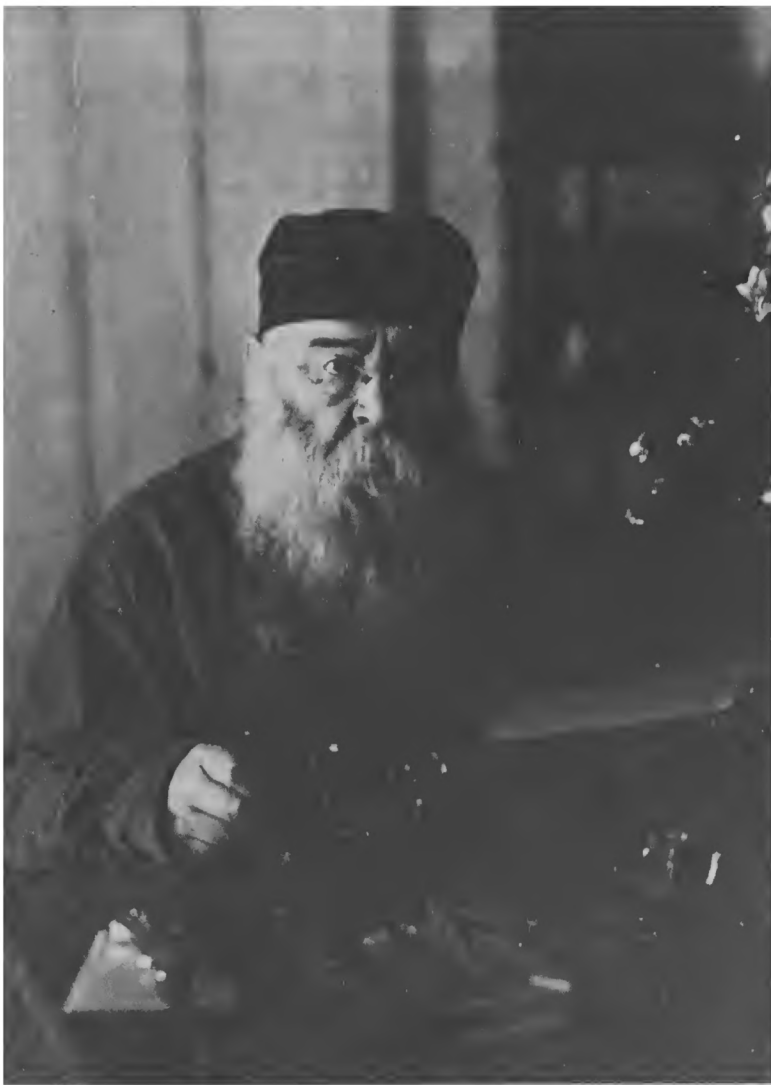
Митрополит Сергей (Страгородский)