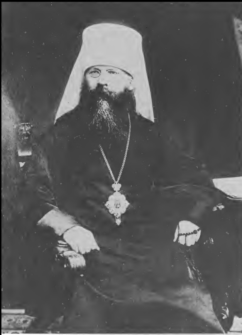
Митрополит Петроградский Веннамин (Казанский)