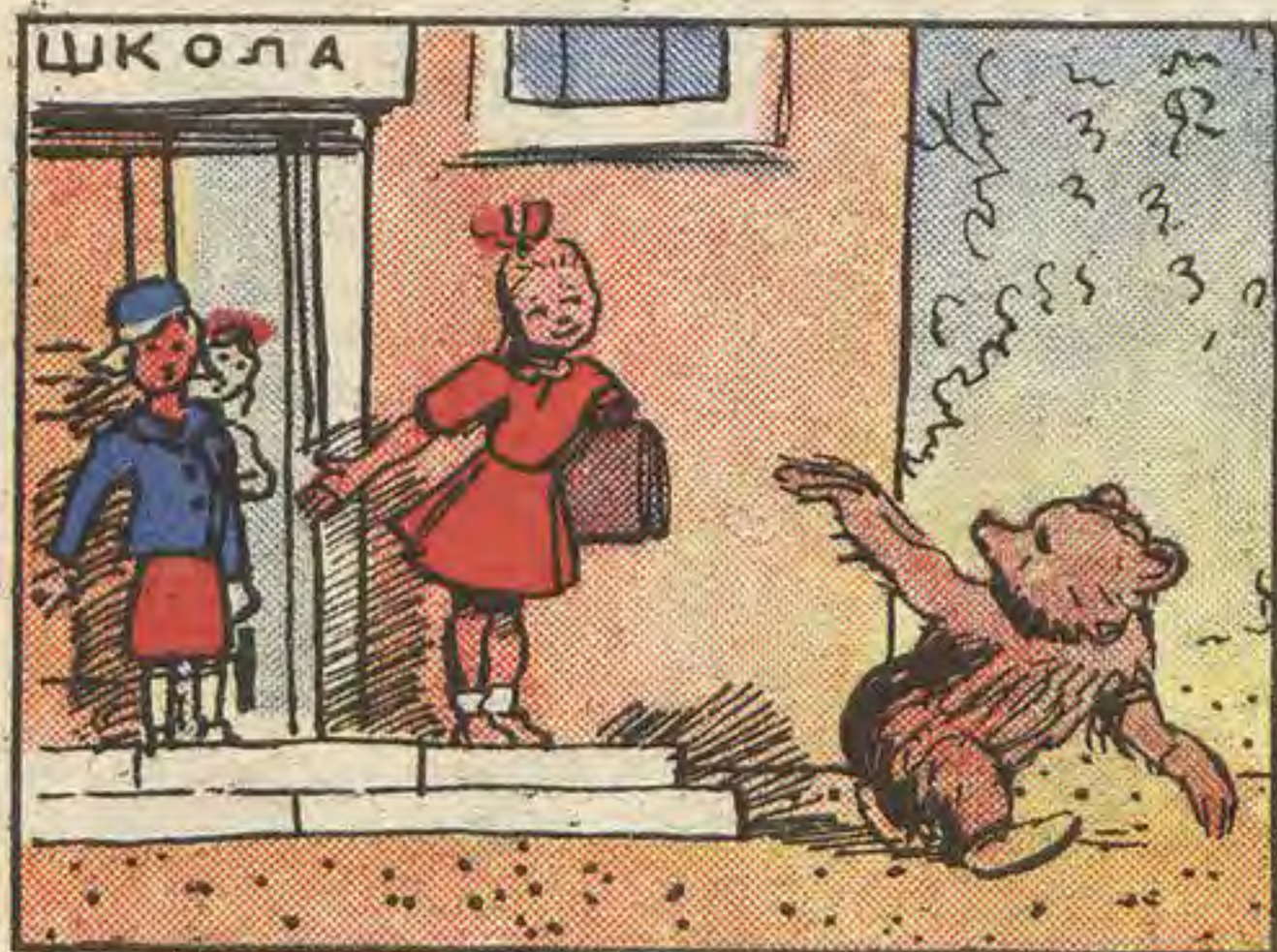
Рис. А. КАНЕВСКОГО

Пришёл Топтыжка в класс, поиграл, побегал, попрыгал, а потом вдруг как заворчит: «Не хочу сидеть в школе — смеётесь вы, что ли? Обещали мёд, а никто мне его не даёт!» Выскочил он