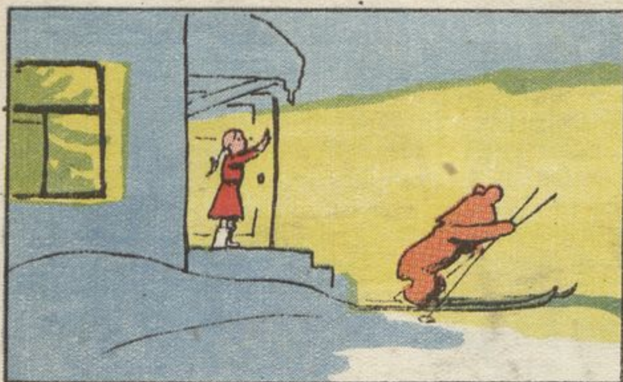
Рис. А. КАНЕВСКОГО

1. Кончился весёлый праздник. Погасла ёлка. „Ну, теперь прощай до весны, — сказал Топтыжка Маше. — Мне спать пора“.