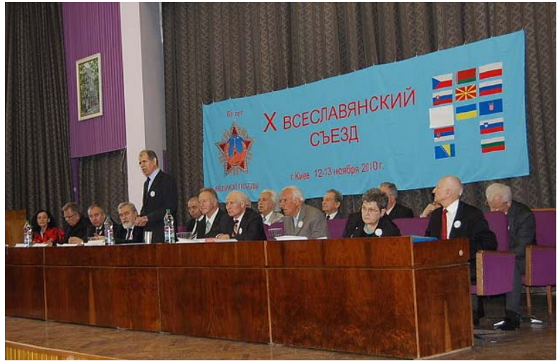
X Всеславянский съезд проходил в Киеве 12-13 ноября 2010 года

ины № 37882А, № 31605). Их суть состоит в том, что больному проводится детоксикация сорбентами с последующим применением препарата «Медихронал». В течение 2-3 часов создается отрицательный условный рефлекс, проводится тестирование пациента на многоплановое поведение при обычных стрессовых ситуациях. Если человек в одной и той же ситуации видит только один выход, то он живёт как будто в одномерном пространстве, у него не сформированы соответствующие модели поведения на стандартную ситуацию без употребления наркотика.