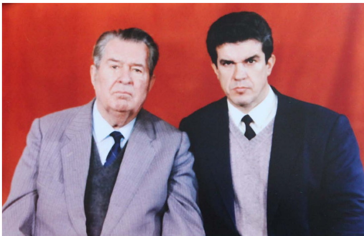
Один из лучших учеников Довженко вместе со своим великим Учителем

В начале 1980-х приказом министра здравоохранения было официально разрешено открытие реабилитационных центров для оказания комплексной помощи больным, страдающим алкоголизмом, где стали