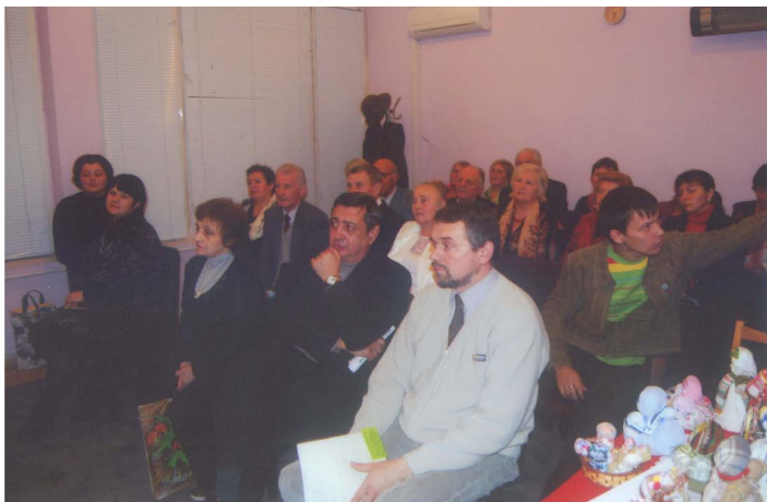
Делегаты Киевской городской организации во время обсуждения докладов

Тесное сотрудничество городской организации общества налажено с Киевским дворцом для детей и юношества. Совместные усилия специалистов Дворца и Общества позволяют эффективно готовить юных пропагандистов здорового, трезвого образа жизни, дают возможность волонтерам получить качественные и твёрдые знания по данной проблеме. Юные борцы за трезвость настойчиво и с интересом овладевают методикой убеждения, постигают непростые механизмы ораторского искусства. Ведь девушки и юноши чётко понимают: чем тверже и глубже будут их