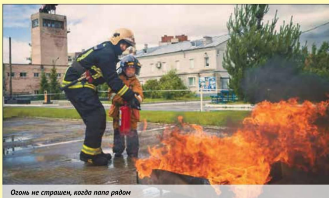
Огонь не страшен, когда папа рядом