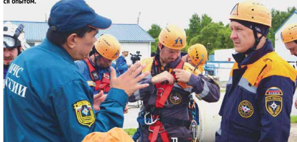
Судьи были строги, но справедливы

Спасатель международного класса — это высшая квалификация, подтверждать которую необходимо каждые три года. Для этого проводятся сборы, дающие возможность проверить себя, совершенствовать профессиональные навыки и, что особенно ценно, обменяться опытом.