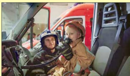
Мои первые слова по рации