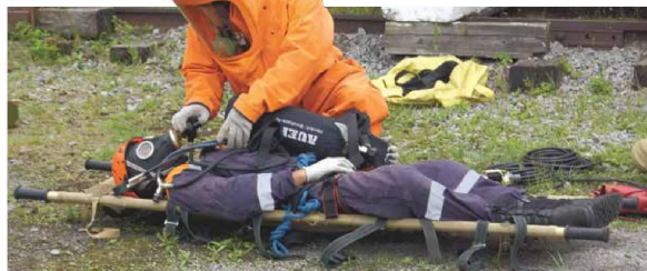
Спасатель должен уметь работать в любой ситуации

На базе Дальневосточного регионального поисково-спасательного отряда МЧС России прошел сбор-семинар спасателей международного класса. В нем приняли участие представители Южного, Сахалинского и Северо-Кавказского ПСО, отряда Центроспас.