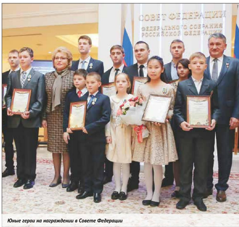
Юные герои на награждении в Совете Федерации