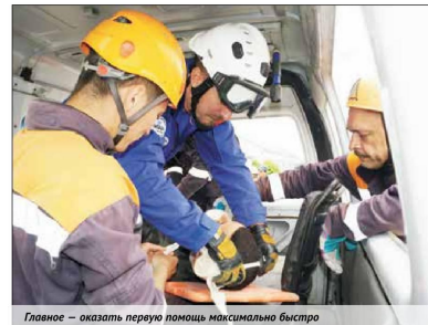
Главное — оказать первую помощь максимально быстро

Елена Чувашова, пресс-служба ДВРПСО МЧС России