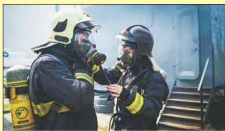
Кто сказал, что подгонка оборудования — не женское занятие?