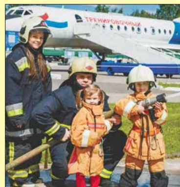
Вся семья в сборе

Если вы тоже хотите участвовать в этой акции, снимайте свое видео в формате до минуты и размещайте в любой социальной сети со специальными тегами. Самые оригинальные ответы будут опубликованы в официальных сообществах чрезвычайного ведомства.