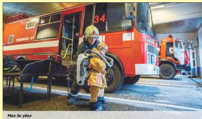
Мал да удал